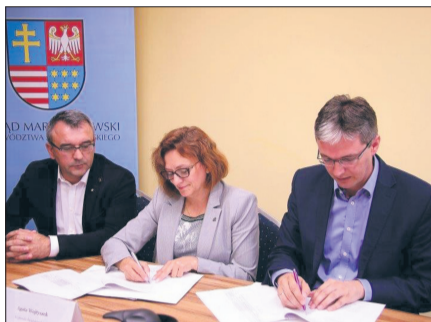
Uroczyste podpisanie umowy odbyło się w Urzędzie Marszałkowskim Województwa Świętokrzyskiego.

Obecnie trwa także międzynarodowe postępowanie przetargowe na wybór wykonawcy robót budowlanych. Na początku września powinna zostać podpisana umowa z wykonawcą, a prace budowlane w ramach projektu ruszą jeszcze w tym roku. Jako pierwsze uruchomione zostaną prace w rejonie Koćmierzowa.