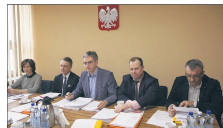
Zarząd Województwa Świętokrzyskiego przyjął projekt uchwały i listy rankingowe projektów w ramach konkursu „Odnowa Wsi Świętokrzyskiej”.

W ramach konkursu wpłynęło w sumie 221 wniosków z 91 gmin. Zarząd Województwa przyjął przygotowane przez komisję konkursową listy rankingowe złożonych wniosków. Zarezerwowany w budżecie województwa 1 mln złotych wystarczy na sfinansowanie 95 projektów inwestycyjnych i 56 związanych z zakupem sprzę-