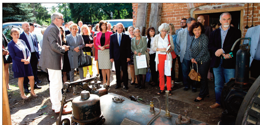
Uroczysta inauguracja Europejskich Dni Dziedzictwa w Młynie Jędrów w Suchedniowie.

Program Europejskich Dni Dziedzictwa w województwie świętokrzyskim można sprawdzić w kalendarium wpisując nazwę regionu pod adresem: http://edd.nid.pl/page/calendar