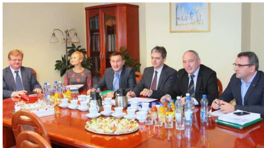
Ostatnie posiedzenie Zarządu Województwa Świętokrzyskiego kadencji 2010-2014.

W ubiegłym tygodniu po raz 251 i zarazem ostatni w tej kadencji obradował Zarząd Województwa Świętokrzyskiego.