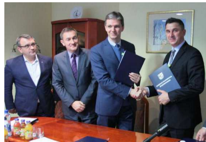
Tuż po podpisaniu Kontraktu Terytorialnego dla Województwa Świętokrzyskiego.

Szacunkowy koszt 53 projektów na listach podstawowej i warunkowej to około 14,3 mld zł. Na liście podstawowej dokumentu znalazło się 15 projektów, wśród nich, między innymi, budowa drogi ekspresowej S-7 Warszawa-Kraków na odcinku Skarżysko-Kamienna – Radom i od Jędrzejewa do granicy z woj. małopolskim, budowa obwodnicy Opatowa w ciągu drogi S-74 oraz obwodnicy Morawicy na drodze krajowej nr 73. Realizowane będą również inwestycje kolejowe,