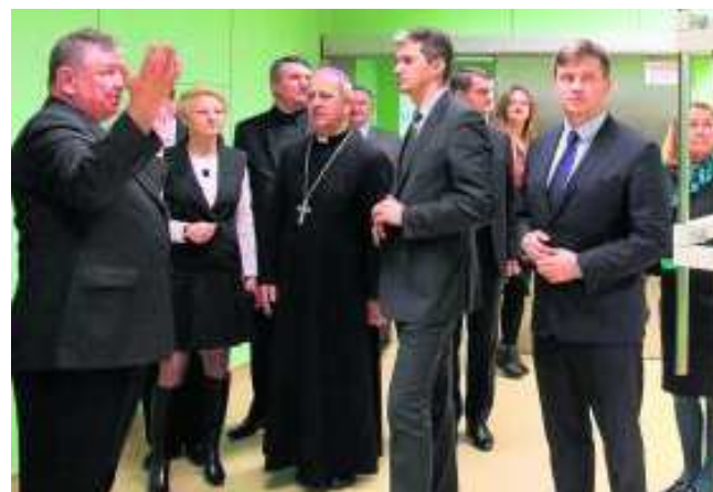
Zwiedzanie nowo wybudowanego szpitalika dziecięcego - goście w jednej z sal diagnostycznych.