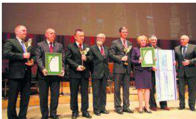
Laureaci i laudatorzy ubiegłorocznej, VI edycji „Świętokrzyskiej Victorii”.

D o 28 stycznia można zgłaszać kandydatów do Nagrody Marszałka Województwa Świętokrzyskiego „Świętokrzyska Victoria”. Honoruje ona najbardziej aktywne firmy, samorządy oraz osobowości. Zwycięzców „Świętokrzyskiej Victorii” za 2014 rok poznamy 17 lutego, podczas uroczystej gali w Filharmonii Świętokrzyskiej w Kielcach. Laureaci otrzymają statuetki, certyfikaty oraz tytuły „Laureat Nagrody Marszałka - Świętokrzyska Victoria”. Celem nagrody jest wspieranie prorozwojowych inicjatyw osób fizycznych i prawnych działających na terenie województwa świętokrzyskiego, promocja dobrych praktyk w zakresie zarządzania i kreowania rozwoju regionu oraz uhonorowanie najbardziej aktywnych samorządów, firm oraz osób. Przy-