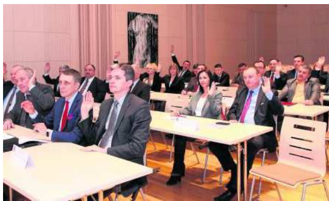
Sesja budżetowa Sejmiku Województwa Świętokrzyskiego odbyła się w Filharmonii Świętokrzyskiej.

R adni Sejmiku Województwa Świętokrzyskiego podczas ostatniej w minionym roku sesji uchwalili budżet województwa na 2015 rok oraz Wieloletnią Prognozę Finansową na lata 2015-2028. Wydatki samorządu województwa w bieżącym roku zaplanowano na poziomie blisko 690 milionów złotych. Najwięcej pieniędzy przeznaczono na transport i łączność – prawie 54 procent. Dochody budżetowe zaplanowane zostały na poziomie 614 mln zł, a wydatki w wysokości prawie 690 mln zł, w tym wydatki majątkowe, czyli przeznaczone na inwestycyjne to 375,5 mln zł. Deficyt budżetu województwa w wysokości 74,6 mln zł zostanie pokryty przychodami pochodzącymi z kredytów (46,7 mln zł) oraz z wolnych środków na rachunku województwa.