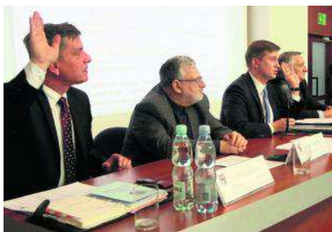
Prezydium Sejmiku Województwa Świętokrzyskiego podczas obrad ostatniej sesji.

Z inicjatywą przyjęcia apelu wystąpił podczas ostatniej sesji Sejmiku klub radnych Prawa i Sprawiedliwości. Radni poparli ją jednogłośnie. W apelu czytamy m.in.: „Nowy układ komunikacyjny na tym terenie to niewątpliwie duża szansa na rozwinięcie działalności przez funkcjonujące tam przedsiębiorstwa oraz tworzenie możliwości pozyskania przez samorządy poważnych partnerów gospodarczych. Konieczny w tym regionie rozwój infrastruktury komunikacyjnej został już uwzględniony w Strategii Województwa Świętokrzyskiego, a odstąpienie od inwe-