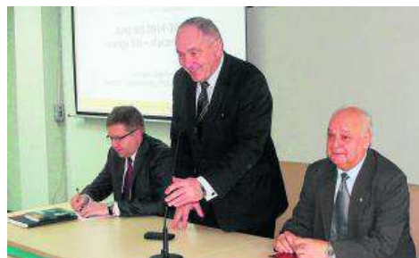
Cykl spotkań rozpoczął w Skarżysku-Kamiennej.

Przedstawiciele urzędu marszałkowskiego spotkali się z samorządowcami z powiatów sandomierskiego i opatowskiego, aby przedstawić poziom zaangażowania prac nad RPO WŚ oraz zaprosić do współpracy przy ustalaniu priorytetowych obszarów, które jako pierwsze powinny zostać przewidziane w konkursach planowanych na II półrocze 2015