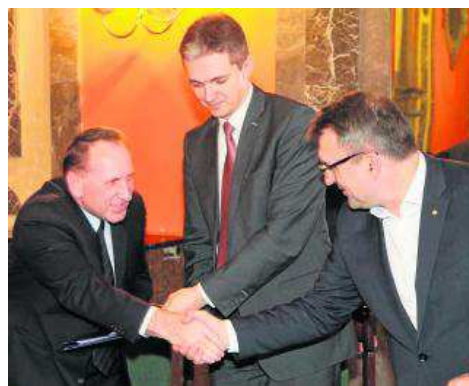
Tuż po podpisaniu ostatnich umów w ramach Programu Rozwoju Obszarów Wiejskich.

- Godne podkreślenia jest to, że wszyscy, którzy złożyli poprawne wnioski w tym działaniu, otrzymali dofinansowanie. Życzmy sobie, by w przyszłej