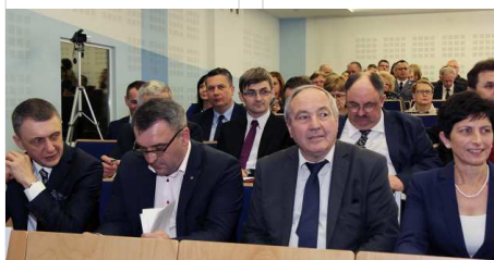
Na pierwszym planie Zarząd Województwa Świętokrzyskiego podczas obrad ostatniej Sesji.

W części merytorycznej obrad, radni jednogłośnie podjęli uchwały o likwidacji aglomeracji