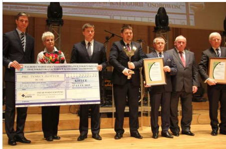
Laureaci i laudatorzy VII edycji „Świętokrzyskiej Victorii”.

„Świętokrzyską Victorię” w kategorii „Osobowość”