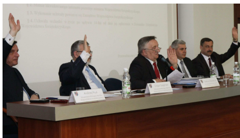
Prezydium Sejmiku podczas obrad ostatniej sesji.

Radni przyjęli informację o działaniach Muzeum Historyczno-Archeologicznego w Ostrowcu Świętokrzyskim w związku z przygotowywanym wnioskiem o wpisanie obiektu „Krzemionki – przedjajłowe kopalnie krzemienia” na Listę Światowego Dziedzictwa UNESCO. Jednocześnie uznali, że samorząd województwa świętokrzyskiego powinien wesprzeć starania władz Muzeum oraz powiatu ostrowieckiego poprzez udzielenie wsparcia organizacyjnego, promocyjnego i finansowego, i z takim apelem radni zwrócili się