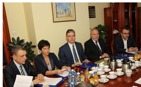
Zarząd Województwa Świętokrzyskiego wystąpi o przejęcie wiślickiego muzeum.

W przypadku Muzeum Regionalnego w Wiślicy sprawa jest ważna i pilna, ponieważ niezwykle zabytki Wiślicy, zwłaszcza wczes-