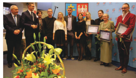
Laureaci i laudatorzy tegorocznej edycji „Świętokrzyskiej Nagrody Kultury”.

Tegoroczna Świętokrzyska Nagroda Kultury trafiła do 15 laureatów. Jest dwustopniowa i przyznawana co roku przez Zarząd Województwa za szczegól-