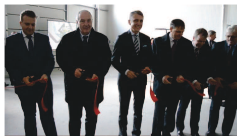
Tuż po symbolicznym przecięciu wstęgi otwierającym nowe laboratorium w Starachowicach

Obiekt powstał dzięki wsparciu unijnemu i dotacji z budżetu państwa. Jego uruchomienie umożliwił realizowany przez Świętokrzyskie Centrum Innowacji i Transferu Technologii Sp. z o.o. oraz Fundację - Agencję Rozwoju Regionalnego w Starachowicach projekt dofinansowany z Regio-