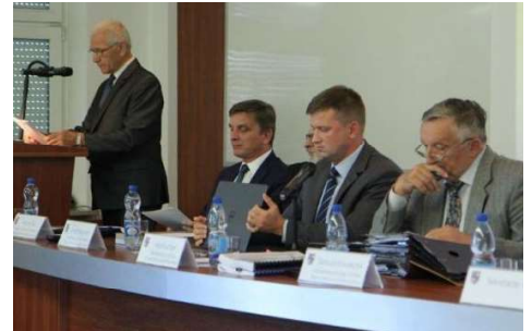
Prezydium Sejmiku podczas obrad.

W dokumencie, który trafi do Prezesa Rady Ministrów oraz Ministra Rolnictwa i Rozwoju Wsi możemy przeczytać m.in.: [...] Sejmik Województwa Świętokrzyskiego wyraża głębokie zaniepokojenie złą sytuacją na rynku