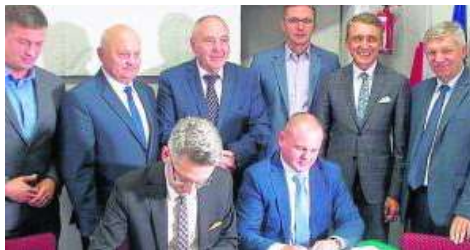
Uroczystość w Urzędzie Gminy w Ćmielowie.