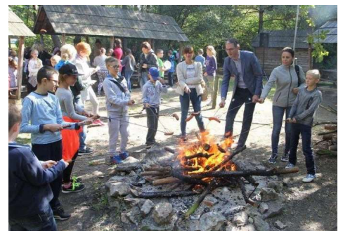
Spotkanie zakończyło wspólne ognisko z marszałkiem.

W wydarzeniu uczestniczyli uczniowie Szkoły Podstawowej w Wąchocku, Publicznej Szkoły