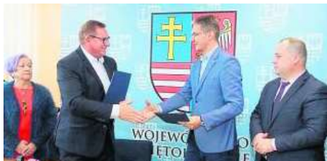
Uroczyste przekazanie umów.

Wartość całej inwestycji to 3 mln 294 tys. złotych. Projekt pod nazwą „Budowa instalacji odwadniania i kompostowania osadów ściekowych na oczyszczalniach ścieków w Gminie Solec-Zdrój” jako jeden z dwóch