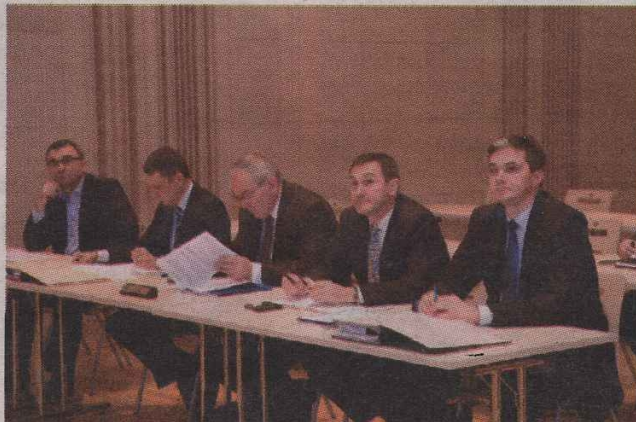
Zarząd Województwa Świętokrzyskiego podczas ostatniej sesji sejmiku.

Wincenty Witos, wybitny przywódca ruchu ludowego i trzykrotny premier Polski w okresie II Rzeczypospolitej wielokrotnie przebywał na ziemi kieleckiej. Radni w apelu zwrócili się do mieszkańców województwa, samorządów, instytucji oświatowych i kulturalnych, organizacji społecznych o przybliżenie i uhonorowanie dokonań Witosa. Uchwała sejmiku została przyjęta na wniosek Klubu Radnych Polskiego Stronnictwa Ludowego. Na zie-