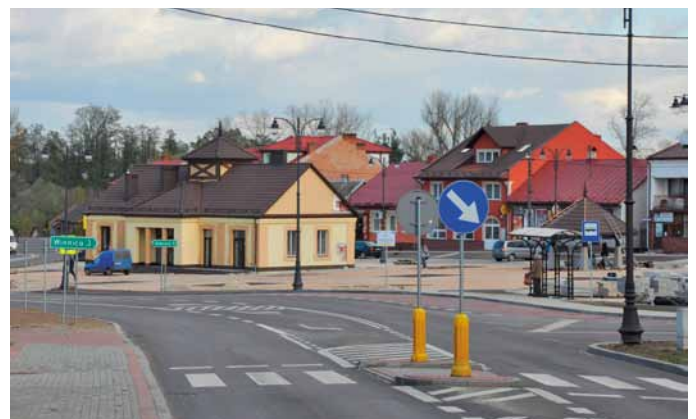
Nowoczesny Rynek - Plac Uniwersału Połanieckiego