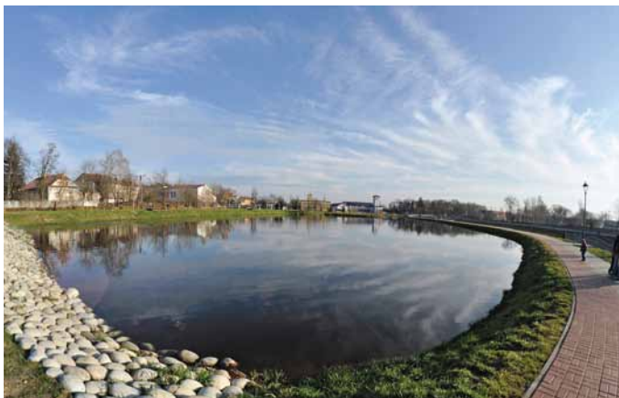
Zalew nad Czarną w Staszowie