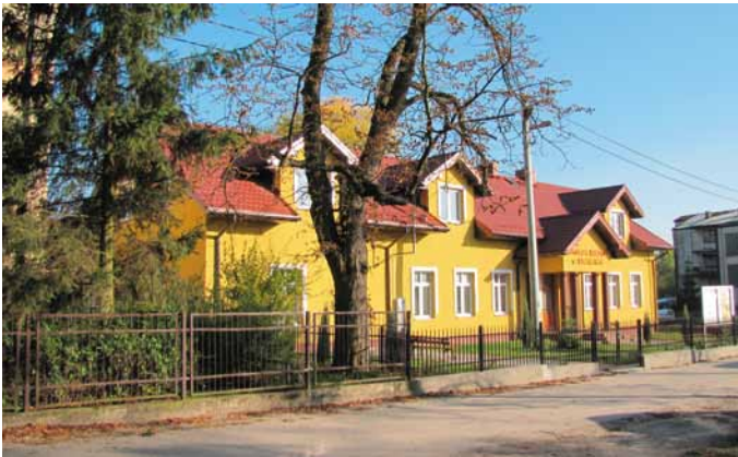
Centrum kultury w Lubnicach