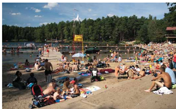
Plaża w Golejowie