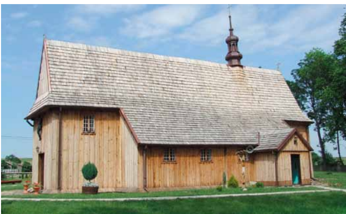
Kościół w Strzegomiu