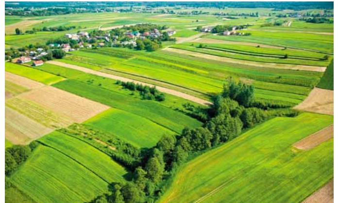
Panorama gminy Bogoria