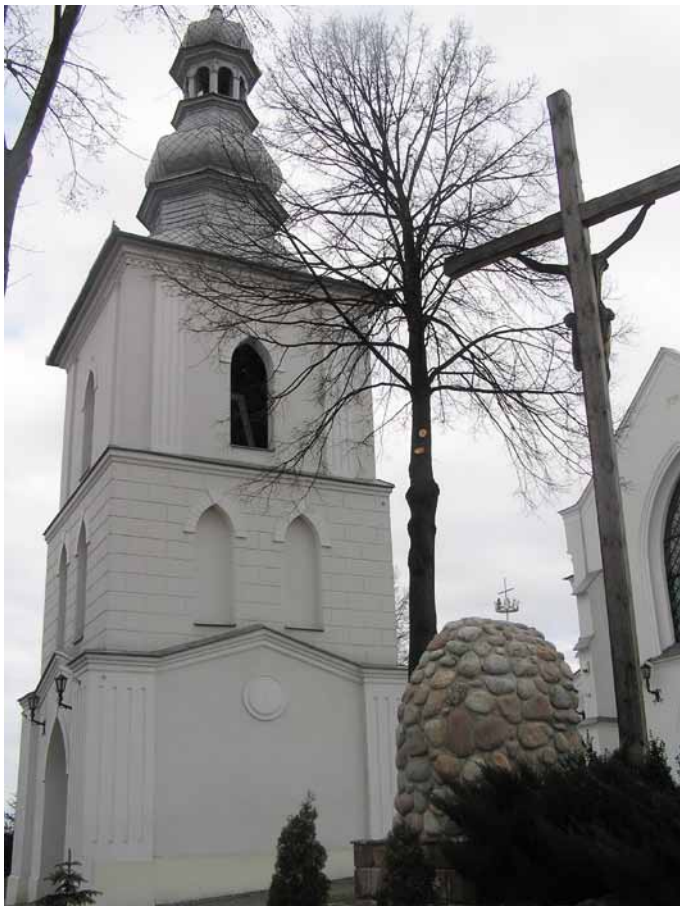
Dzwonnica przy kościele w Oleśnicy

Najbardziej znanym obiektem zabytkowym Oleśnicy jest kościół parafialny p.w. Wniebowstąpienia NMP z połowy XIX w., który został wybudowany na fundamentach gotyckiej świątyni z XV w. Jest to trzeci oleśnicki kościół, a dwa poprzednie zostały zniszczone przez pożar i potop szwedzki. Budowla usytuowana jest na wzgórzu zwanym „górką”. Świątynia powstała z inicjatywy rodziny Oleśnickich. Dzieje kościoła wpisały się na stałe w dzieje Oleśnicy. Na przestrzeni lat pełnił on funkcję zboru kalwińskiego, szpitala i stajni, w czasach, gdy konie były na wagę złota. Zwiedzając kościół warto zwrócić uwagę