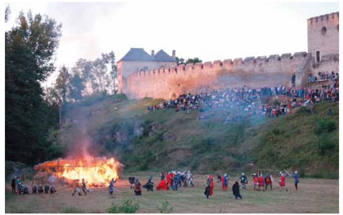
Bitwa o sztyglowski zamek podczas XII Międzynarodowego Turnieju Rycerskiego o Miecz Króla Kazimierza Wielkiego