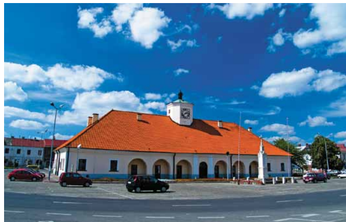
Ratusz w Staszowie