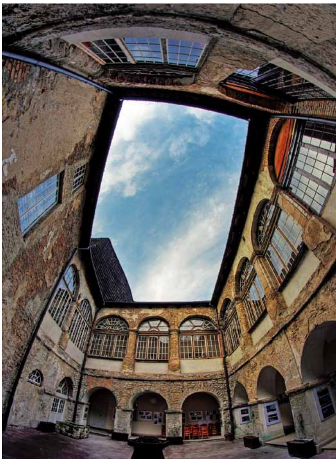
Pałac w Kurozwękach - dziedziniec