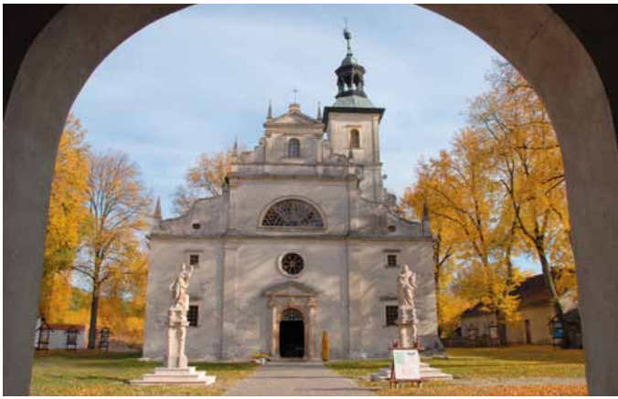
Klasztor pokamedulski w Rytwianach