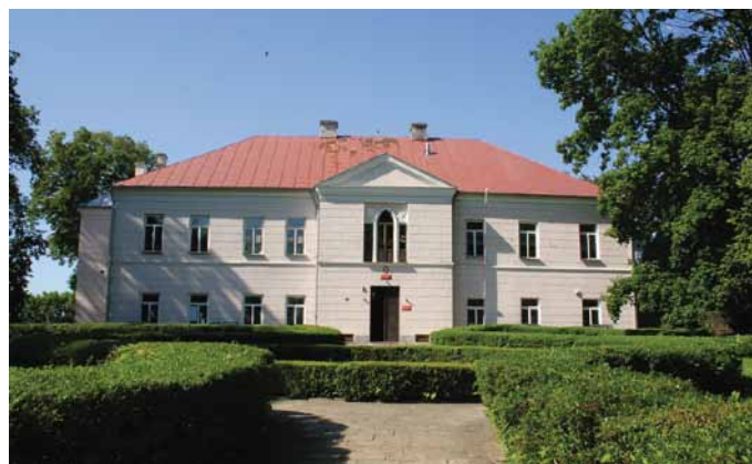
Pałac w Wiśniowej