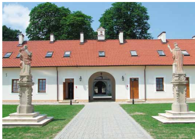
Pustelnia Złotego Lasu w Rytwianach

Powiat posiada zróżnicowane warunki do produkcji rolniczej. Konieczność dokonywania zmian strukturalnych w rolnictwie, spowodowała w ostatnich latach szybki rozwój upraw warzyw, głównie pod folią. Równie dynamicznie wzrasta produkcja owoców. Przewoduje w tym gmina Szydłów, gdzie warunki klimatyczne – glebowe sprzyjające temu rodzajowi działalności. Powierzchnia sadów w tej gminie, głównie śliwkowych, wynosi aktualnie 975 ha, a roczne zbiory tych owoców, to ponad 15 tys. ton. Wraz z regionem sandomierskim, powiat staszowski stanowi znaczącą bazę surowcową owoców i warzyw dla przemysłu spożywczego.