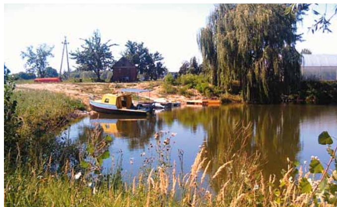
Zbiornik wodny w Budziskach - Żwirownia