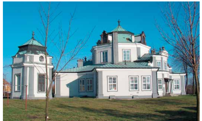
Orientalny pałac w Grabkach