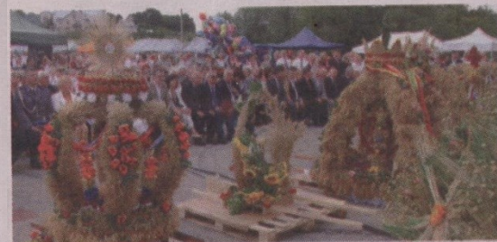
Przed sceną ustawiono 15 najpiękniejszych wieńców wybranych na gminnych dożynkach w całym starostwie.