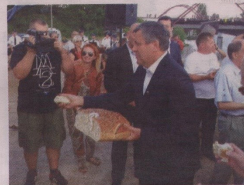
Żałogę świętokrzyskiego pływającego młyna witał między innymi wicepremier Janusz Piechociński.