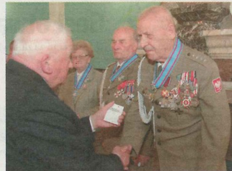
Kombatancki byli bardzo zadowoleni, że docenia się ich rolę w walce o Polskę.