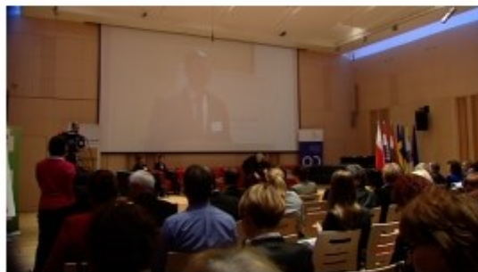
Informacja to podstawa sukcesu

Jak skutecznie kształtować wizerunek Polski za granicą i w jaki sposób wzmacniać samorządowy wymiar polityki zagranicznej? Między innymi na te pytania szukano odpowiedzi podczas konferencji pod nazwą „Świętokrzyska Platforma Współpracy Zagranicznej”, która odbyła się dziś w Kielcach. W trakcie spotkania zaprezentowano interaktywną platformę internetową, która ma być wsparciem dla świętokrzyskich przedsiębiorców czy instytucji kultury.