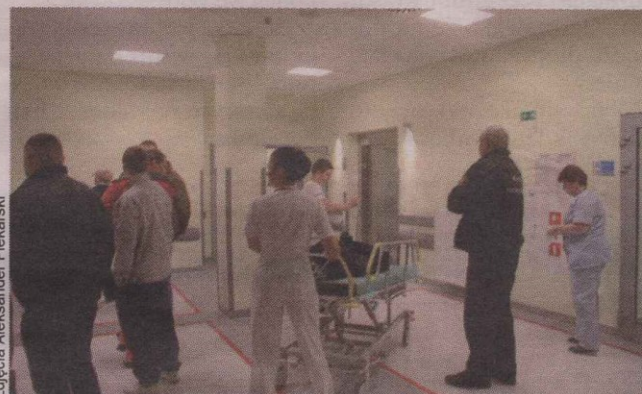
Z pacjentem do windy, na pierwsze piętro, potem łącznikiem do głównego budynku szpitala, jeśli jest potrzebna konsultacja np. ginekologiczna lub laryngologiczna.