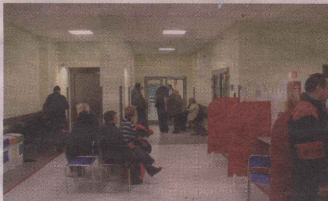
Recepcja w nowym Szpitalnym Oddziale Ratunkowym na Czarnowie ma więcej miejsca dla pacjentów.

dratowych). Budowa kosztowała 16,2 milionów złotych. Obiekt ma dwie sale operacyjne oraz 10-lóżkowy oddział ortopedii, pomieszczenie do diagnostyki, dekontaminacji. Z głównym budynkiem szpitala połączony został łącznikiem. W nowym oddziale wydzielone zostało miejsce dla chorych znajdujących się pod wpływem alkoholu. Rocznie na Szpitalny Oddział Ratunkowy przy Szpitalu Wojewódzkim trafia 130-140 tysięcy chorych z całego województwa. /IB/