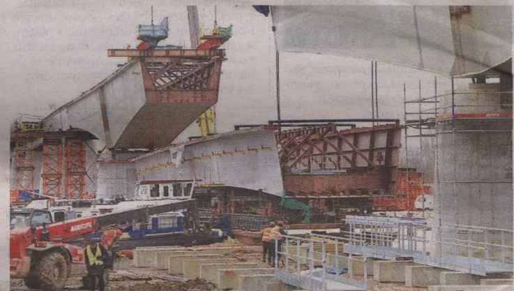
Na gotowej konstrukcji powstaną jezdnia, ścieżka rowerowa i ciągi piesze.

Budowa mostu na Wiśle w Połańcu to wspólna inwestycja województw podkarpackiego i świętokrzyskiego. Zadanie wartości