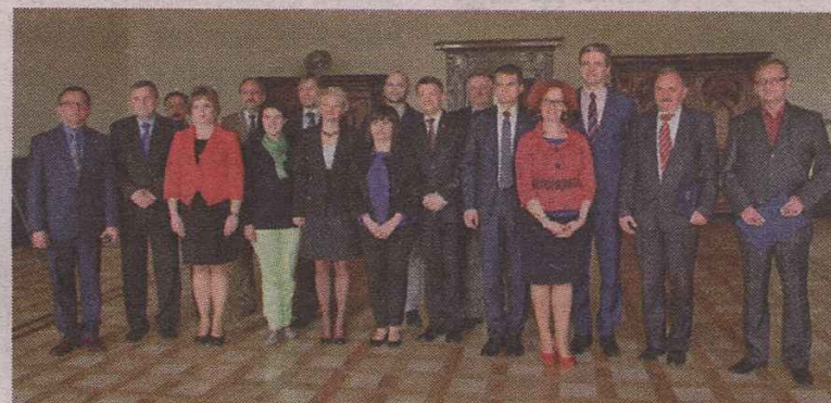
Członkowie komitetu honorowego wojewódzkich obchodów 100. Roczniczy Czynu Niepodległościowego Polaków podczas I wojny światowej.