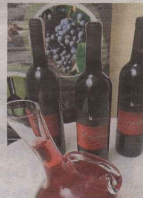
► Wino z Winnicy Nad Jarem w powiecie sandomierskim.