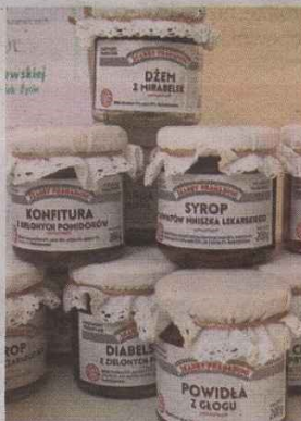
► Wyroby Fundacji Domy Wspólnoty Chleb Życia.