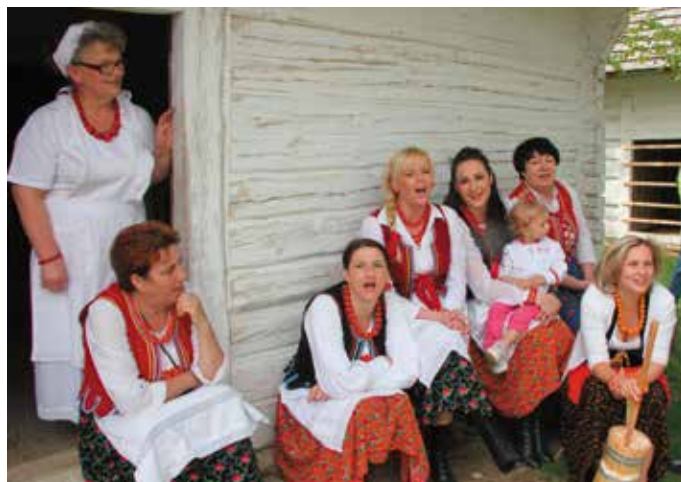
Ubiegłoroczny Jarmark Agroturystyczny