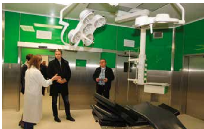
Śłużba zdrowia była najważniejszym tematem wizyty marszałka w powiecie opatowskim

zapoznał się z zamierzeniami inwestycyjnymi. Powiat przygotowuje wnioski o dofinansowanie z Regionalnego Programu Operacyjnego budowy hali sportowej oraz modernizacji warsztatów szkolnych w tej placówce, która kształci m. in. na kierunkach technik pojazdów samochodowych i technik mechanizacji rolnictwa. – Obecnie, po okresie boomu na szkoły