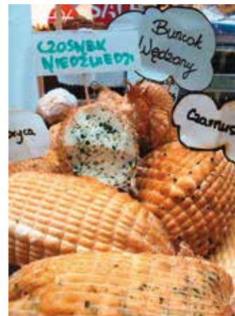
Słynny buncok strzałkowski z gospodarstwa Łukasików ze Strzałkowa jest produktem wytwarzanym metodą tradycyjną

Kontakt: ŚODR Modliszewice Dział Przedsiębiorczości, Wiejskiego Gospodarstwa Domowego i Agroturystyki tel. 41 372 22 84 do 86