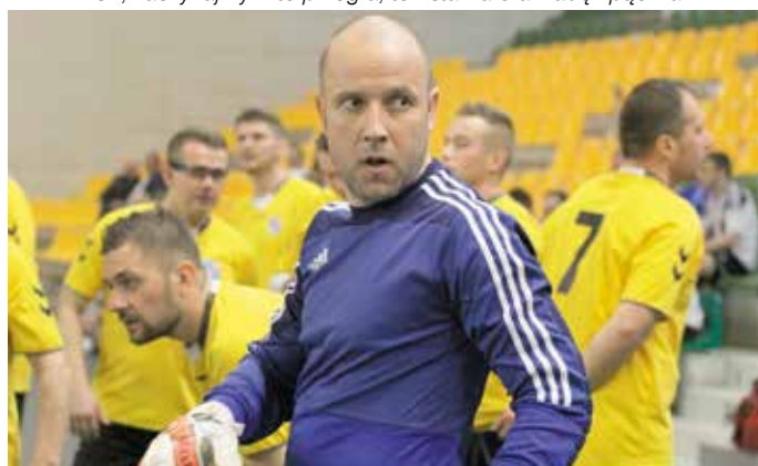
– Nie pękać panowie! Sportowo jesteśmy słabsi, ale postraszę ich spojrzeniem...