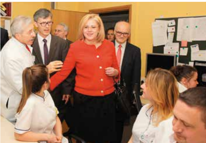
Komisarz Cretu mogła przyjrzeć się codziennej pracy w ŚCO