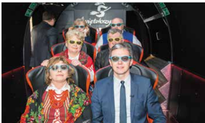
A my mamy do pary humoru okulary!