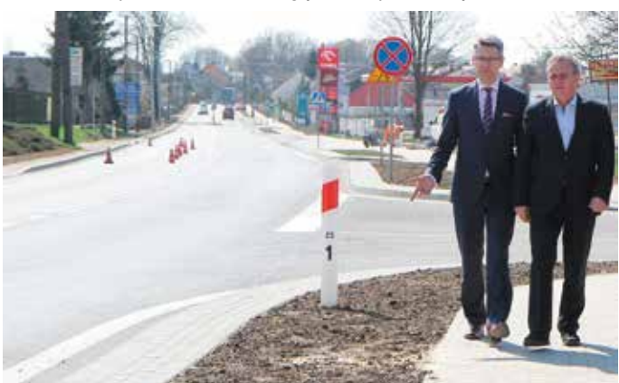
- A na tej rabacie, panie burmistrzu, posiejemy stokrotki.