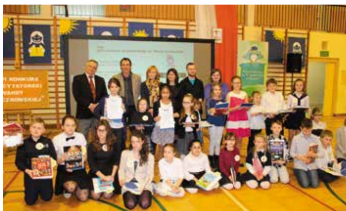
Finale XXVI Konkursu Recytatorskiego w SSP w Ostojowie