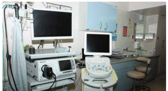
Taki sprzęt będzie pomagał w leczeniu chorych