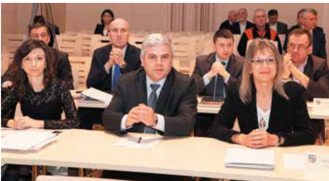
Radni Sejmiku podczas sesji w Filharmonii Świętokrzyskiej