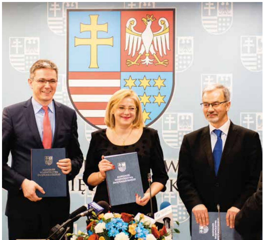
Po podpisaniu listu intencyjnego w ramach inicjatywy Lagging Regions

- Jest mi niezwykle miło, że możemy dziś gościć tak znakomitych gości na czele z panią Coriną Crețu, Komisarz ds. Polityki Regionalnej. Jest to dla nas ogromny zaszczyt. Wizyta Pani Komisarz związana jest z nową inicjatywą Unii Europejskiej, Lagging Regions. Jej celem jest zidentyfikowanie największych przeszkód w rozwoju regionu i wspólne wypracowanie