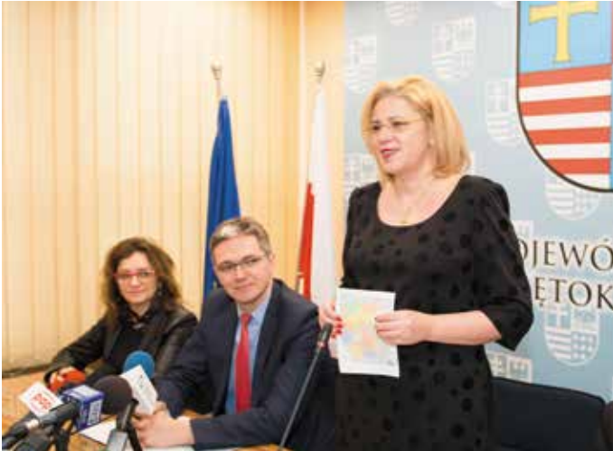
Komisarz Cretu cieszyła się z odwiedzin w Świętokrzyskiem