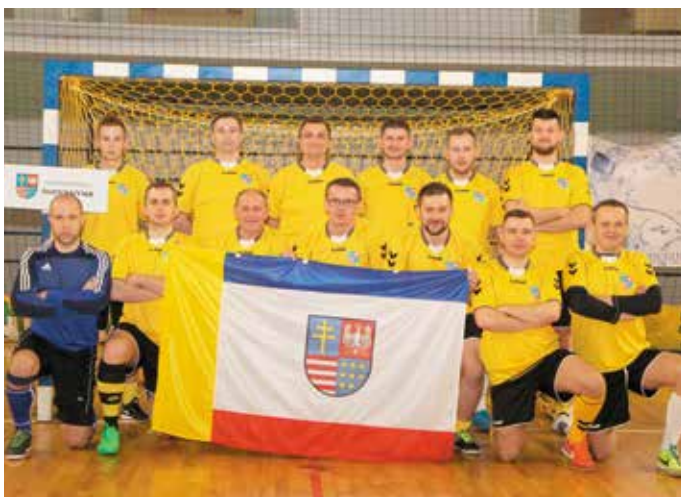
Reprezentanci Urzędu Marszałkowskiego Województwa Świętokrzyskiego