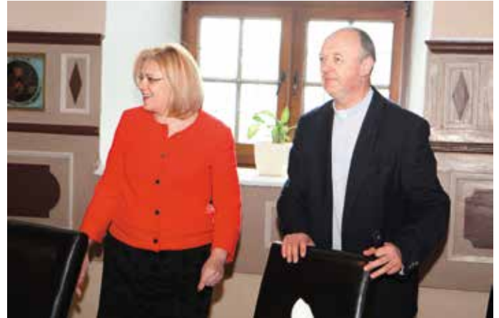
W programie wizyty Komisarz Cretu w stolicy województwa świętokrzyskiego znalazł się również Klasztor Księży Palotynów na Wzgórzu Karczówka w Kielcach

pozostaje bez pracy i mamy nadzieję, że wspólnie będziemy mogli sprostać wyzwaniom stojącym przed tym regionem – mówiła Komisarz Corina Crețu .