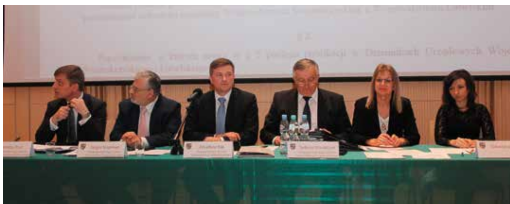
Prezydium Sejmiku i sekretarze obrad

- W świetle przepisów, które mają wejść w życie wraz z początkiem roku 2017, województwo będzie organizatorem publicznego transportu zbiorowego. W trakcie prac okazało się, że są linie, które są bardzo