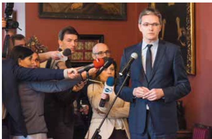
Marszałek zachęcał, aby mieszkańcy regionu podejmowali inicjatywy przypominające pisarza