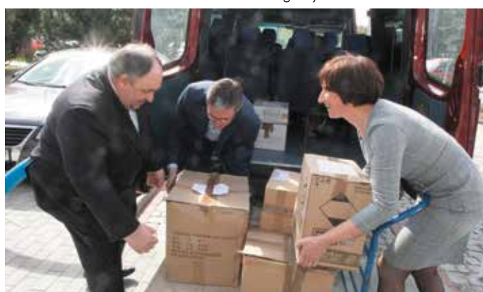
– Panie Krzysztofie, podnosimy na trzy-cztery! – Ok, zaczynamy! Kto przegra, ten stawia oranżadę i pączka!