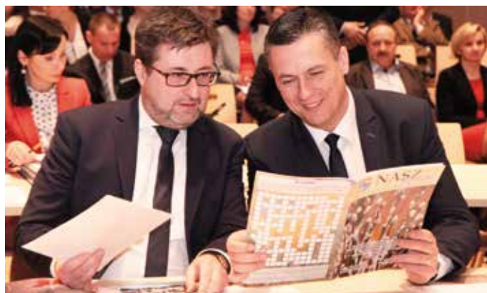
– Piszą, że nas podpatrują i podsłuchują! – Permanentna inwigilacja!