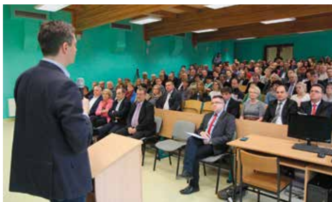
W spotkaniu z marszałkiem Adamem Jarubasem uczestniczyło około 150 przedsiębiorców, samorządowców i dyrektorów instytucji

Marszałek odwiedził m. in. Dom Pomocy Społecznej w Zochcinku, Warsztaty Terapii Zajęciowej w Opatowie, nowo otwarty Dom Pomocy Społecznej w Suchodółce, który mieści się w wyremontowanym budynku przejętym od samorządu Ożarowa. Gospodarz województwa obejrzał również obiekty Zespołu Szkół Zawodowych w Ożarowie, a w Zespole Szkół nr 1 w Opatowie