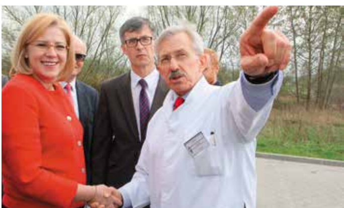
– O, widzi pani Komisarz?! Bociany lecą. – Pewnie na Grunwaldzką, na porodówkę!