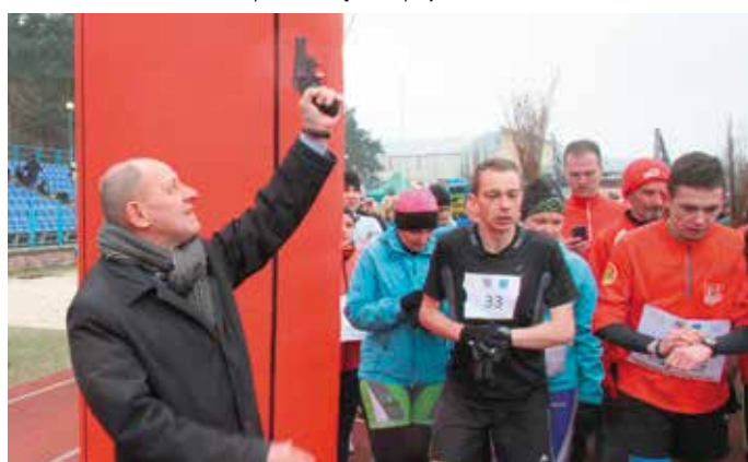
– Gotowi? Trzy, dwa, jeden!