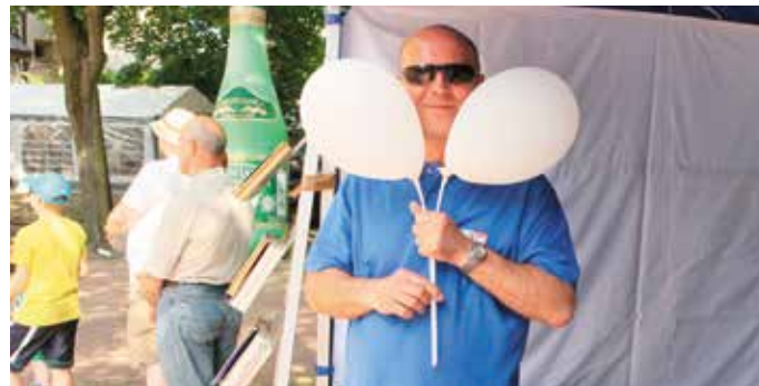
- Jak byłem mały, to o! Takie miałem puce!