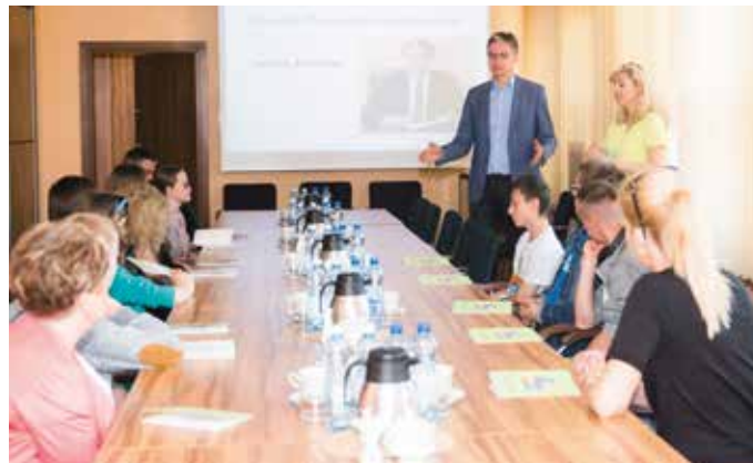
Uczniowie zadawali wiele pytań i chętnie uczestniczyli w zajęciach

Uczniowie chętnie odpowiadali na pytania oraz aktywnie uczestniczyli w zajęciach, podczas których dowiedzieli się