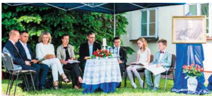
W szkole w Koniecznie uczniowie i goście czytają Henryka Sienkiewicza