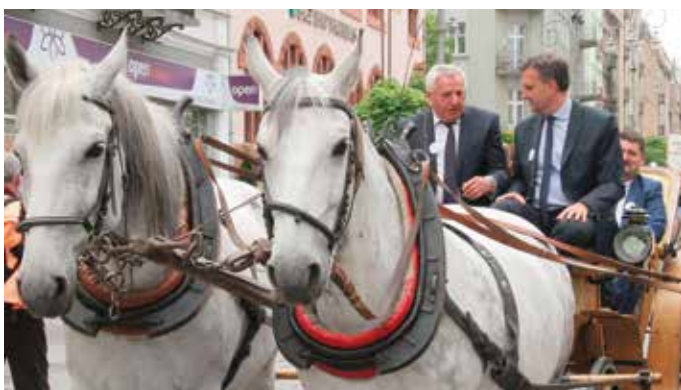
- Wio koniku, a jak się postarasz na kolację zajedziemy akurat, tobie owsa nasypiemy zaraz, a ja z miski smaczną zupę będę jadł!