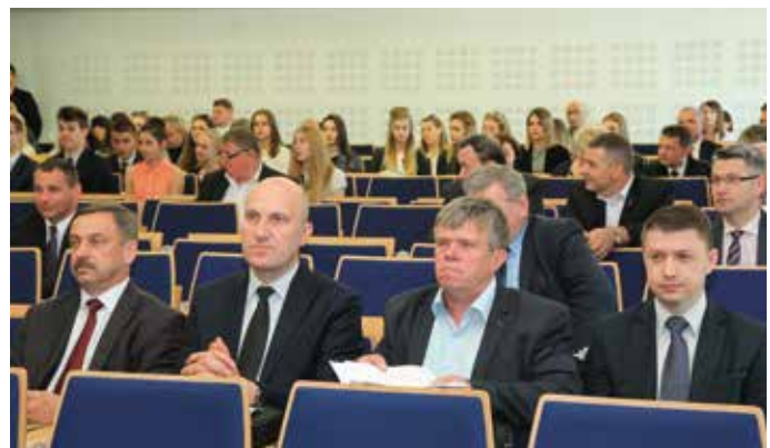
Radni Sejmiku podczas sesji