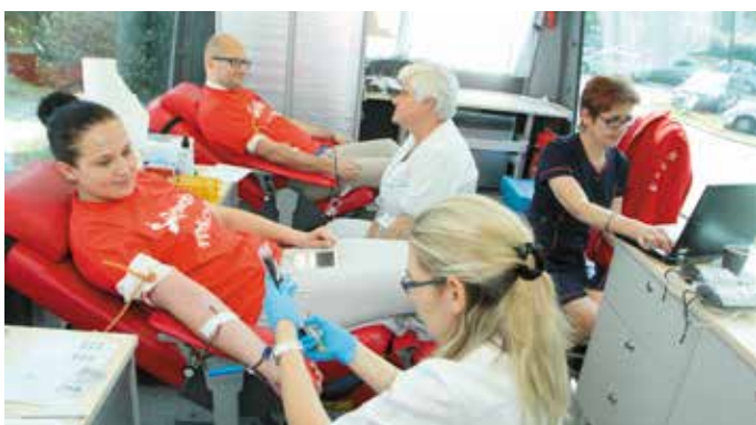
- A mówiła pani, że będzie błękitna...