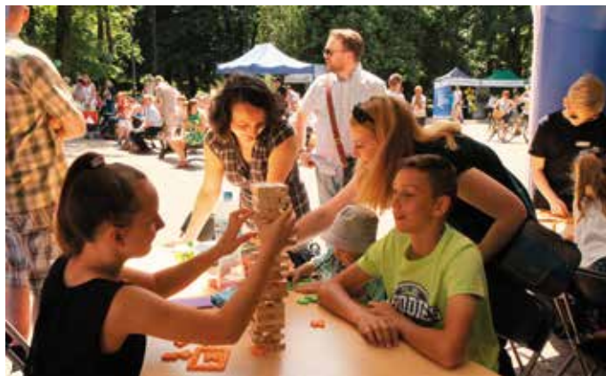
Oddział ds. Innowacji i Transferu Wiedzy Departamentu Polityki Regionalnej UMWS przygotował logiczne łamigłówki

Przygotowane atrakcje przyciągnęły do parku całe rodziny. Dorośli chętnie korzystali z możliwości zbadania swojego zdrowia na stoisku Wojewódzkiego Ośrodka Medycyny Pracy w Kielcach , gdzie mierzono ciśnienie tętnicze, oznaczano poziom cukru we krwi oraz udzielano porad, jak skutecznie rzucić palenie. Nie brakowało zainteresowania, zwłaszcza u pań, zabiegami kosmetycznymi oraz masażami,