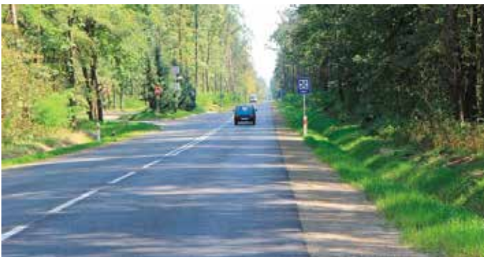
Droga od granic Kielc do skrzyżowania na Widelki jest w planie modernizacji