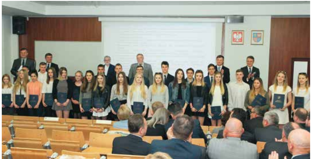
Stypendyści za osiągnięcia sportowe zostali uhonorowani przez Samorząd Województwa