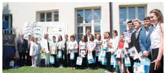
Rozstrzygnięcie konkursów, w których udział wzięli uczniowie ze szkół z gminy i powiatu włoszczowskiego