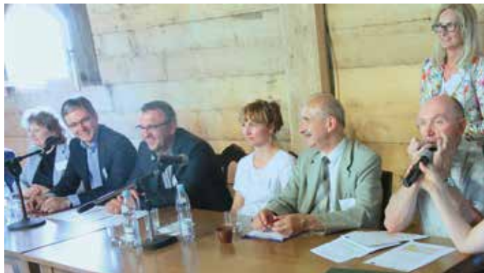
Integracji sprzyjała wesola i serdeczna atmosfera

Spotkanie zapoczątkowały wykłady, podczas których prelegenci zachęcali młodzież i seniorów do współpracy i orga-