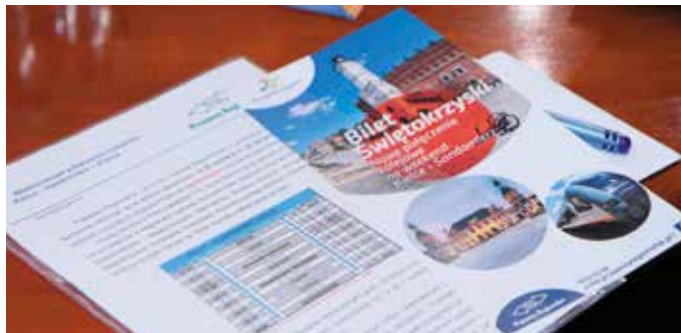
Oferta Biletu Świętokrzyskiego już teraz jest jedną z najatrakcyjniejszych ofert w kraju

Do obsługi tej trasy przeznaczony został nowo zakupiony i komfortowy trójczłonowy pociąg o nazwie Acatas Plus, wyposażony w 155 miejsc siedzących i dostosowany do przewozu dużych bagaży (rowerów), z dostępem do internetu i gniazdami elektrycznymi