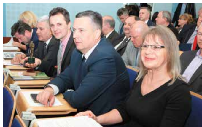
W czasie obrad