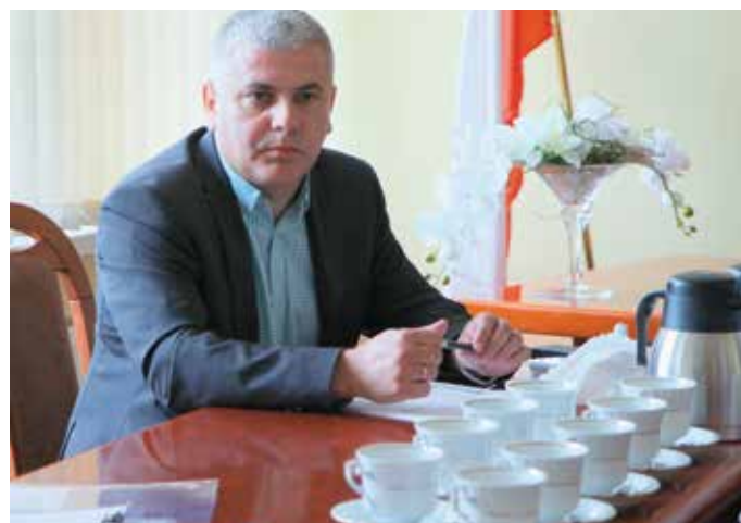
- Chciałbym także zdementować pojawiające się ostatnio plotki, jakoby podczas obrad komisji miał wypijać aż dziewięć kaw...