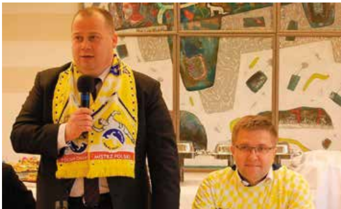
- Pragnę poinformować, że po długich negocjacjach dopieśliśmy w końcu kontrakt z klubem Vive Tauron Kielce. Od 1 lipca ja wzmocnię bramkę, natomiast pan dyrektor będzie grał na skrzydle