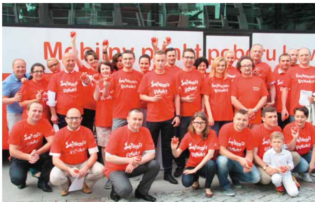
„Krewniacy” z Urzędu Marszałkowskiego Województwa Świętokrzyskiego

Tradycyjnie od wielu lat, pracownicy Urzędu Marszałkowskiego Województwa Świętokrzyskiego z okazji Dnia Dziecka oddają krew dla chorych dzieci przebywających w świętokrzyskich szpitalach. Nie inaczej było i w tym roku. W środę, 1 czerwca, w godz. 9.00-12.00 przed budynkiem Urzędu Marszałkowskiego dyżurował specjalistyczny autobus Regionalnego Centrum Krwiodawstwa i Krwiolecznictwa w Kielcach, w którym kilkudziesięciu urzędników, pracowników Muzeum Narodowego oraz kielczan oddawało ten najcenniejszy dla życia dar, w sumie pobrano 13,5 l krwi.