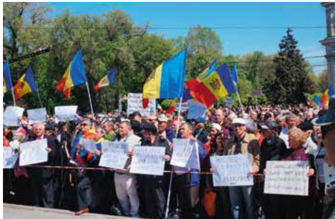
Protesty na mołdawskich ulicach