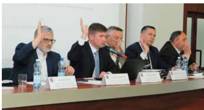
Głosami radnych Muzeum Regionalne w Wiślicy zostało włączone do Muzeum Narodowego w Kielcach

- Obecny dorobek sportowców w tym roku jest tak znako-