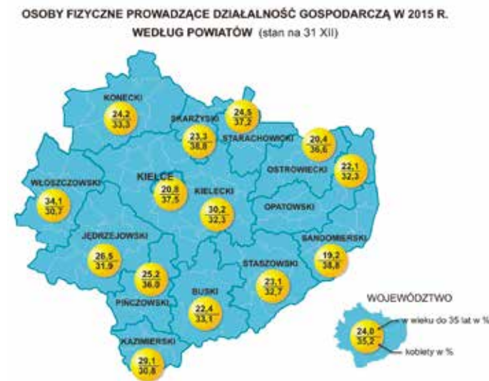
Osoby fizyczne prowadzące działalność gospodarczą w 2015 r. (stan na 31 XII)

Z punktu widzenia wielkości podmiotów nadal dominowały firmy małe (o liczbie pracujących do 9 osób), których w rejestrze REGON było ponad 95% (105,6 tys.). W klasie jednostek średnich, o liczbie pracujących od 10 do 49 osób, znalazło się prawie 4% całej zbiorowości, a dużych, o liczbie pracujących 50 osób i więcej – niespełna 1%. Spośród podmiotów małych co trzeci prowadził działalność