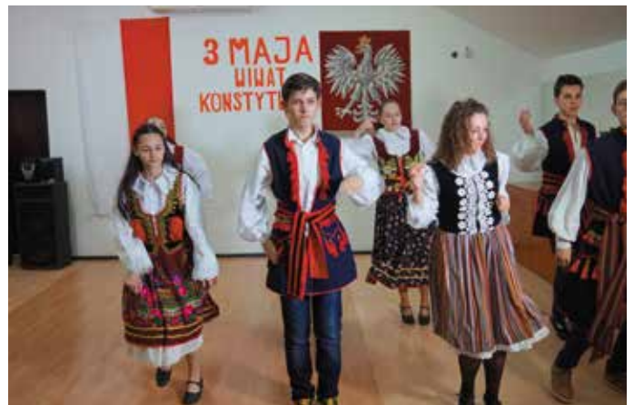
Dom Polski w Bielcach