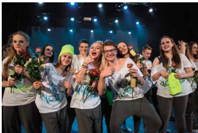
Po zakończeniu spektaklu