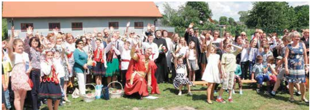
Wojewódzka inauguracja akcji „Świętokrzyskie czyta Sienkiewicza”

- Dziękuję nauczycielom z całej gminy i powiatu za przygotowanie tej inauguracji. Dzień Dziecka połączyliśmy z pod-