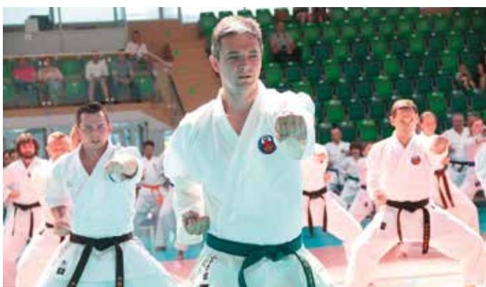
- Gdy trzeba będzie ja ciebie obronię, znam parę chwytów, ciałem zastonię, ciosy karate ćwiczyłem z bratem - ja jestem „King Bruce Lee Karate Mistrz”!