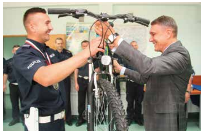
- Zarząd Województwa zdecydował, że z okazji pierwszej komunii dostanie pan od samorządu rower!