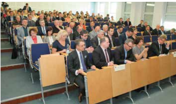
Sesja cieszyła się dużym zainteresowaniem przybyłych gości