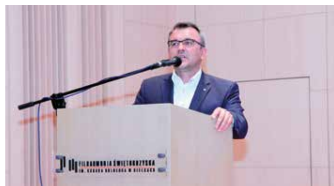
- Jesteśmy w Filharmonii Świętokrzyskiej więc przy okazji pozwolę sobie wykonać „Szumią jodły na gór szczytce”.