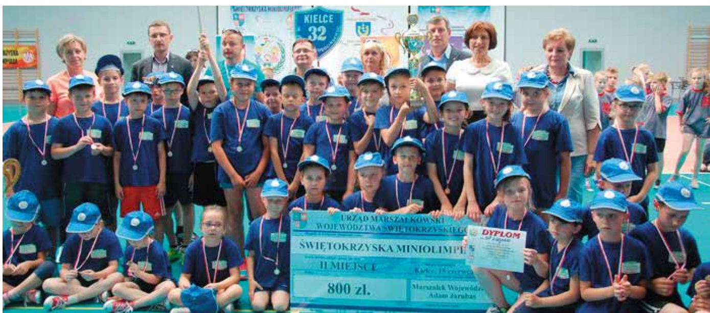
Laureaci II miejsca - uczniowie Szkoły Podstawowej w Łopusznie