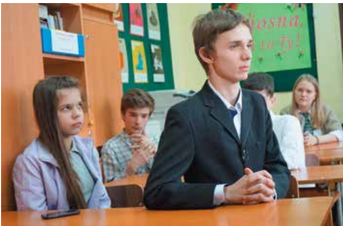
Polska klasa w liceum