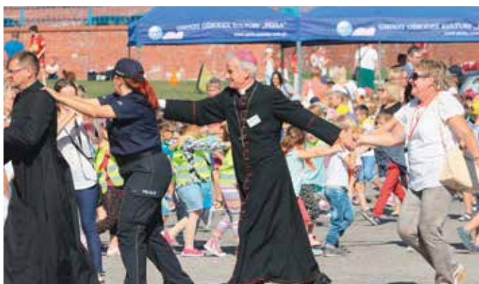
Kółko graniaste, czworokanciaste, kółko nam się połamało, cztery grosze kosztowało, a my wszyscy bęc!