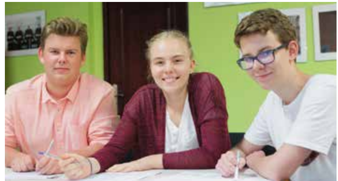
Mają po kilkanaście lat, ale nie boją się wielkich wyzwań

Dzięki młodzieży działającej przy Stowarzyszeniu Miłośników Ziemi Korczyńskiej dowiedziałam się, że Nowy Korczyn miał kiedyś takie samo znaczenie jak Kraków. Znajduje się tu