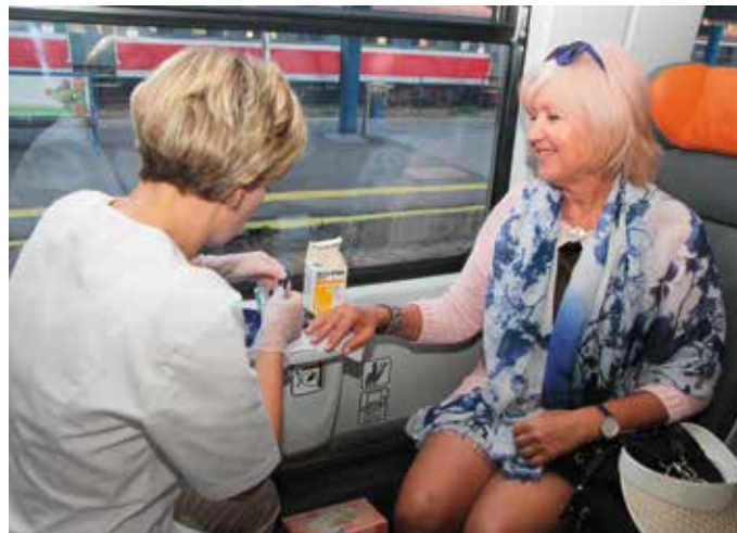
Podczas akcji m.in. mierzono poziom glukozy we krwi

- Przywiozłam fantomy do nauki samodzielnego badania