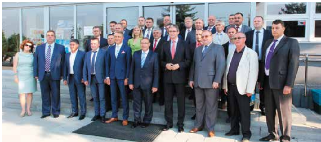
Pamiętna fotografia przed budynkiem Urzędu Marszałkowskiego w Kielcach