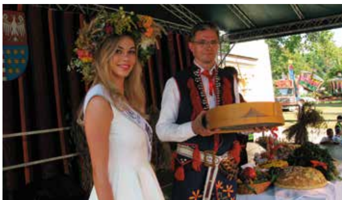
Marszałek częstował chlebem wraz z Miss Ziemi Świętokrzyskiej

potem częstowali gości uroczystości. W części artystycznej przygotowanej przez Wojewódzki Dom Kultury im. Józefa Piłsudskiego w Kielcach odbyło się folkowe widowisko regionalne „Na swojską nutę”, podczas którego zaprezentowały się zespoły i kapele kultywujące