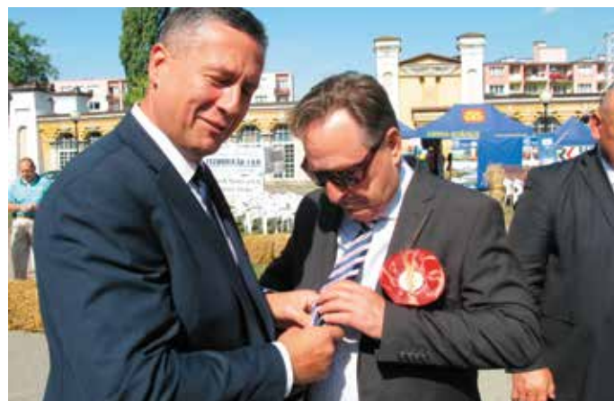
- Indyjski jedwab wyczuwam z zamkniętymi oczami...