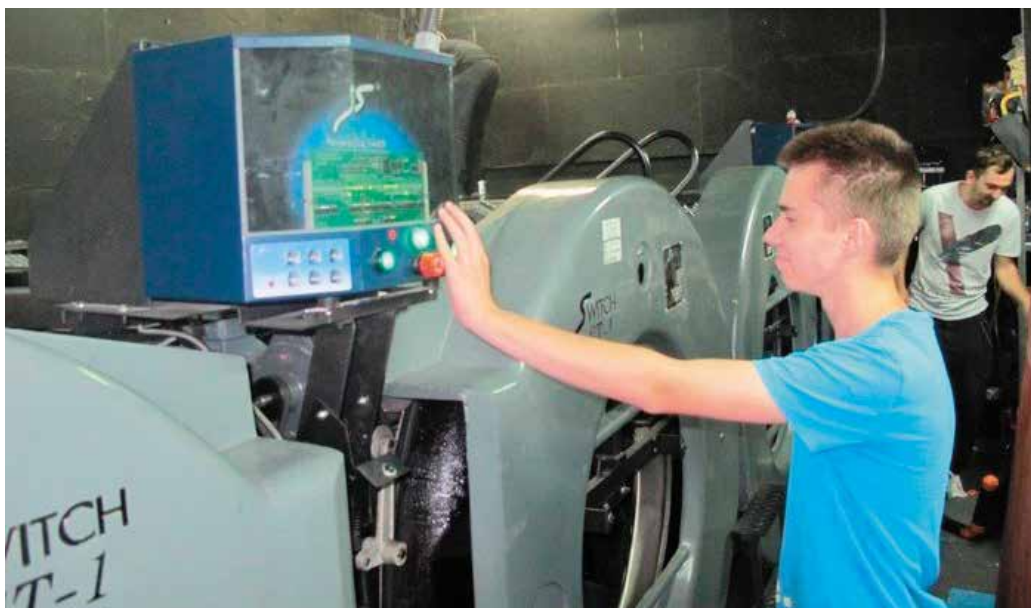
W ramach projektu uczniowie otrzymali stypendium stażowe, a pracodawcy zwrot kosztów przygotowania stanowiska pracy i wynagrodzenia opiekuna

Partnerami projektu są: Świętokrzyskie Centrum Innowacji i Transferu Technologii, Świętokrzyski Związek Pracodawców Prywatnych Lewiatan, Świętokrzyskie Centrum Doskonalenia Nauczycieli oraz Centrum Kształcenia Praktycznego.