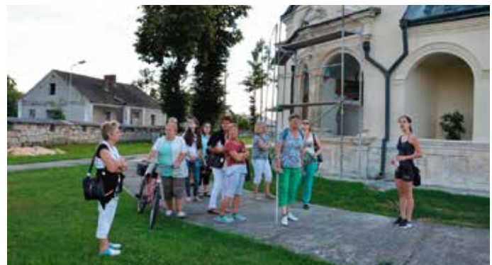
Stowarzyszenie Miłośników Ziemi Korczyńskiej

tak wiele cennych zabytków, że pozazdrościłoby mu nie jedno miasto w Polsce. Jest o czym opowiadać, dlatego w te wakacje grupa młodzieży uczyła się jak być przewodnikiem po Nowym Korczynie. Na wydarzeniu kończącym działania młodych przewodników usłyszałam bardzo ważne zdanie od jednej z dziewczyn: - Ja myślałam, że