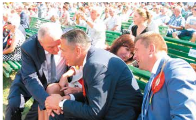
- O czym szepczą? - Nie wiem, mówią strasznie cicho...