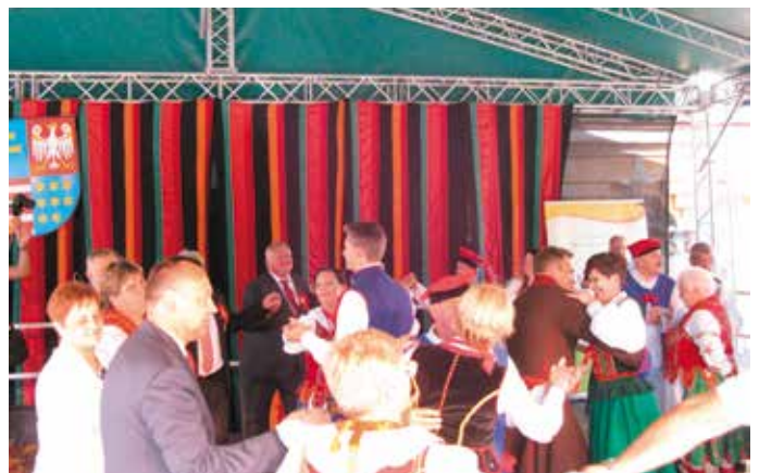
Obtarczanie dożynkowego wieńca