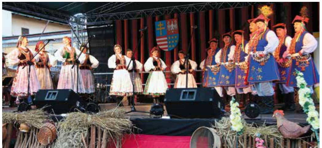
Zabawie towarzyszyły liczne występy artystyczne

Podczas Dożynek Wojewódzkich wręczone zostały również nagrody w konkursach rolniczych. W konkursie „Piękna i bezpieczna zagroda, przyjazna środowisku” pierwsze miejsce przyznano dwóm gospodarstwom: