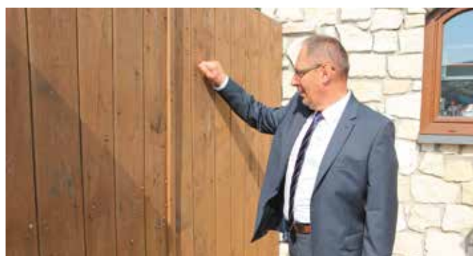
- Otwierać! - Kto tam? - No, to przecież ją, wasz wójt!