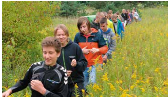
Gra plenerowa dla dzieci