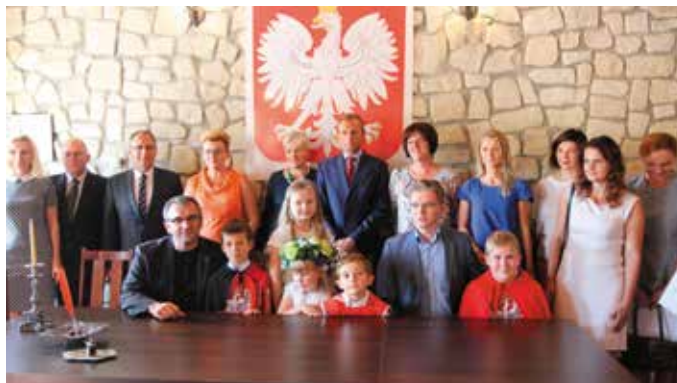
Najmłodszy - to z myślą o nich podpisane zostały umowy

Poddziałanie, którego dotyczyło podpisanie dzisiejszych umów umożliwia zakładanie nowych przedszkoli oraz zwiększenie liczby miejsc w już ist-