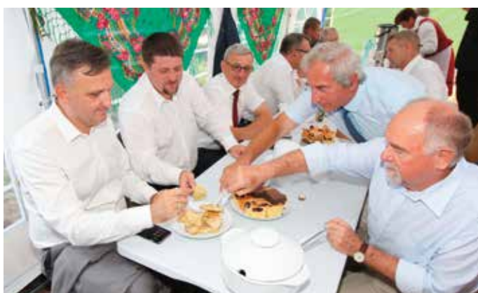
- Panowie, pierogi są moje! Chociaż jednego zostawcie!