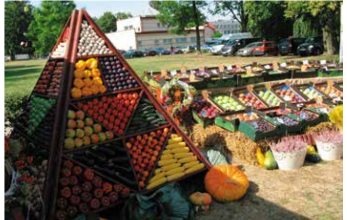
Owoce z sandomierskich sadów