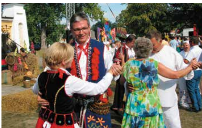
- Pani Joanno, a gdybyśmy tak spróbowali sił w „Tańcu z Gwiazdami”?