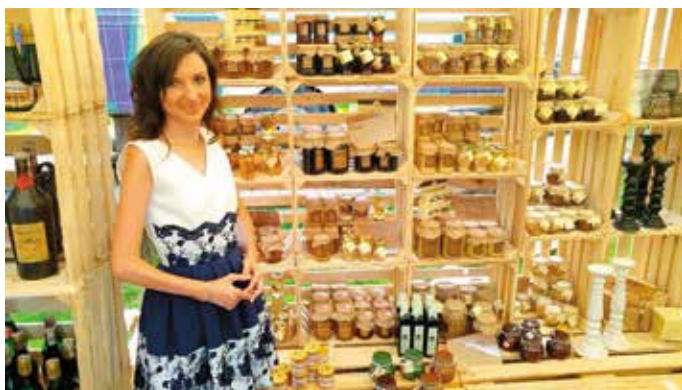
- Im mniej cię co dzień, miodzie - tym mi smakujesz słodziej!