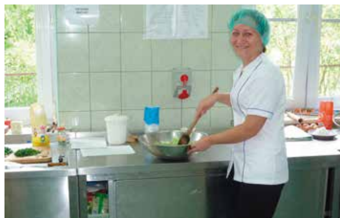
Dzięki praktykom nauczyciele podnieśli swoje kompetencje m.in. w kierunkach związanych z żywieniem i usługami gastronomicznymi

Natomiast 224 uczniów z 27 szkół zawodowych uczestniczyło w stażach w 71 świętokrzyskich firmach, takich jak: KALECH Sp. z o.o. z Kielc, APROKS. PL z siedzibą w Kielcach, ALTIX Oddział Kielce, Przedsiębiorstwo Logistyczne SILVAN ze Starachowic, Hotel Miodowy Młyn z Opatowa, Pilkington Polska Sp. z o.o. z Sandomierza. Uczniowie mieli możliwość podniesienia kwalifikacji i umiejętności praktyczne w kierunkach kształcenia tj. technik informatyk, organizacji reklamy,