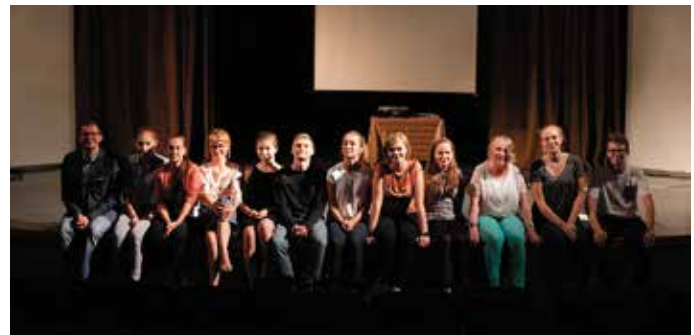
Trzy młodzieżowe inicjatywy powstały w trakcie warsztatów z trenerami