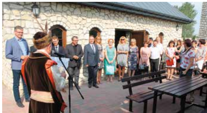
Przywitanie gości spotkania miało wyjątkowy charakter

niejących placówkach, a także rozwijanie wysokiej jakości oferty edukacyjnej przedszkoli. Dzieci, w tym szczególnie te ze specjalnymi potrzebami (np. z niepełnosprawnościami) oprócz codziennej opieki pedagogicznej mogą skorzystać z różnego rodzaju zajęć wspierających ich rozwój. Same przedszkola dzięki unijnym pieniądzą mają szansę, oprócz finansowania tworzenia nowych miejsc w placówkach, także na zakupienie nowoczesnego wyposażenia, np. zabawek edukacyjnych czy materiałów dydaktycznych.