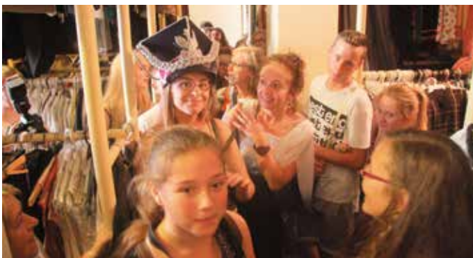
...jak i wewnątrz, przymierzając teatralne kostiumy