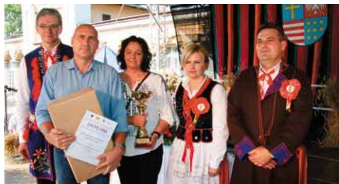
Marszałek oraz Starostowie Dożynek z laureatami konkursu na gospodarstwo ekologiczne