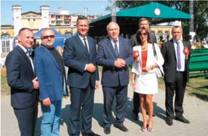
W Święcie Plonów uczestniczyli m.in. radni Sejmiku i parlamentarzyści