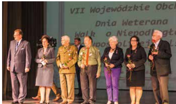
Osoby zasłużone uhonorowano medalami Pro Patria