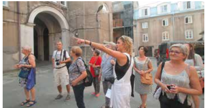
Budynek Teatru im. Stefana Żeromskiego w Kielcach można było zwiedzić zarówno z zewnątrz...

Bardzo bogaty program atrakcji przygotowała również Pedagogiczna Biblioteka Wojewódzka w Kielcach . Zorganizowała ona wydarzenie edukacyjne „Duchy, zjawy i upiory na