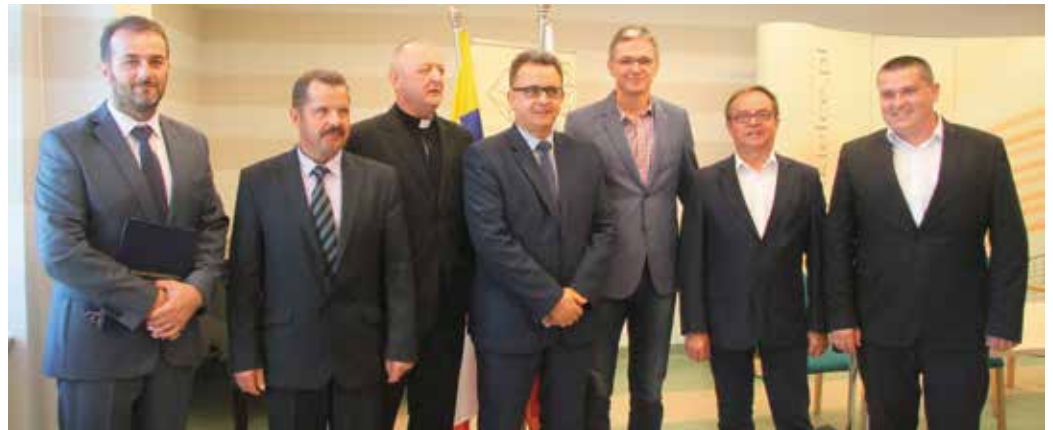
Uroczystość podpisania umów z Beneficjentami w ramach Działania 4.4 RPOWŚ

– Projekty, które otrzymały dofinansowanie, są bardzo ciekawe. Jeden z nich dotyczy Wojewódzkiej Biblioteki Publicznej, w której się w tej chwili znajdujemy. To wbrew ogólnym trendom bardzo często odwiedzane miejsce, biorąc pod uwagę, że u ubiegłym roku 60 procent Polaków nie przeczytało żadnej książki. Frekwencja pokazuje, że to miejsce bardzo potrzebne mieszkańcom regionu. Również Karczówka w ostatnich latach zmienia się i pięknieje za sprawą ojców pallotynów, a Zamek w Ujeździe to jedna z najbardziej znanych budowli architektury pałacowej i jedno z najczęściej od-