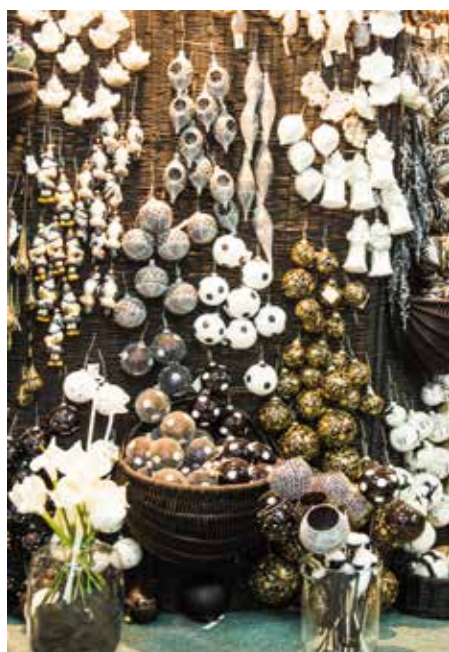
Bombki w kolorystyce bieli, srebra i złota

- Tak jak w architekturze, ubraniach, wnętrzach w bombkach w sezonie jest wiele modnych trendów. W tym sezonie mamy