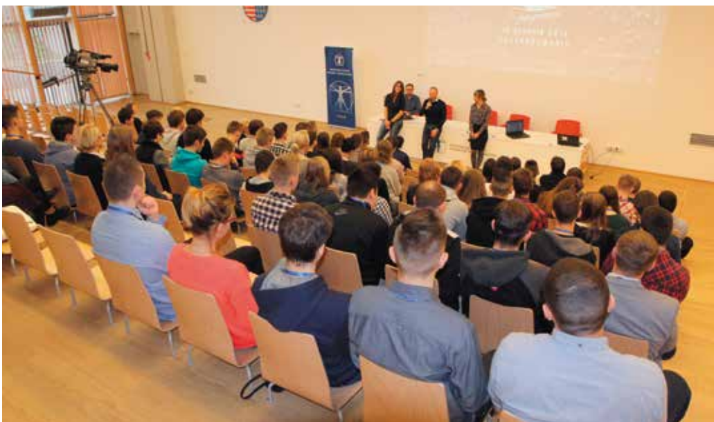
Pasjanci IT w Podzamczu