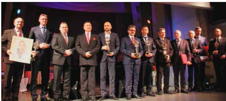
Laureaci Świętokrzyskiej Nagrody Jakości