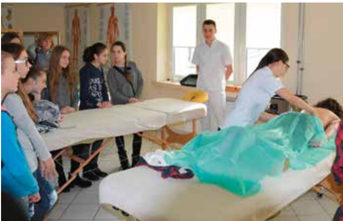
W centrum poznać można było m.in. techniki masażu