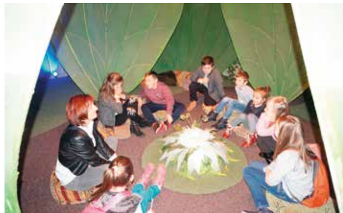
Dzieci zwiedzały wystawę Bajkowy Świat