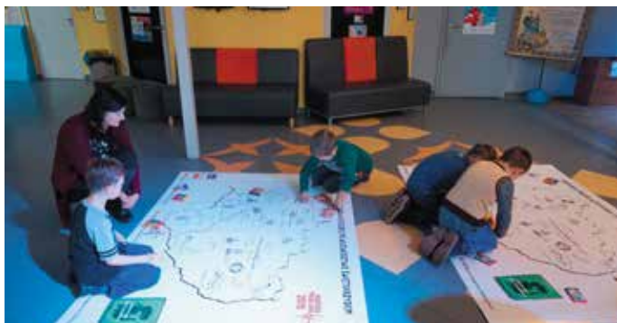
„Podróżownik” wybrał się z wizytą do Pacanowa

„Podróżowniki” to niezwykła seria książek dla dzieci, będących udanym połączeniem przewodnika i kreatywnego pamiętnika. Dzięki zamieszczeniu w nich zadań dzieci lepiej poznają odwiedzane miejsca, a także wiele nauczą się o otaczającym je świecie. Seria otrzymała prestiżową Nagrodę Magellana w kategorii Wydarzenie Roku 2015. Dotychczas ukazało się 10 tytułów „Podróżowników” - dedykowanych konkretnym krajom lub regionom Polski, m.in. Warmia i Mazury, Wybrzeże Polski, Turcja, Włochy, Egipt. Więcej o „Podróżowniku. Świętokrzyskie” i całej serii dowiecie się na: http://www.mac.pl/rodzic-i-dziecko/podrozowniki