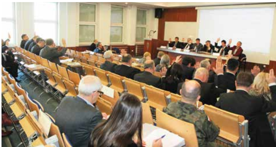
Podczas sesji zatwierdzony został m.in. Program Współpracy z Organizacjami Pozarządowymi w 2017 roku