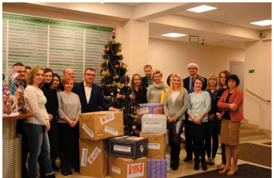
Urzędnicy ze „Szlachetną Paczką”