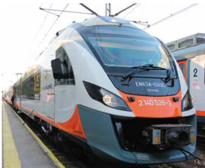
Od stycznia będzie więcej połączeń realizowanych przez Przewozy Regionalne do sąsiednich regionów oraz miejscowości rekreacyjnych

– Będziemy również kontynuować ofertę turystyczną do Sandomierza. Pierwszy pociąg wyjedzie już w weekend majowy. Chcielibyśmy, aby w naszym rozkładzie znalazł się cogodzinny kurs ze Skarżyska-Kamiennej do Kielc. Chcemy uniknąć sytuacji, w której pasażer szuka w rozkładzie dokładnej godziny odjazdu pociągu.