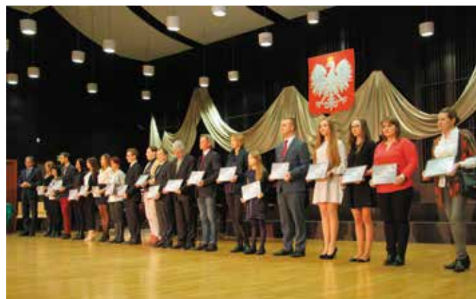
Nagrodzeni to laureaci konkursów przedmiotowych, przeglądów muzycznych, uzdolnieni studenci i uczniowie