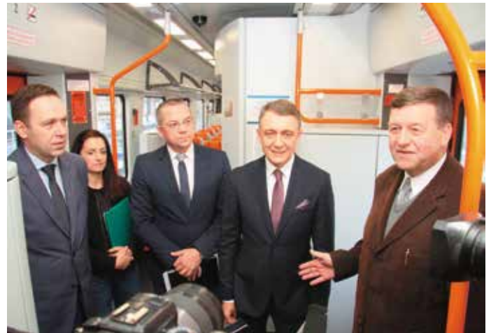
- Ustaliśmy, że podczas dzisiejszego kursu pan marszałek poprowadzi lokomotywę, a pan dyrektor będzie konduktorem.