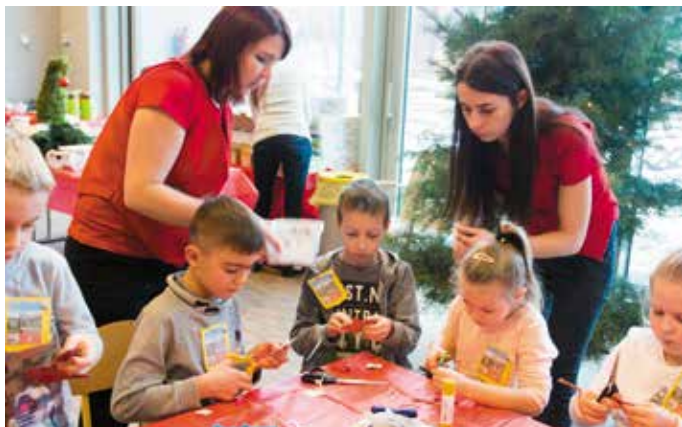
Warsztaty wykonywania świątecznych ozdób