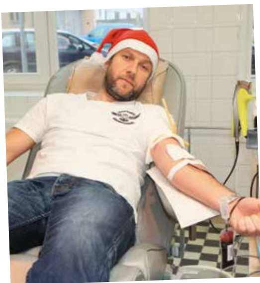
„Błękitna krew, szlachetny ród! Lordowska mość, bogactwa w bród!”