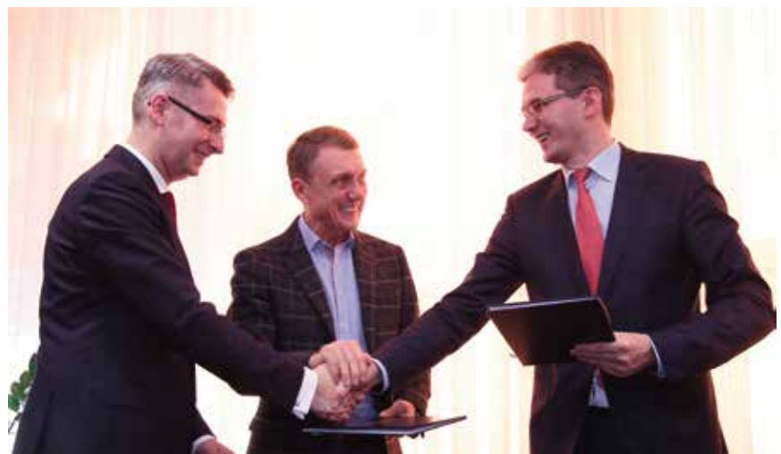
- Ja nie mam nic, ty nie masz nic, on nie ma nic... - To razem mamy w sam raz tyle, żeby wybudować wielką drogę!