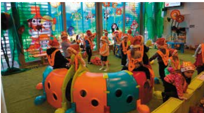
Wspólnym zabawom i wszelakim uciechom nie było końca