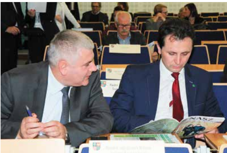
- Dali cię do „podpatrzone, podsłuchane”? - Na szczęście nie...