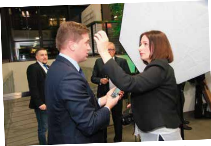
- A teraz proszę patrzeć mi głęboko w oczy. Adin, dwa, tri...