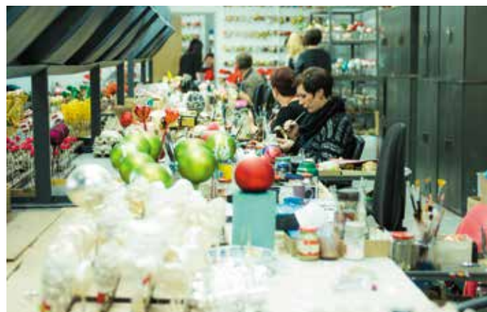
Pracownicy z cierpliwością nakładają zaprojektowane wzory na bombki