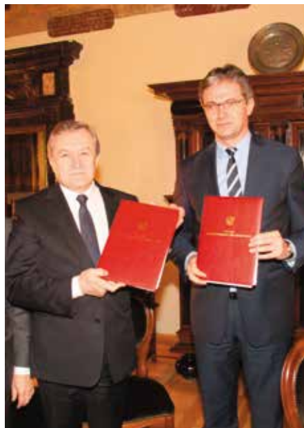
Minister Piotr Gliński i marszałek Adam Jarubas

Podczas spotkania przedstawiona została wstępna koncepcja prac, planowanych do wykonania w Wiślicy. Przedstawił je profesor Andrzej Kadłuczka z Politechniki Krakowskiej. Zaproponowana koncepcja zakłada budowę nowego, w dużej części przeszklonego budynku muzeum i przebudowę pawilonu (również przeszklonego) nad relikwiami kościoła św. Mikołaja – oba obiekty, a także podziemia kolegiaty mają być połączone podziemnym przejściem. O konieczności na te wszystkie prace fundu-