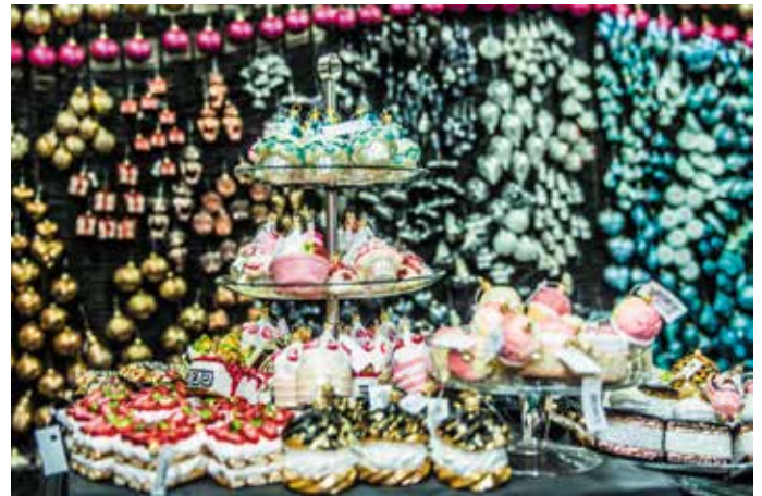
Takie apetyczne babeczki i mufiinki powstają w fabryce bombek w Staszowie