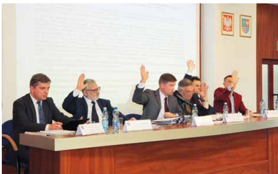
Prezydium XXVIII sesji Sejmiku podczas głosowania

O tym samym zagadnieniu mówiła informacja dotycząca stanu realizacji umowy ppp z Operatorem Infrastruktury – Glenbrook Investments sp. z o.o. dotyczącej projektu „Sieć Szerokopasmowa Polski Wschodniej – województwo świętokrzyskie”, która została przedstawiona na konnicie sesji. Radni Sejmiku przyjęli projekt oraz informację.