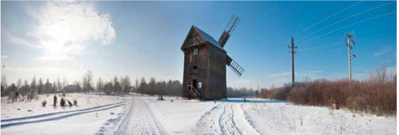
Skansen w Tokarni to jedna z najliczniej odwiedzanych atrakcji w regionie