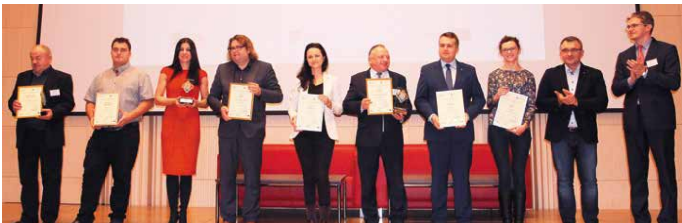
Laureaci konkursu „Lider Ekonomii Społecznej”

1 i 2 grudnia w murach Filharmonii Świętokrzyskiej im. Oskara Kolberga odbyły się Świętokrzyskie Targi Ekonomii Społecznej. Wydarzeniu towarzyszyła konferencja poświęcona wielosektorowej współpracy w tym obszarze, uhonorowano także liderów ekonomii społecznej promujących postawy prospołeczne oraz upowszechniających ekonomię społeczną w regionie.