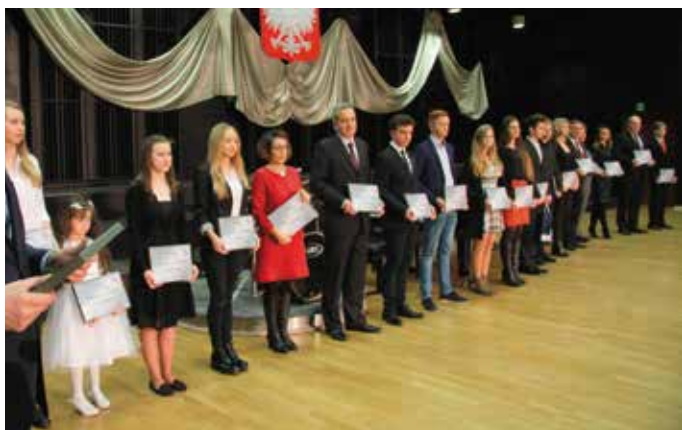
W ciągu 17 edycji, nagrodę Talent Świętokrzyski otrzymało już ponad 450 osób