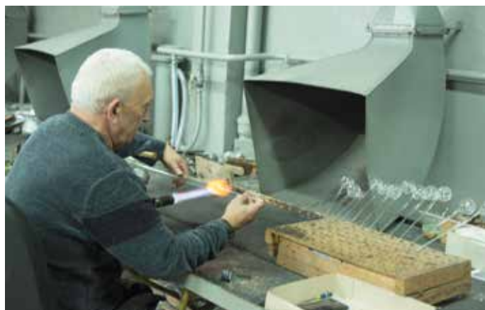
Proces produkcyjny zaczyna się od nadawania kształtu za pomocą ust, rąk i gorącego powietrza