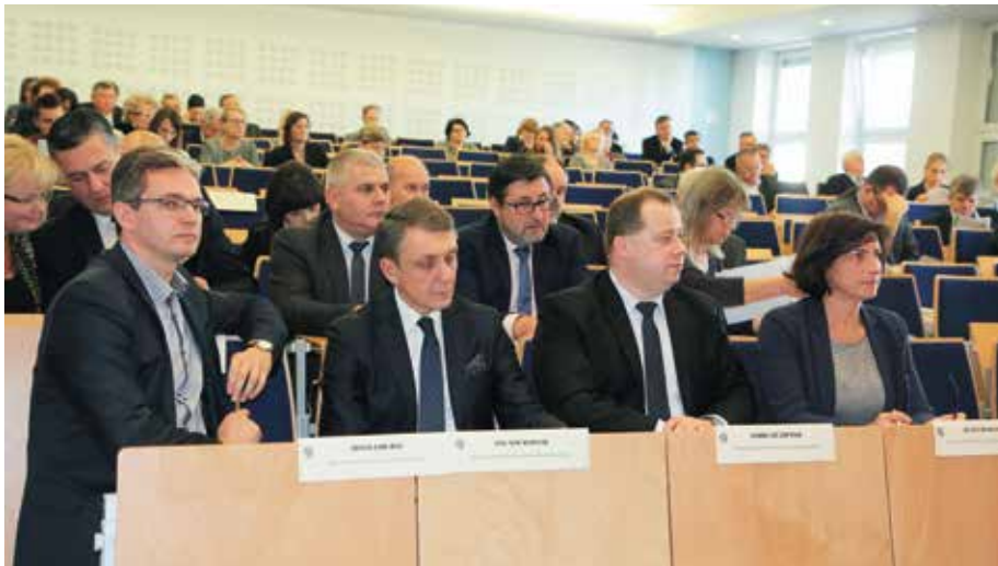
Zarząd Województwa w trakcie obrad Sejmiku