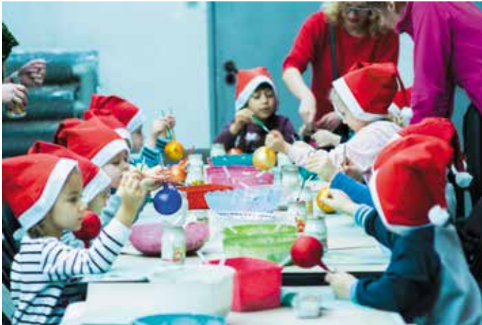
Warsztaty zdobienia bombek