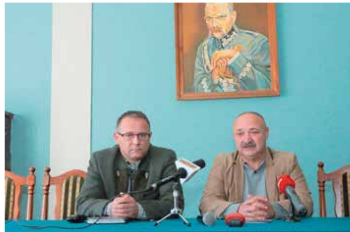
- Obrona Terytorialna...? Prawdopodobnie pani redaktor pomyliła konferencje prasowe... My z panem łowczym będziemy dziś mówili o Hubertusie Świętokrzyskim.