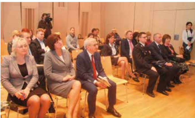
Samorządowcy cieszyli się z doposażenia OSP w swoich gminach