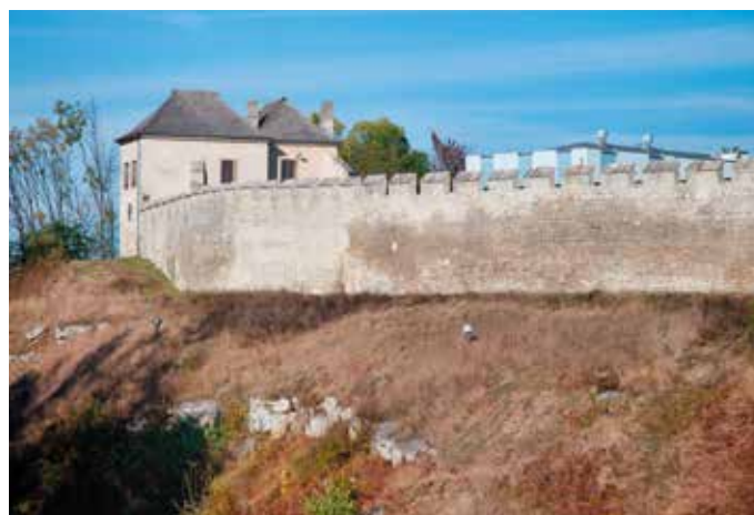
Prawie 8 milionów złotych trafi do gminy Szydłów na konserwację i remont zabytkowych obiektów

Jak podkreślają autorzy projektu budynek dawnej syna-