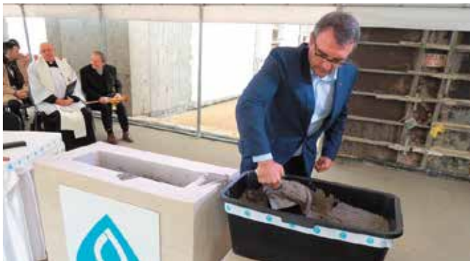
- Od piwnicy aż po dach niech radośnie rośnie gmach!