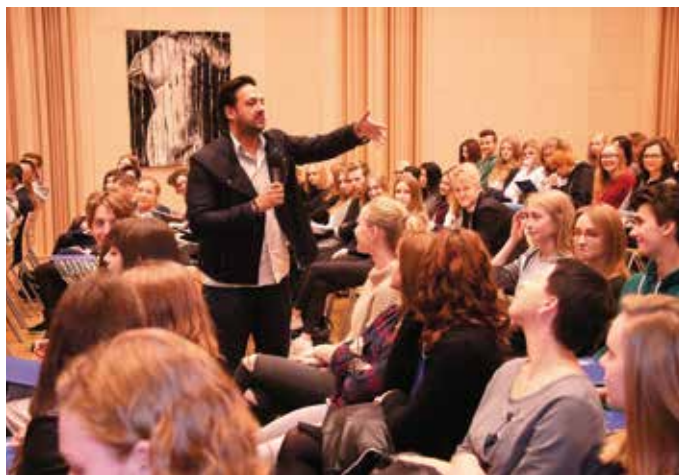
Młodzież w czasie ciekawych wykładów może poznać zalety dwujęzyczności

– Drodzy przyjaciele, spotykamy się ponownie na konferencji, która gromadzi niezwykłych prelegentów, pełnych pasji uczniów i wspaniałych nauczycieli z najlepszych szkół naszego regionu. Mimo że pomysł narodził się w Urzędzie Marszałkowskim, to tak naprawdę wy, uczniowie i nauczyciele, wcielacie tę ideę w rzeczywistość z niewielką grupą pasjonatów z Polski i z zagranicy, którzy chętnie dzielą się swoimi