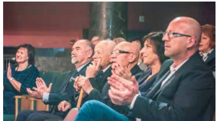
Widzowie byli zachwyceni aktywnością świętokrzyskich seniorów