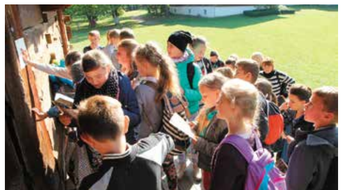
Questing, czyli nietypowe zwiedzanie skansenu z zagadkami w tle