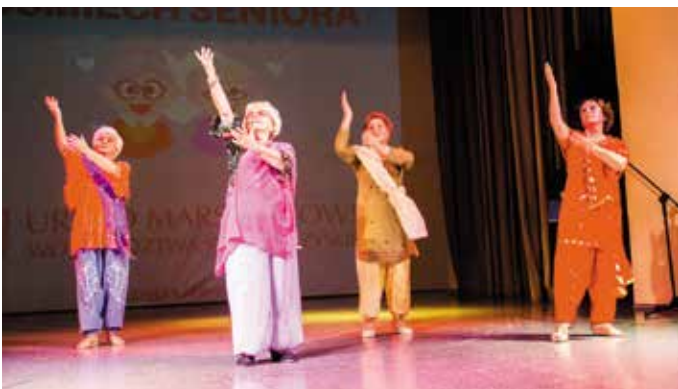
Indyjskie tańce „Pasjonaty”