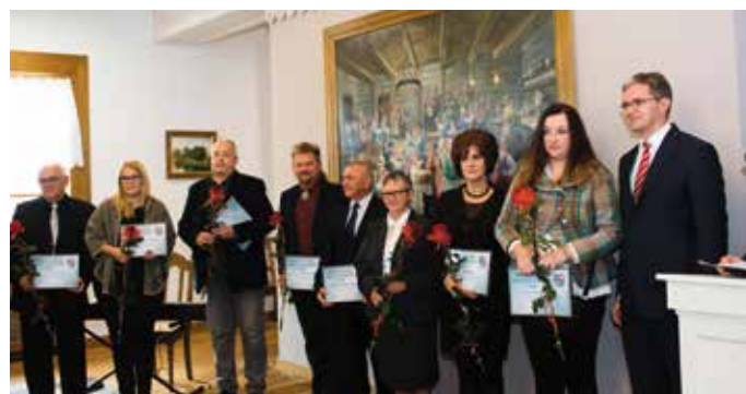
Laureaci nagrody II stopnia