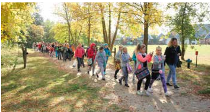
150 uczniów ze szkół podstawowych z regionu uczestniczyło w tegorocznym spotkaniu