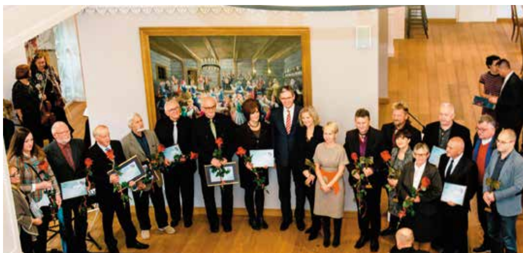
Laureaci Świętokrzyskiej Nagrody Kultury 2016