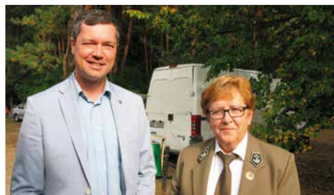
- Co u ciebie, absolwencie? - Niestety, nauka nie poszła w las, pani profesor...