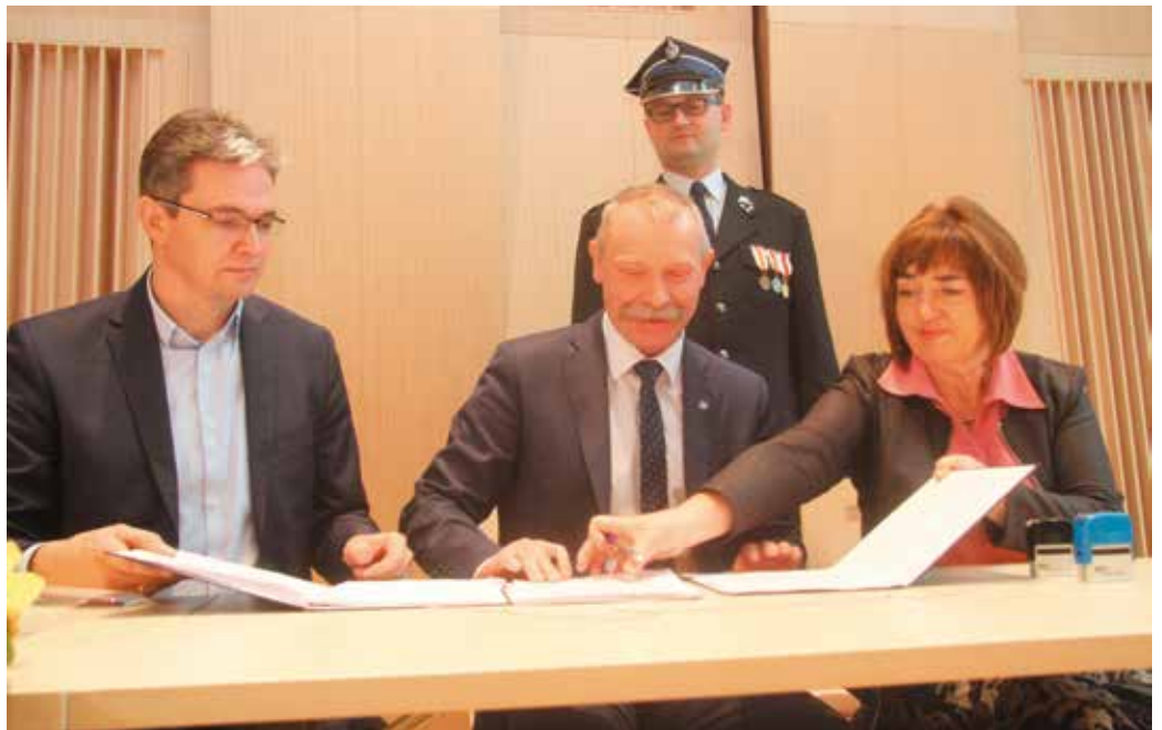
W podpisaniu umów uczestniczyli również strażacy

- Jest to moment, na który państwo i my długo czekaliśmy.