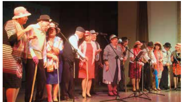
„Perty z lamusa” ze Skarżyska-Kamiennej porwały publiczność