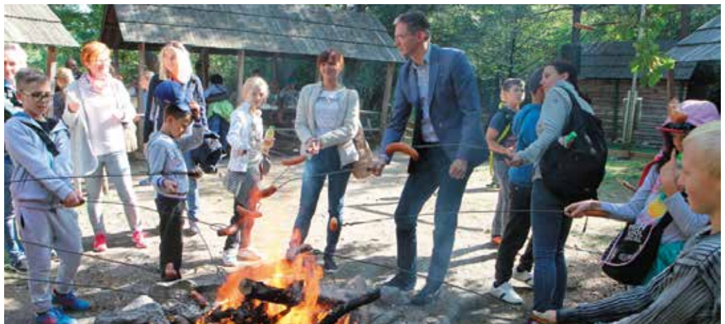
Rozmowy z marszałkiem przy ognisku