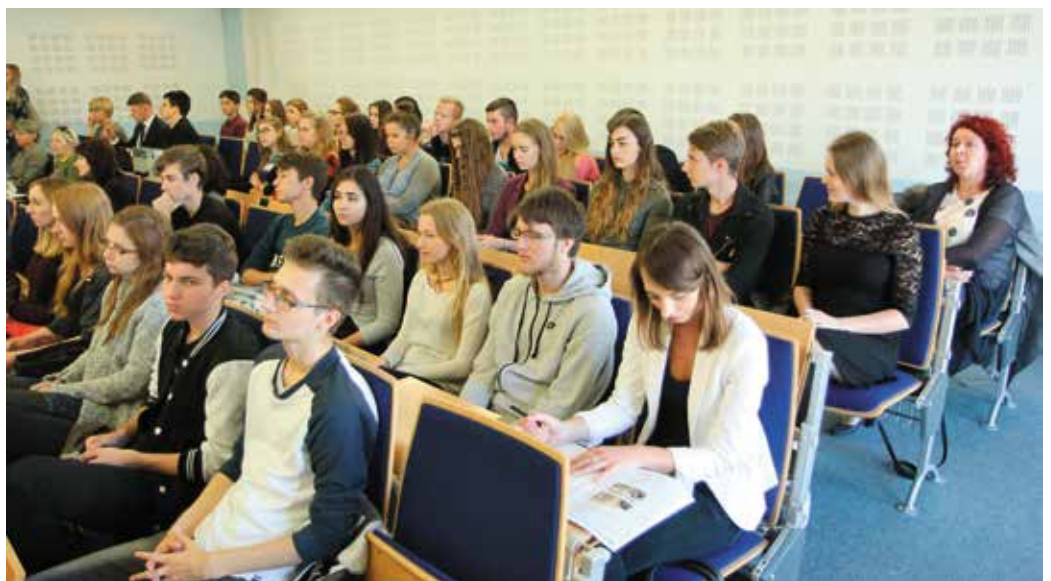
Obecna na Sesji młodzież mogła przekonać się, jak wygląda samorządność w praktyce