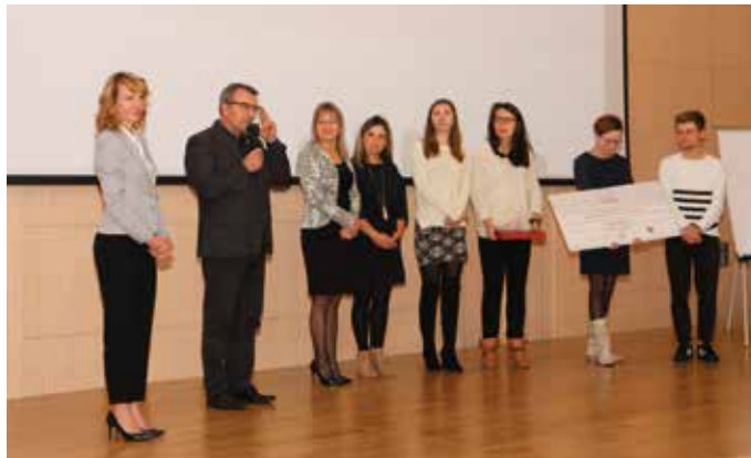
Zwycięzcy konkursu Nowa Przestrzeń

- Rada została powołana w 2010 roku i skupia grono ekspertów i doradców znających przepisy dotyczące organizacji pożytku publicznego. W tym gremium wymieniamy się doświadczeniami, których w trzeciej kadencji funkcjonowania mamy już dużo. Rada wypracowuje własne stanowiska, a także inicjuje działania czy