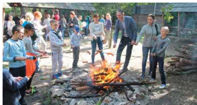
- ...drużyny jest wśród nas!