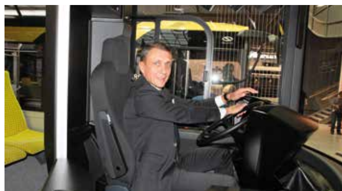
- A ja biorę gaz pod but, raz na objazd, raz na skrót, byle dalej, byle w przód, absolutnie! Fa fa fa fa fa fa fa fa fa ra fa fa...