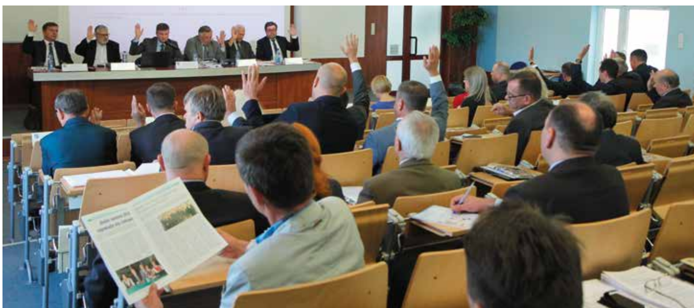
Radni jednogłośnie przyjęli stanowisko Sejmiku w sprawie sytuacji na rynkach rolnych w województwie świętokrzyskim