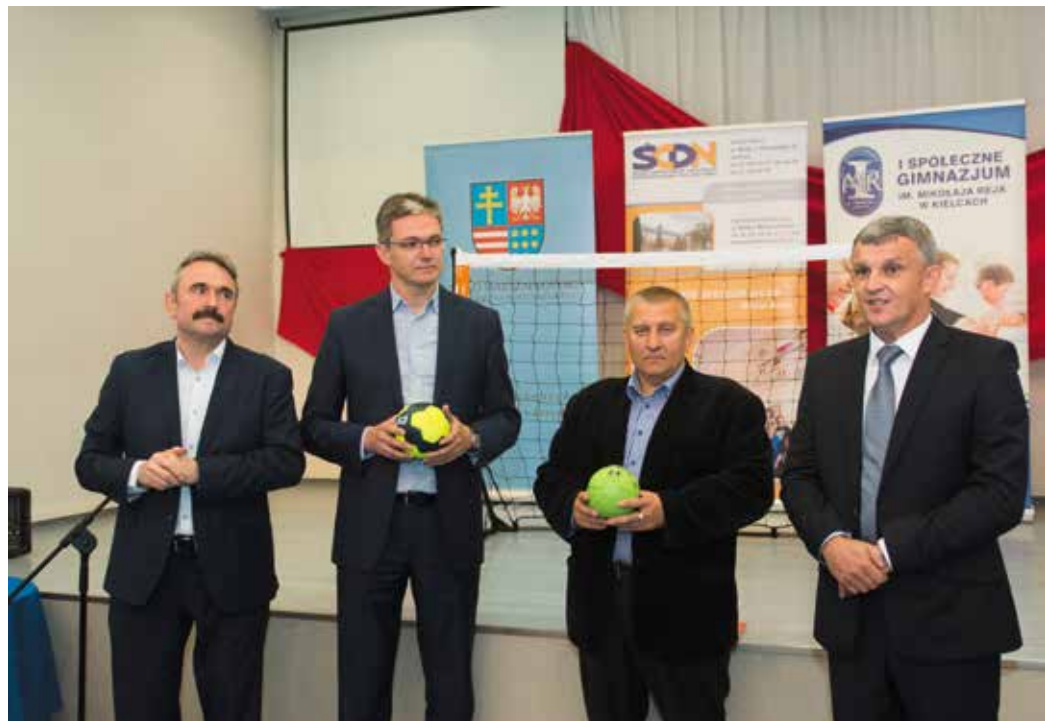
Program ma być promocją nie tylko piłki ręcznej, ale całej aktywności fizycznej najmłodszych

Każda z gmin województwa świętokrzyskiego wybierze jedną ze szkół ze swojego terenu, do której przekazane zostaną zestawy do tzw. street handballu. Jest to odmiana piłki ręcznej, w którą gra się do jednej bramki, a do rywalizowania w niej nie jest potrzebne duże boisko - wystarczy rozłożyć składaną bramkę oraz mieć specjalną piłkę. Szkoły dostaną zestawy składające się dodatkowo z plastronów, pucharów i wysepek treningowych.