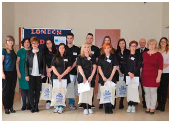
W praktykach uczestniczyło 16 uczniów kierunków technik masażysta oraz technik usług kosmetycznych.

Partnerem projektu był ADC College w Londynie, który odpowiadał za dobór właściwych placówek, organizację zakwaterowania i wyżywienia oraz program kulturalny.