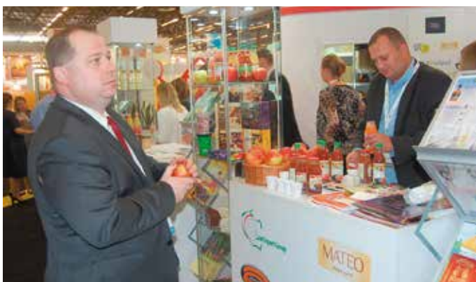
Ludzie dobrze sobie żyli póki jabłka nie zwędzili Adam z Ewą gryza dali - za to z rajy ich wygnali...