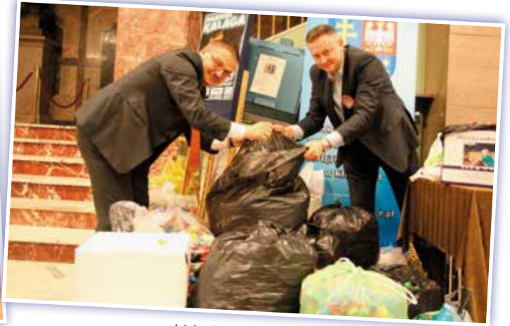
Idzie Grześ przez wieś, Worek piasku niesie, A przez dziurkę piasek ciurkiem Sypie się za Grzesiem...