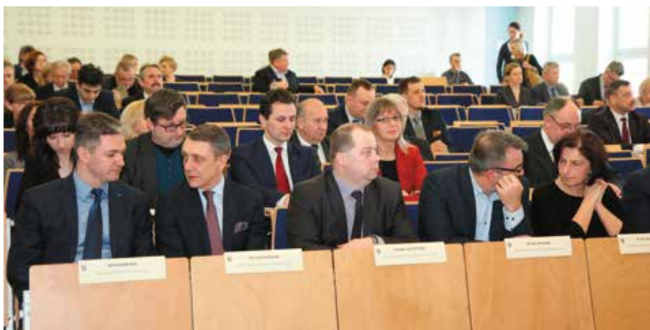
Zarząd Województwa Świętokrzyskiego

- Istnieje bardzo duże zagrożenie, że Specjalistyczny Szpital Ortopedyczno - Rehabilitacyjny „Górka” im. dr Sz. Starkiewicza w Busku - Zdroju nie znajdzie się w sieci szpitali, a przez to jego zasoby mogą nie być wykorzystywane i nie będzie możliwe przeprowadzanie tam zabiegów. To stano-