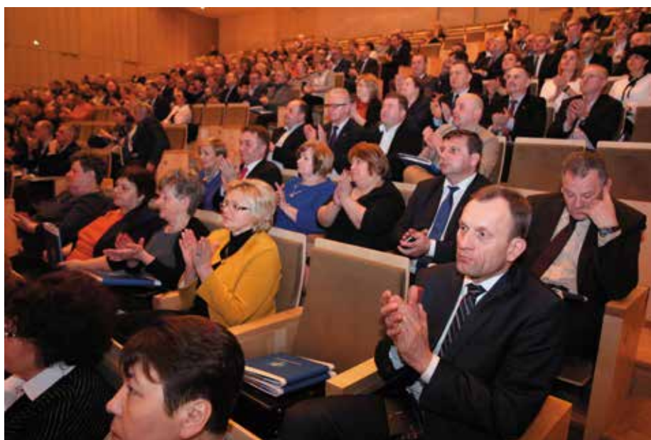
Sala koncertowa Filharmonii Świętokrzyskiej gościła samorządowców z całego regionu

O samorządności w aspekcie powrotu do Polski resortowej mówił prof. Jerzy Stępień, były prezes Trybunału Konstytucyjnego, rektor uczelni Łazarskiego w Warszawie, kierujący Fundacją Rozwoju Demokracji Lokalnej. - Rozpoczynaliśmy od istoty państwa scentralizowanego, jawiącego się jako aparat władzy i przymusu. Dzięki dwóm reformom udało się przywrócić Polsce samorząd, ale od czasu ich przeprowadzenia decentralizacja zatrzymała się.