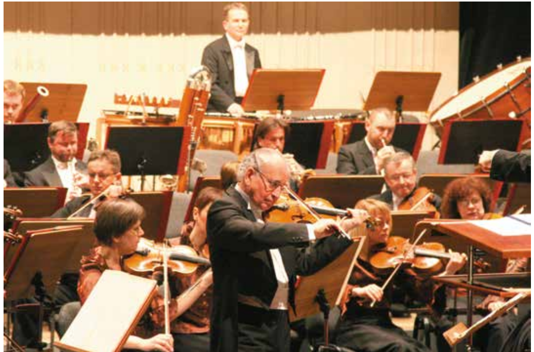
Ciekawy repertuar i znani soliści przyciągają melomanów na koncerty Filharmonii Świętokrzyskiej

Przekazywane przez samorząd dotacje instytucje kultury przeznaczają na pokrycie bieżących wydatków oraz organizację statych przedsięwzięć, wydarzeń, koncertów, wystaw, czy – jak w przypadku Teatru S. Żeromskiego - udział w festiwalach i przeglądach teatralnych