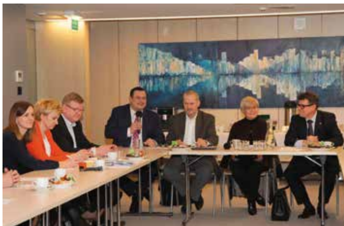
Podczas posiedzenia plenarnego powołany został Zespół problemowy ds. szkolnictwa