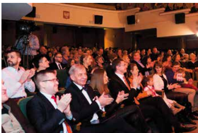
Publiczność dopingowała kolegów na scenie