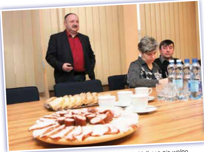
- Drodzy państwo, przepisu na tę wspaniałą kielbasę nie wolno nikomu zdradzić! Biuro Spraw Obronnych, Bezpieczeństwa i Ochrony Informacji zamknie go w sejfie.