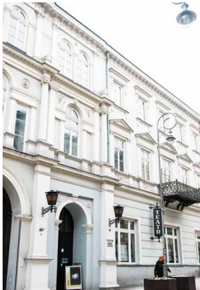
Nieuregulowane sprawy właścicielskie przez prawie 20 lat blokowały wyczekiwane inwestycje w kieleckim Teatrze

Rozpoczęcie prac wstępnie planowane jest w połowie 2018 roku. Wszystko zależy od tego, kiedy uda się pozyskać środki. Koszt remontu jest szacowany na około 55 mln zł. Pomysłów na źródła finansowania tej inwestycji jest