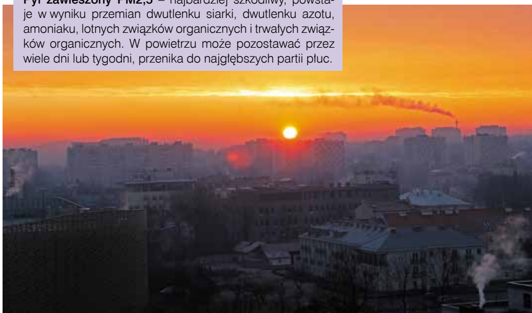
Smog nad Kielcami

Pył zawieszony PM2,5 – najbardziej szkodliwy, powstaje w wyniku przemian dwutlenku siarki, dwutlenku azotu, amoniaku, lotnych związków organicznych i trwałych związków organicznych. W powietrzu może pozostawać przez wiele dni lub tygodni, przenika do najgłębszych partii płuc.