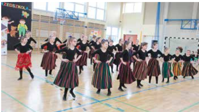
Uroczystość podpisania umów umiliły prezentacje artystyczne w wykonaniu przedszkolaków oraz uczniów szkół podstawowych z gminy Mniów