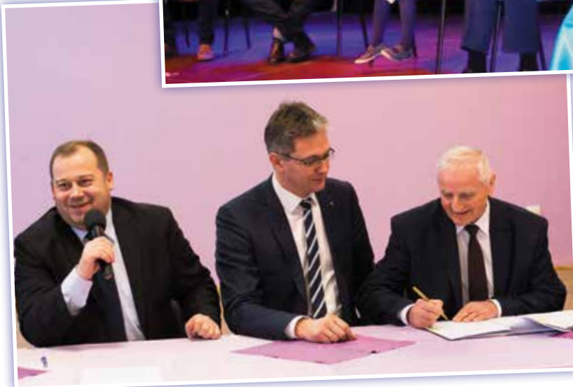
- Panowie sobie trochę porysują, a ja w tym czasie opowiem państwu dowcip...