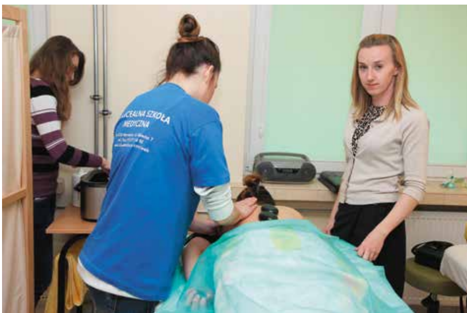
Zajęcia w pracowni masażu w CKZiU w Morawicy

Projekt jest realizowany przy wsparciu finansowym Komisji Europejskiej. Publikacja odzwierciedla jedynie stanowisko jej autora i Komisja Europejska nie ponosi odpowiedzialności za umieszczoną w niej zawartość merytoryczną.