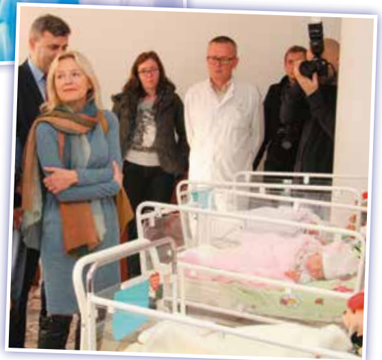
- Kiedyś też byłam taka maleńka. Serio!