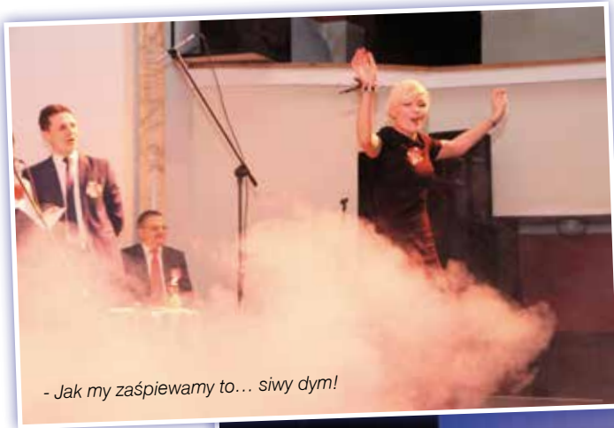
- Jak my zaśpiewamy to... sivy dym!