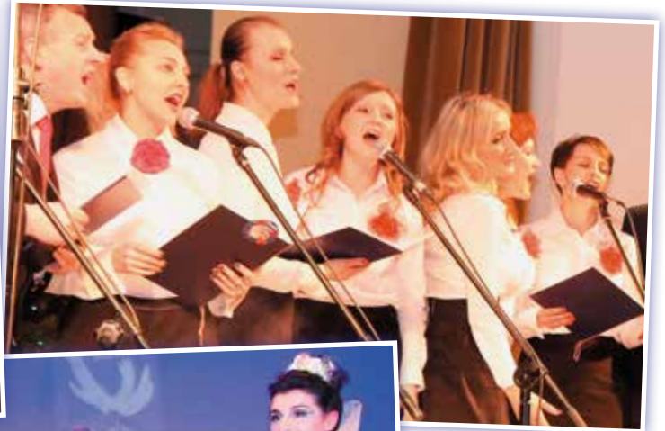
DPR – Departament Polityki Rozśpiewanej.