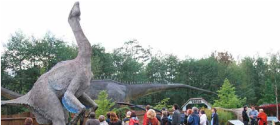
Baltów znów był jednym z liderów świętokrzyskiej turystyki

Informowaliśmy już, że rok 2016 był znakomity jeżeli chodzi o sprzedaż miejsc noclegowych w województwie świętokrzyskim. Okazuje się, że rekordowa była również sprzedaż biletów do poszczególnych atrakcji turystycznych w naszym regionie i niemal wszystkie największe zanotowały znaczny wzrost liczby odwiedzających.