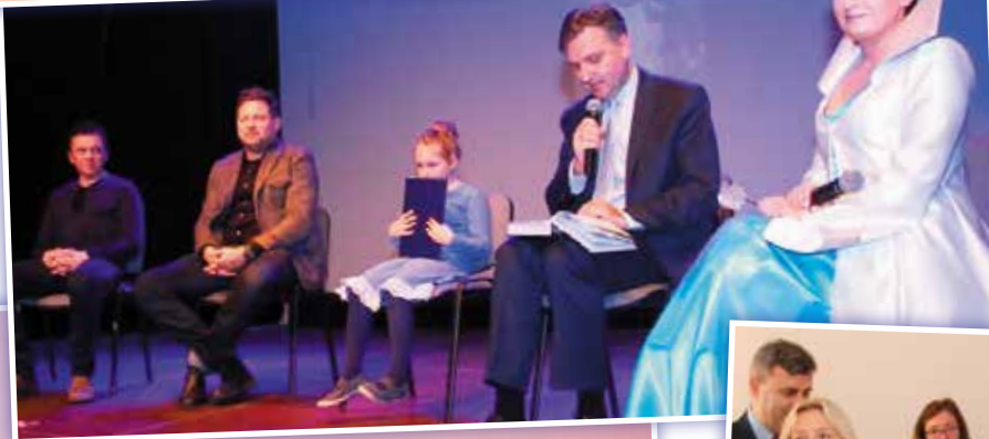
- Chcecie bajki? Oto bajka...