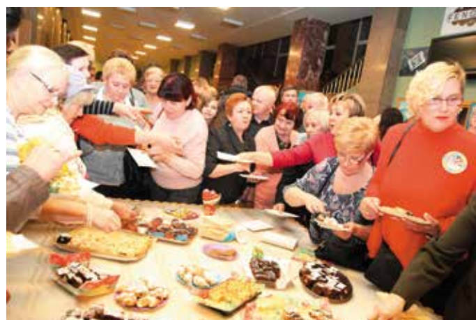
Po koncercie publiczność została zaproszona na słodki poczęstunek, który także przygotowali urzędnicy