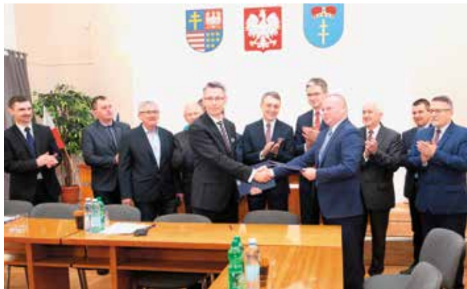
To bardzo ważny moment dla lokalnej społeczności

- Dziękuję władzom lokalnym za zaangażowanie w tej