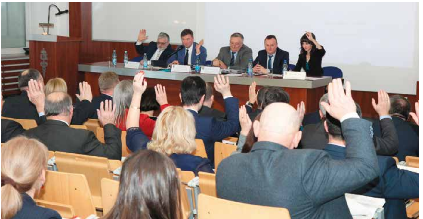
Stanowisko Sejmiku w sprawie Szpitala Górka zostało przyjęte jednogłośnie