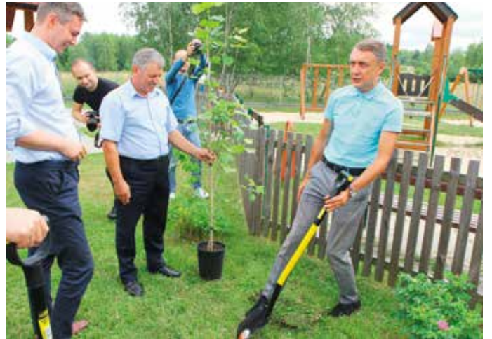
– Panowie, technika jest najważniejsza! Proszę pamiętać: lopatę zawsze wbijamy prawą nogą!