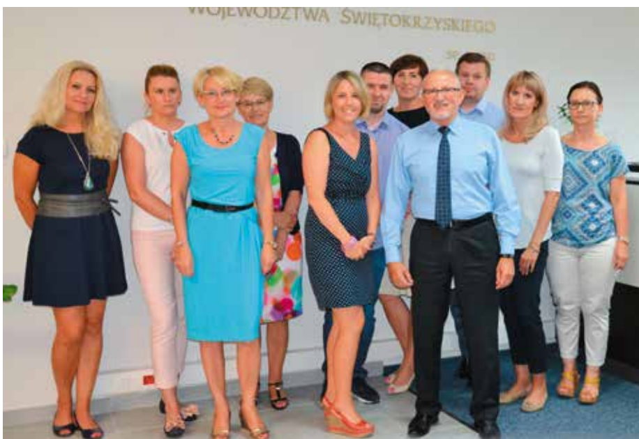
Pracownicy Funduszu Pożyczkowego Województwa Świętokrzyskiego

Mając na uwadze dalszy rozwój, Fundusz Pożyczkowy zmienił siedzibę, która stwarza większe możliwości dostępu i komfortu dla klientów oraz szersze możliwości rozwoju. Z usług Funduszu można korzystać odwiedzając nową siedzibę osobiście bądź umawiając się na spotkanie z doradcą - telefonicznie lub e-mailowo. W ten sposób będzie można uzyskać informację na temat możliwości finansowania.