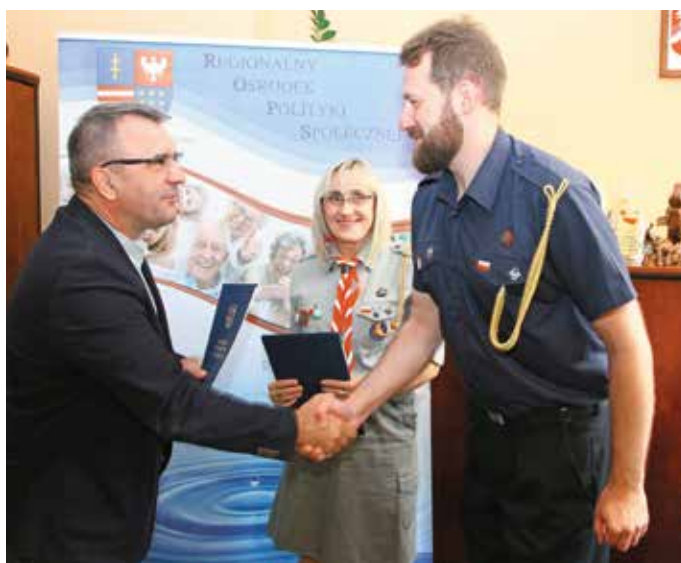
Umowę na wsparcie projektu ze środków PFRON podpisała Chorągiew Kielecka Związku Harcerstwa Polskiego