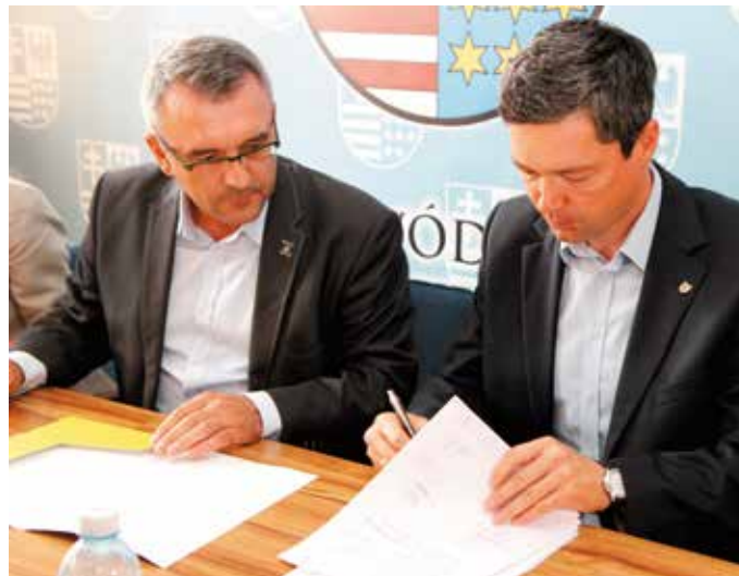
Jednym z szesnastu projektów, które otrzymały dofinansowanie jest projekt gminy Sitkówka-Nowiny