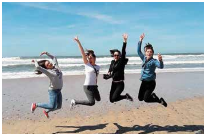
Wyjazd na praktyki był też okazją do wypoczynku i rekreacji

Wyjazd nie oznaczał bowiem jedynie pracy i szkoleń. Projekt obejmuje również zajęcia mające na celu poznawanie kultury portugalskiej. Uczniowie mieli więc okazję w wolnym czasie zwiedzić malownicze portugalskie miejscowości, poczynając od Apulii z piękną plażą i ścieżką spacerową nad Oceanem Atlantyckim, poprzez historyczne miasta Braga, Ponte de Lima i zapierający dech w piersiach widok ze wzgórza w Viana de Castelo.