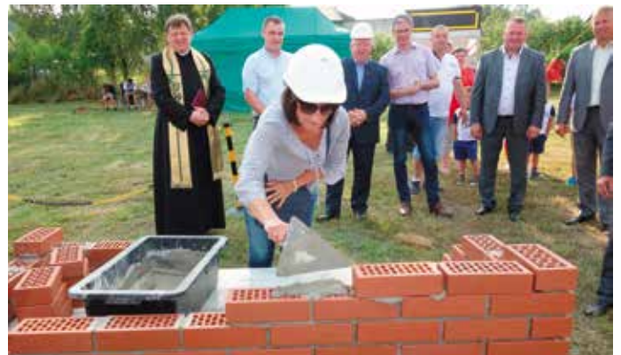
„Od piwnicy aż po dach niech radośnie rośnie gmach!”