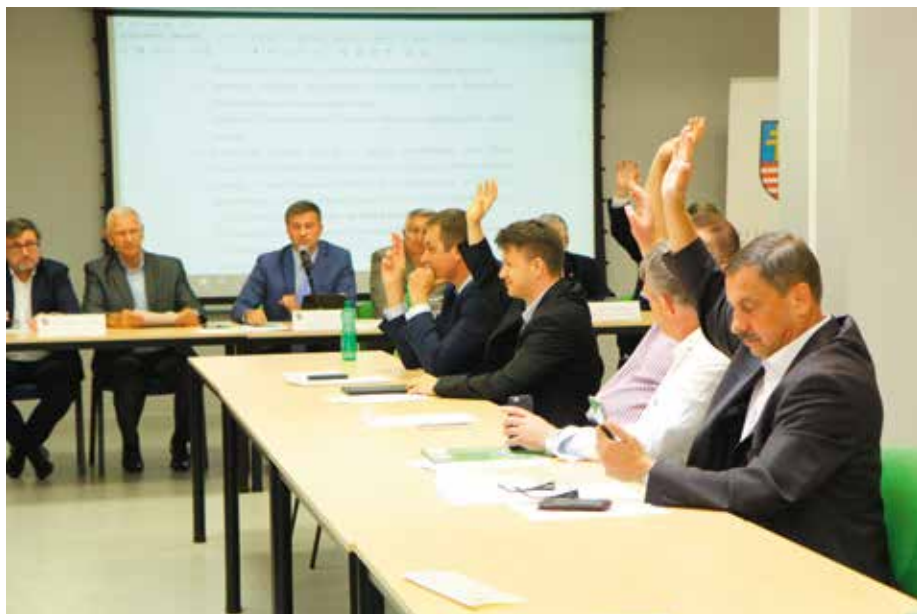
Sejmik przyznał gminom wsparcie, z którego skorzystają m. in. ochotnicze straże pożarne