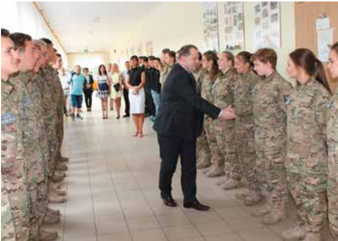
– Gratuluję awansu pani general!