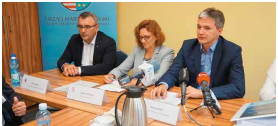
Podpisanie umów dotyczących realizacji Projektu ochrony przeciwpowodziowej w dorzeczu Odry i Wisły

– Te rozwiązania obejmują nie tylko zabezpieczenie wałów, ale też budowę infra-