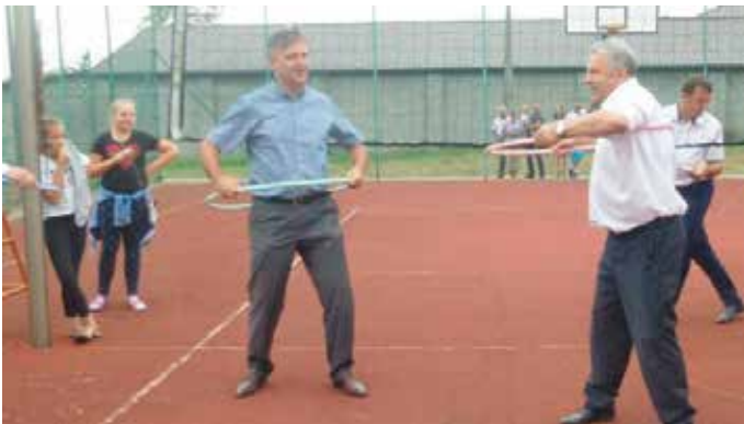
W zdrowym ciele zdrowy duch - to zapewni tylko ruch!