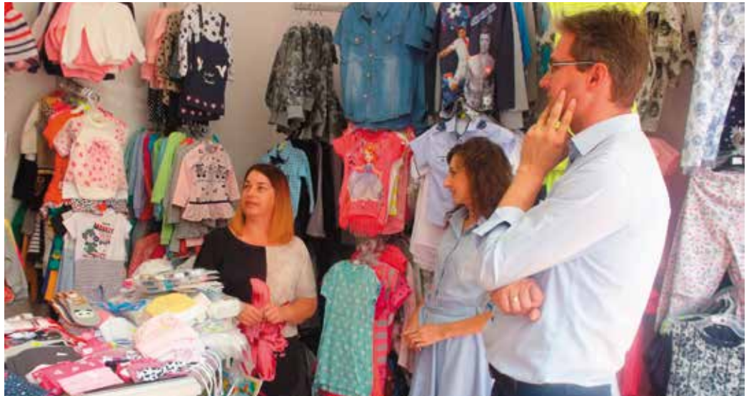
Działalność gospodarcza mogła zostać zainicjowana dzięki projektowi „Start do biznesu” współfinansowanemu ze środków Europejskiego Funduszu Społecznego