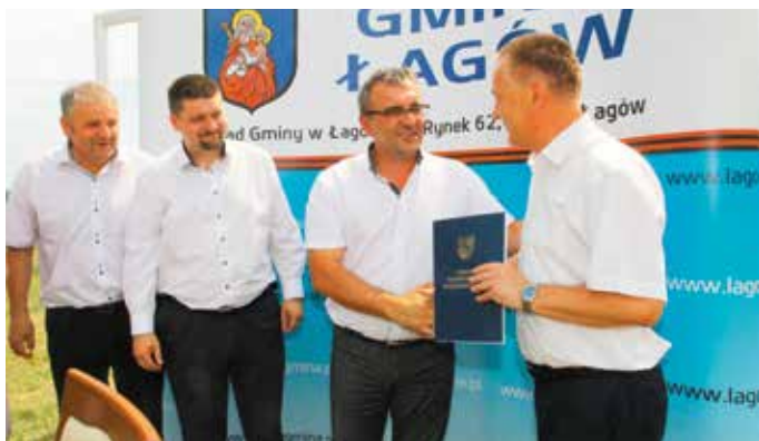
Dzięki tegorocznej edycji konkursu jednostka OSP w Sadkowie otrzyma dodatkowy sprzęt