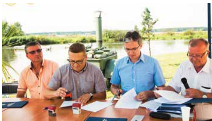
Dofinansowanie na realizację projektów otrzymała m.in. gmina Nowy Korczyn

W ramach konkursu „Odnowa Wsi Świętokrzyskiej 2017” wpłynęło w sumie 221 wniosków z 91 gmin. Zarezerwowany w budżecie województwa 1 mln złotych wystarczy na sfinansowanie 95 projektów inwestycyjnych (wszystkie złożone wnioski na projekty inwestycyjne otrzymały dofinansowanie) oraz 56 związanych z zakupem