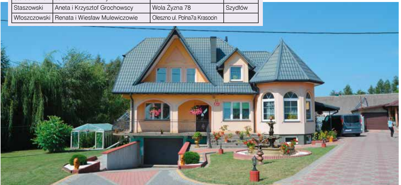
Jedno z gospodarstw nagrodzonych w konkursie