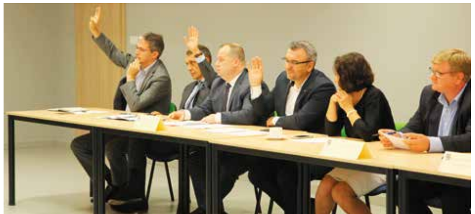
Radni zatwierdzili listy rankingowe projektów w ramach konkursu „Odnowa Wsi Świętokrzyskiej na 2017 rok” finansowanego ze środków samorządu województwa