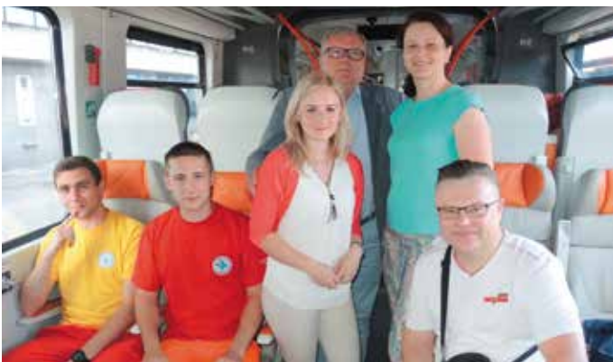
„Wsiąść do pociągu byle jakiego, nie dbać o bagaż, nie dbać o bilet...”