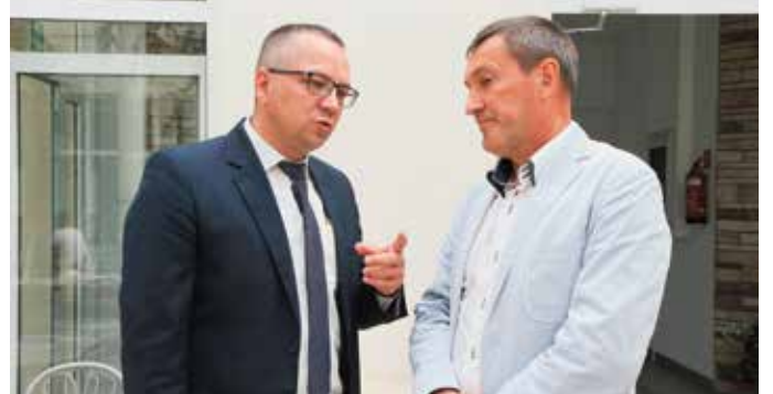
- Mleko, widzi pan, ma najszybszy transport. Inaczej się zsiada.