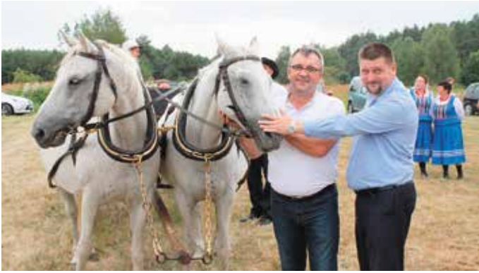
– Wiąta, wio, łatwo powiedzieć...