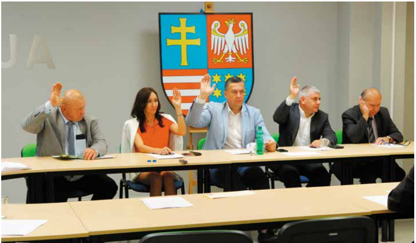
Podczas XXXV sesji Sejmiku Województwa Świętokrzyskiego