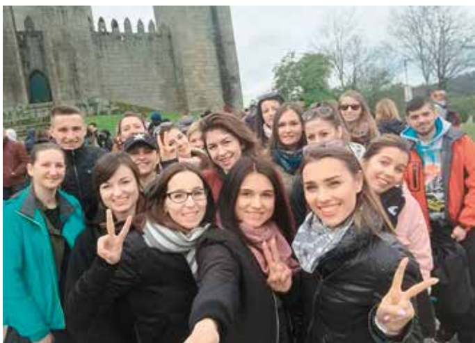
W czasie wolnym uczniowie poznawali urokliwe Portugalskie miasta

Koordynator zespołu projektowego Centrum Kształcenia Zawodowego i Ustawicznego w Morawicy