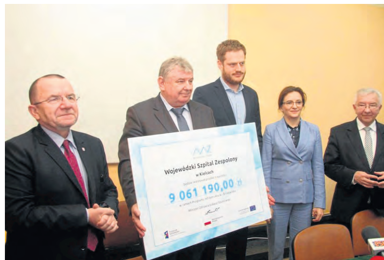
Łączny koszt utworzenia centrum to ponad 9 milionów zł, a dofinansowanie z Programu Operacyjnego Infrastruktura i Środowisko wyniesie ponad 7,5 mln zł.

- Oby jak najwięcej pieniędzy, które mamy na inwestycje było przekazywanych na kompleksowe projekty, takie,