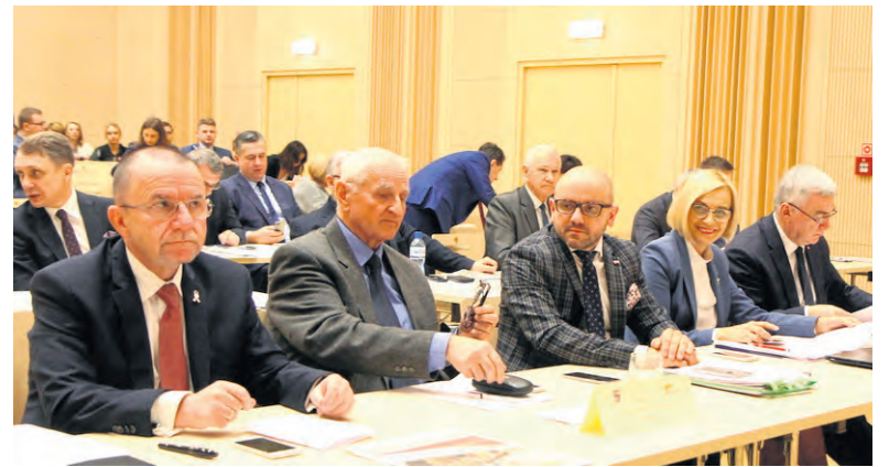
Zarząd Województwa podczas sesji Sejmiku