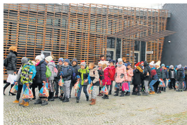
Na „Marszałkowe Mikołajki” do Pacanowa przyjechało 250 dzieci ze szkół podstawowych województwa świętokrzyskiego.