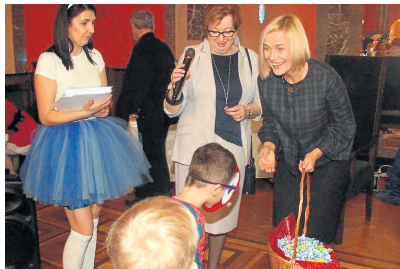
Wicemarszałek Renata Janik częstowała dzieci słodyczami, wręczyła im także dyplomy uczestnictwa w zabawie.

Świętokrzyski Ośrodek Adopcyjny działa w strukturze Urzędu Marszałkowskiego Województwa Świętokrzyskiego od 1 stycznia 2012 roku. Przeprowadza średnio około pięćdziesięciu adopcji rocznie. J.M.