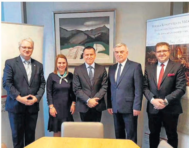
Omówione zostały m.in. nowe pomysły na współpracę z ambasadą w 2019 roku.