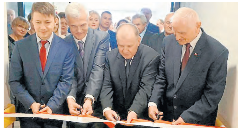
Goście symbolicznie przecięli wstęgę i zwiedzili pomieszczenia dwupiętrowego obiektu, w którym pokoje mieszkalne znajdują się na obu poziomach.

Dom pomieści 29 osób, w 14 pokojach 1-, 2- i 3-osobowych, mieszkańcami zajmie się 19 pracowników, zaczyna działalność od 1 stycznia. Inwestycja kosztowała około 5,3 mln zł, z czego 85 proc. wyniosło dofinansowanie z RPO WŚ.