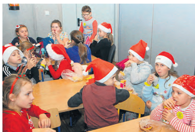
Po udanej zabawie radosne, ale i nieco zmęczone dzieci mogły odpocząć i posilić się.