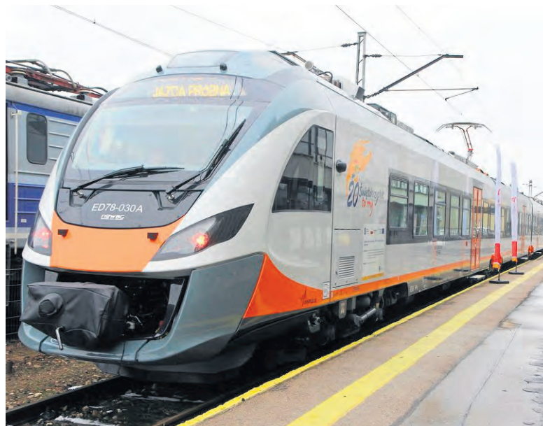
Supernowoczesny „Impuls” będzie mógł przewieźć około 400 osób.

7 marca 2018 roku firma „NEWAG” S.A. z Nowego Sącza podpisała umowę z Urzędem Marszałkowskim na dostawę dwóch fabrycznie nowych czte-