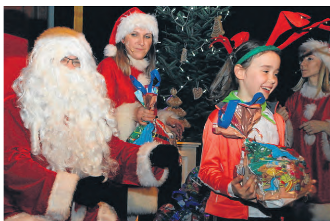
Do Europejskiego Centrum Bajki prosto z Laponii przyjechał Święty Mikołaj, który obdarował wszystkich prezentami.