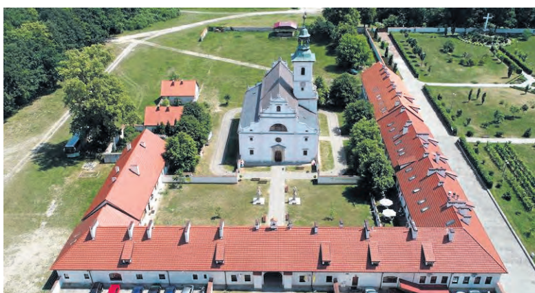
Do Pomników Historii w regionie świętokrzyskim dołączył zespół klasztorny Pustelnia Złotego Lasu w Rytwianach.

Celem programu „100 Pomników Historii na stulecie odzyskania Niepodległości” jest zwiększenie liczby szczególnie ważnych dla historii Pol-