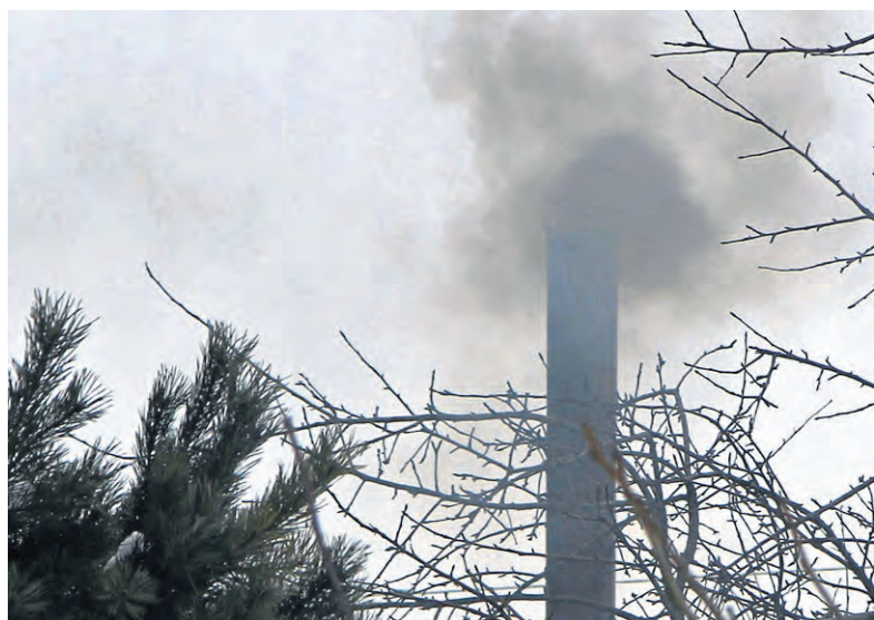
Projekty termoizolacyjne mają na celu poprawę jakości powietrza poprzez znaczną redukcję zanieczyszczeń.