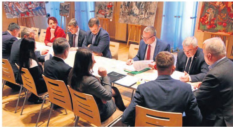
W przerwie obrad odbyły się posiedzenia komisji problemowych

do nawet 1 mln zł, przy tworzeniu wspólnej marki przez minimum trzy firmy. Również instytucje otoczenia biznesu działające w obszarze inteligentnych specjalizacji regionu będą mogły ubiegać się o vouchery o wartości 1 mln zł. na profesjonalizację swoich usług oraz rozwój przedsiębiorczości w kluczowych branżach regionu.