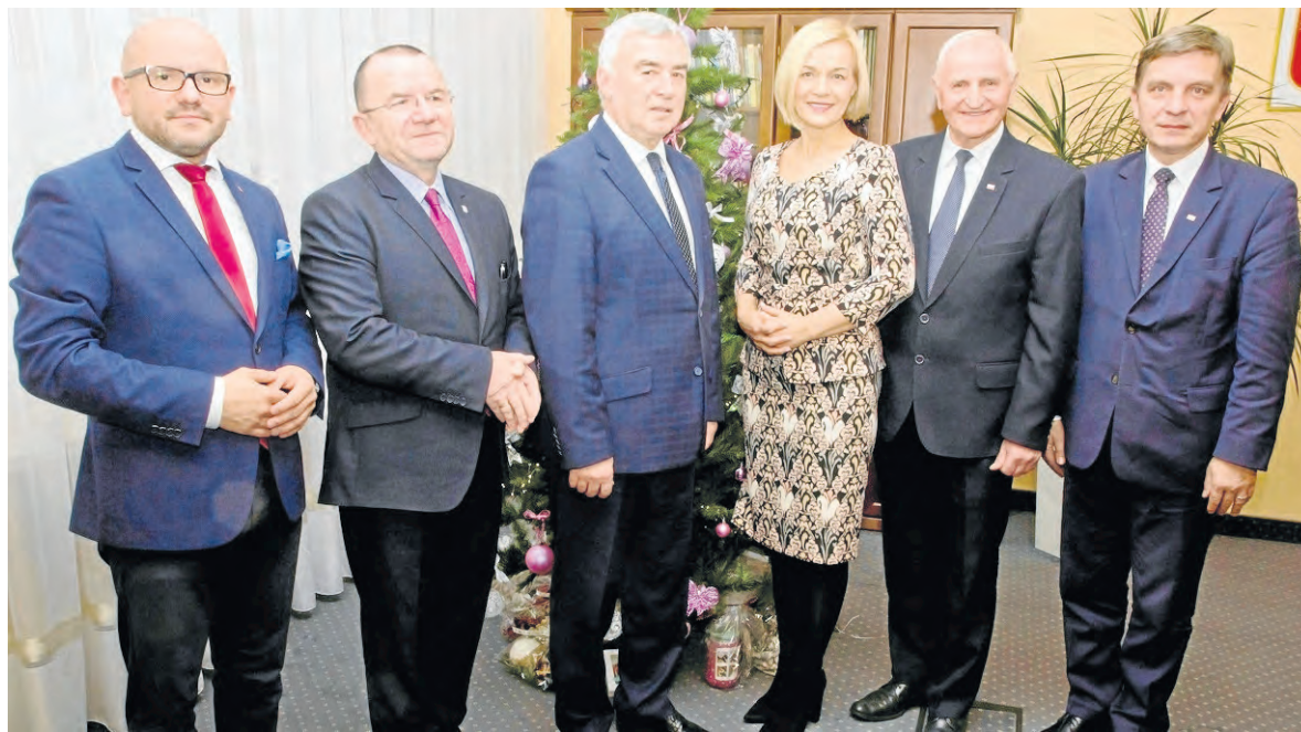
Dla świętokrzyskich samorządowców ważna jest tradycja. Święta Bożego Narodzenia spędzą z najbliższymi.

Pomimo dużych zmian zachodzących we współczesnym świecie, nadal pragniemy spędzać Święta tradycyjnie, ważny jest dla nas ich religijny wymiar. Zwracamy się ku narodzonemu Dzieciątku, cieszymy się z przyjścia Pana, sięgamy po to, co porusza duszę