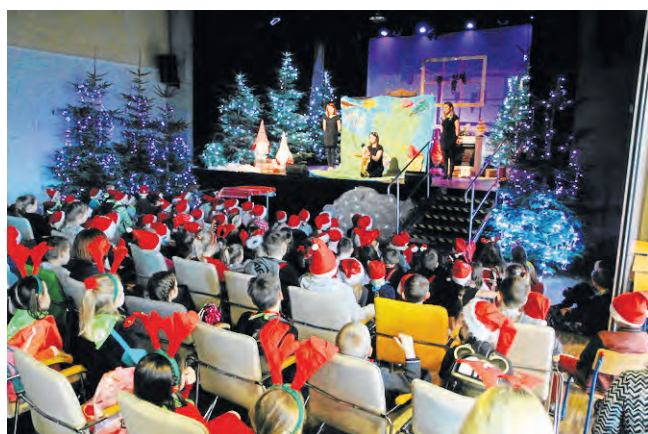
Mali goście między innymi obejrzeni przedstawienie „Krawiec Niteczka” i zwiedzili Krainę „Soria Moria”.