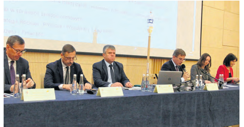
Prezydium Sejmiku podczas obrad Sejmiku

- Zawarte w programie priorytety i działania merytoryczne realizowane będą zgodnie z zasadami określonymi w ustawie. Projekt programu poddany został konsultacjom, zgodnie z ustawą o działalności pożytku publicznego i wolontariacie oraz pozytywnie zaopiniowany przez Świętokrzyską Radę Działalności Pożytku Publicznego. Środki finansowe na realizację Pro-