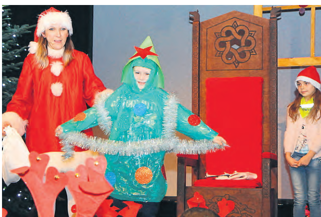
Atrakcji nie brakowało. Dzieci bawiły się między innymi przy bajkowych piosenkach i brały udział w konkursach.