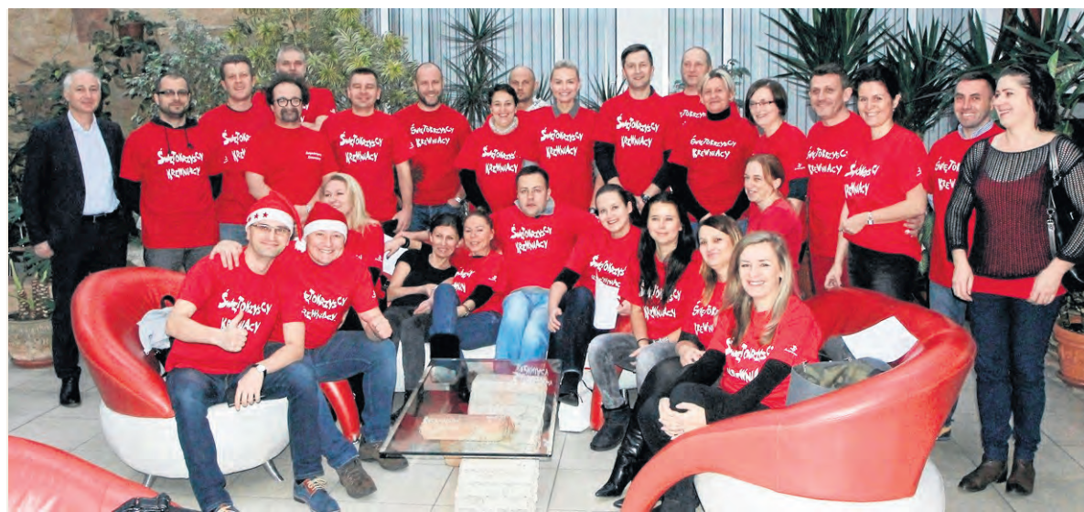
Akcje „Samorządowcy Dzieciom” i „Krewniacy Mikołaja” wpisały się w kalendarz wydarzeń Urzędu Marszałkowskiego.