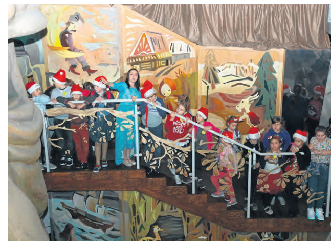
Uczestnicy „Marszałkowych Mikołajek” mieli możliwość zwiedzenia wystawy „Bajkowy świat”.