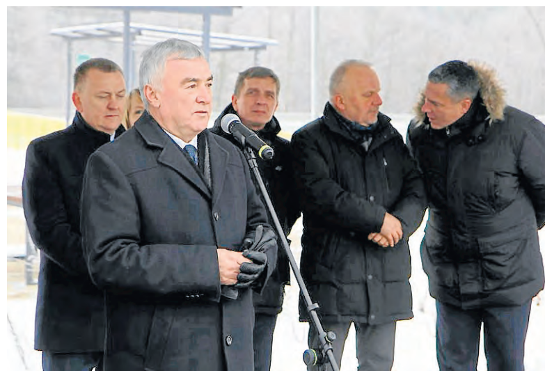
- Przebudowa znacząco poprawi bezpieczeństwo i połączenie z krajową oraz międzynarodową siecią - mówił marszałek Andrzej Bętkowski.

Wartość inwestycji to 69,5 mln zł, a dofinansowanie z Programu Operacyjnego Polski Wschodniej na lata 2014-2020 wyniosło 49,2 mln zł. M.N.