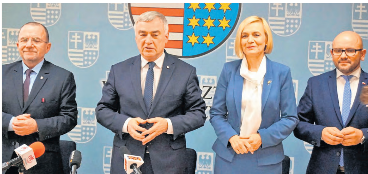
O dofinansowaniu projektów Zarząd Województwa Świętokrzyskiego poinformował podczas konferencji prasowej.

- Co istotne, Działanie 3.3 dedykowane przede wszystkim na poprawę efektywności energetycznej budynków użyteczności publicznej, jest ściśle komplementarne z rządowym programem „Czyste powietrze”, skierowanym do właścicieli i współwłaścicieli domów jednorodzinnych - mówił marszałek Andrzej Bętkowski , podkreślając, że synergia działań podejmowanych przez samorząd województwa z działaniami podejmowanymi na szczeblu rządowym pozwoli na osiągnięcie istotnej poprawy jakości powietrza w naszym regionie poprzez znaczną redukcję zanieczyszczeń, co stanowić będzie skuteczne narzędzie walki z dotkliwym problemem smogu. Ponieważ zjawisko smogu w dużym stopniu dotyczy obszarów miejskich, Zarząd Województwa z dostępnej puli środków zdecydował się wydzielić kwotę ponad 35 milionów złotych i skierować ją na wsparcie projektów przewidzianych do realizacji w ramach obszaru funkcjonalnego miast tracących funkcje społeczno-gospodarcze (Skarżysko-Kamienna, Starachowice, Ostrowiec Świętokrzyski). Dzięki temu