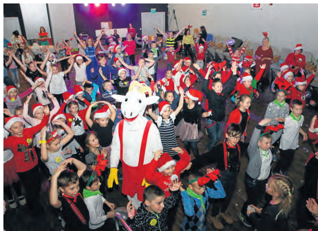
W bajkowej krainie nie brakowało atrakcji, o które zadbał sam Koziołek Matołek.