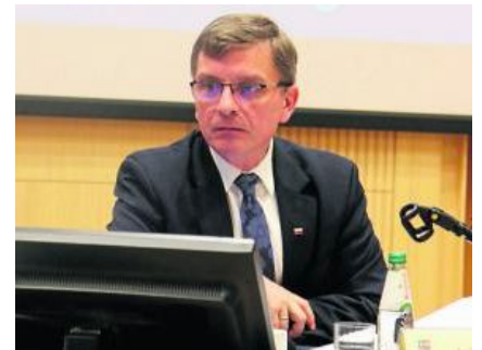
Obradami VIII sesji kierował Andrzej Prus , przewodniczący Sejmiku Województwa.