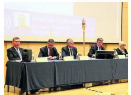
Tematami obrad były m.in. podwyżki wynagrodzeń w jednostkach kultury podległych Marszałkowi.