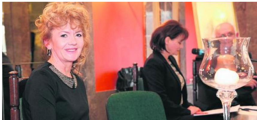
Poetka wydała już cztery tomiki poetyckie, w sumie opublikowała ponad dwieście wierszy.

Mimo, że w świat poezji weszła już jako nastolatka, życiowe doświadczenia sprawiły, że na wiele lat porzuciła swoją pasję. - Pisanie wróciło dopiero po wielu latach służby w policji. Poczułam silną potrzebę