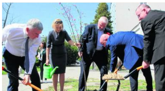
Migdałowce różowe posadzone przez Zarząd Województwa nie tylko pięknie wyglądają, ale i przyczyniają się do poprawy jakości powietrza.