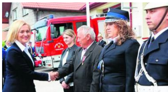
Gratulacje dla druhow z Obic z okazji strażackiego święta.

montowanej strażnicy komendy powiatowej, sprzętu ratowniczego i pojazdów, które wzmocniły ich zaplecze techniczne - mówił marszałek Andrzej Bętkowski . - Gratuluję strażakom z terenu powiatu otrzymania awansu na wyższy stopień służbowy jak i tym, którzy otrzymali odznaczenia państwowe - dodał.