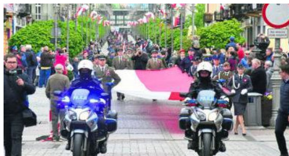
Defilada wojskowa na ulicy Sienkiewicza w Kielcach.