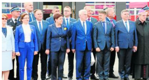
Gościem strażackiego święta w Sandomierzu była wicepremier Beata Szydło .

- Cieszymy się, że możemy wspólnie ze strażakami dzielić radość z wyre-