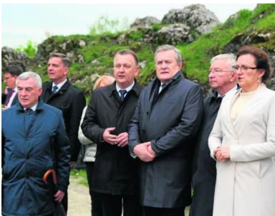
Wicepremier Piotr Gliński podczas wizyty na Zamku w Chęcinach.

- Odpowiadamy na apel pana premiera, aby przedstawiciele biznesu włączyli się w ochronę dziedzictwa narodowego.