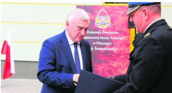
Powiatowe obchody strażackiego święta w Pińczowie.

12 maja, w Bukowie, gmina Osiek, odbyły się obchody Dnia św. Floriana. Podczas uroczystości w miejscowej jednostce, która obchodziła jubileusz 90-lecia, przekazano do użytkownika lekki samochód strażacki, którego zakup dofinansował Urząd Marszałkowski.