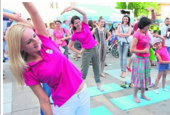
Podczas pikniku będzie można skorzystać z bezpłatnych badań i porad zdrowotnych, zabiegów kosmetycznych, a także z ćwiczeń relaksacyjnych.