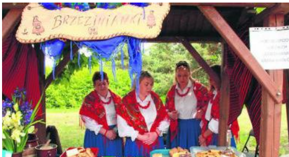
W programie jarmarku znalazła się Giełda Agroturystyczna „Swojskie Klimaty - Świętokrzyskie Smaki” oraz występy zespołów folklorystycznych.

Będzie to już czternasta edycja imprezy, która cieszy się bardzo dużym zainteresowaniem turystów i odwiedzających (średnio bierze w niej udział kilka tysięcy osób). Tegoroczna impreza, podobnie jak w roku ubiegłym, zostanie połączona z obchodami Międzynarodowego Dnia Dziecka. W związku z tym organizatorzy przygotowują szereg dodatkowych atrakcji z myślą o rodzinach z dziećmi. Będzie można wziąć udział w grach i zabawach, samodzielnie wykonać lalkę motankę czy skorzysta z oferty Osady