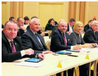
Zarząd Województwa Świętokrzyskiego podczas VIII sesji Sejmiku w obecnej kadencji.