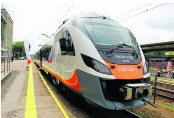
Sukces wakacyjnego pociągu z Kielca do Sandomierza, przyczynił się do uruchomienia w ubiegłym roku połączenia Kielce – Busko-Zdrój.

Tak jak w wakacje w poprzednich latach każdego dnia realizowane były dwa kursy. Pociąg z Kielca wyjeżdżał o godz. 7.40, namiejsce docierał o 10.40. Natomiast wyjazd z Sandomierza zaplanowany był o godzinie 17.39 z dojazdem do Kielca na godzinę 20.21. Przerwa w kursowaniu tego pociągu potrwa do 20 czerwca. Wtedy to połączenie wróci do wakacyjnego rozkładu jazdy i będzie realizowane do 29 września, w każdą sobotę i niedzielę oraz dodat-