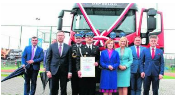
Druhowie z Belna otrzymali nowy wóz.

Samochód ratowniczo-gaśniczy, który został przekazany druhom z jednostki OSP w Belnie jest bardzo nowoczesny. Ma napęd na cztery koła i jest wyposażony między innymi w sprzęt do gaszenia oraz w maszt oświetleniowy.