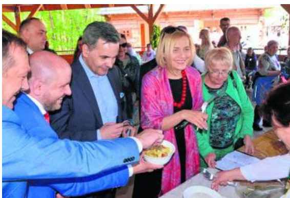
Koła Gospodyń Wiejskich, gospodarstwa agroturystyczne oraz wiele innych twórców wzięło udział w konkursie kulinarnym „Świętokrzyski pieróg”.

Na przybyłych czekało wiele atrakcji. Kucharze, restauratorzy i Koła Gospodyń Wiejskich częstowali znanymi z dawnych czasów potrawami i wyrobami. Skansen wypełniły stoiska lokalnych producentów żywności, przedstawicieli największych gospodarstw agroturystycznych w regionie oraz