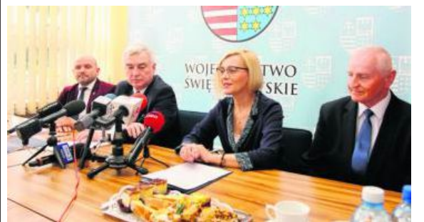
- Chcemy poprzez profesjonalne usługi doradcze wesprzeć rozwój gospodarczy regionu - wypowiadają się członkowie Zarządu Województwa.

Firmy, które będą starały się o otrzymanie takiego wsparcia same wskażą jednostkę doradczą, może to być na przykład wyższa uczelnia. Więcej na www.swietokrzyskie.pro