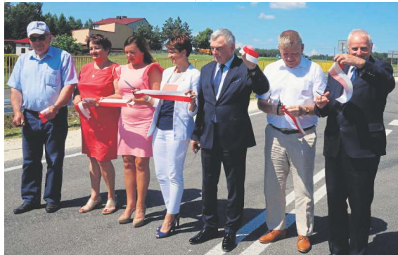
W Ćmielowie goście symbolicznie przecięli wstęgę na nowej obwodnicy.

Uroczystość oddane zostały do użytku nowe obwodnice-Ćmielowa, która jest częścią drogi wojewódzkiej numer 755, a także Staszowa ciągnącej drogi 764 (Kielce-Polaniec).