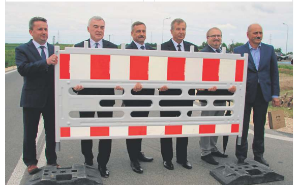
Obwodnica Staszowa zmniejszy ruch w mieście przynosząc ulgę mieszkańcom.

Całkowita wartość projektu wyniosła 71,7 mln zł, z czego wartość robót budowlanych – 63,2 mln zł. Inwestycja współfinansowana była z pieniędzy Unii Europejskiej, z Regionalnego Programu Operacyjnego, Euro-