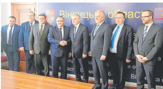
Spotkanie w siedzibie Administracji Państwowej Obwodu Winnickiego.