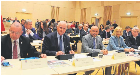
Zarząd Województwa Świętokrzyskiego.