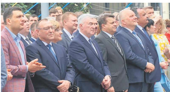
18 maja delegacja wzięła udział w winnickich obchodach Dnia Europy.

– Dzień Europy ma dla nas bardzo duże znaczenie. Jesteśmy jedynym krajem spoza Unii Europejskiej, który obchodzi to wielkie święto. My już czujemy się Europejczykami. To także duża