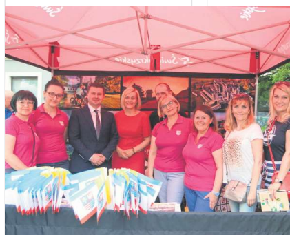
Na stoisku Urzędu Marszałkowskiego można było zasięgnąć informacji o pracy Samorządu Województwa.