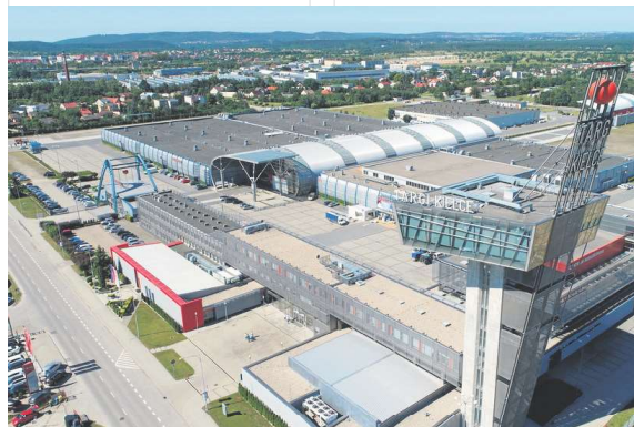
Jak czytamy w Raporcie sukcesywnie poprawia się stan infrastruktury technicznej województwa oraz konkurencyjność rodzimych firm.

Nad Raportem o stanie Województwa Świętokrzyskiego za 2018 rok, Sejmik Województwa przeprowadził debatę podczas sesji 19 czerwca, przed głosowaniem nad udzieleniem absolutorium Zarządowi Województwa Świętokrzyskiego. J.M.