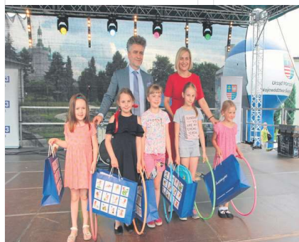
Ogromnym zainteresowaniem cieszyły się konkursy dla dzieci, m.in. pompowanie balonów na czas i hula-hop.