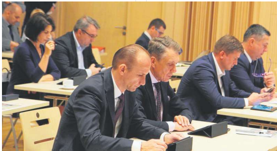
Podczas obrad sesji Sejmiku Województwa.

praw konsumentów, wspierania i upowszechniania kultury fizycznej, działalności na rzecz dzieci i młodzieży, w tym wypoczynku dzieci i młodzieży.