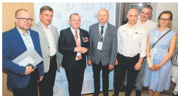
W konferencji wzięli udział świętokrzyscy samorządowcy, przedstawiciele instytucji rozwoju regionalnego, agencji turystycznych oraz dziennikarze.

Było to już szóste spotkanie poświęcone promocji usług uzdrowiskowych na rynkach zagranicznych. W konferencji wzięli udział m.in. zagraniczni dziennikarze, którzy wskazywali obszary jakie należy poprawić, aby skutecznie promować turystykę prozdrowotną, która jest jedną ze specjalizacji regionu.