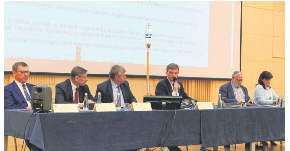
Prezydium IX sesji Sejmiku Województwa Świętokrzyskiego.