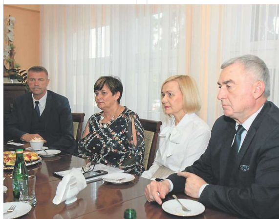
Pierwsze robocze spotkanie pozwoliło rozpocząć proces konsultacji.