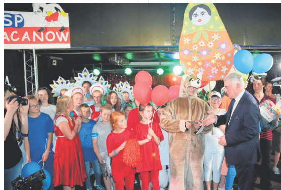
Na scenie zaprezentował się Kielecki Teatr Tańca z fragmentami „Dziadka do orzechów”, a Zespół Teatralny Bambo przedstawił „Bajkę o sennej Nutce”.