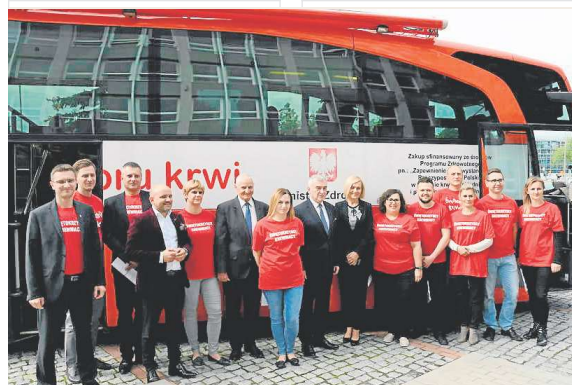
– Cieszę się, że wykazujecie się tą wspaniałą, honorową postawą ofiarując krew, która w okresie letnim jest bardzo potrzebna – mówił marszałek.

Krew można również oddać w siedzibie Regionalnego Centrum Krwiodawstwa i Krwiolęcznictwa w Kielcach. Obecnie największe zapotrzebowanie jest na grupy krwi: A Rh minus, B Rh minus i O Rh minus.