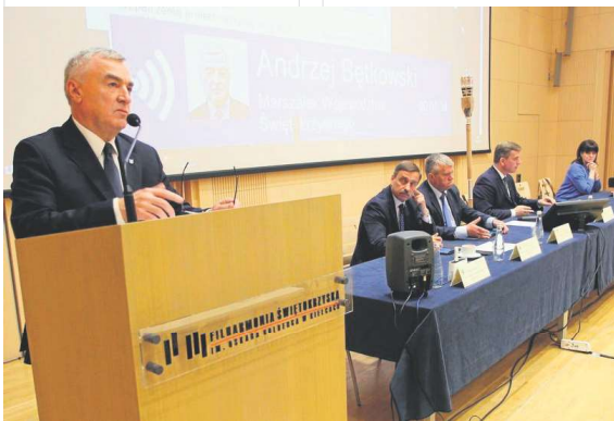
- Na czas remontu siedziby teatru musimy przygotować scenę zastępczą – mówił marszałek województwa Andrzej Bętkowski.

Radni przyjęli uchwały w sprawie zmiany Wieloletniej Prognozy Finansowej Województwa Świętokrzyskiego na lata 2019 – 2043 oraz w sprawie zmian w budżecie województwa