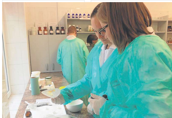
Szkoła wznawia nabór na kierunek technik farmaceutyczny. To zawód wymagający odpowiedzialności oraz szerokiej wiedzy.

Szczegółowe informacje o organizacji kształcenia, poszczególnych kierunkach i zasadach rekrutacji można uzyskać w siedzibie CKZiU przy ul. Legionów 124 w Skarżysku-Kamiennej, telefonicznie pod nr 412531946, mailowo: kontakt@ckziu.pl. Z ofertą można również zapoznać się na stronie internetowej www.ckziu.pl