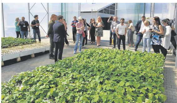
Wizyta w Gospodarstwie Nasiennym-Szkółkarskim w Sukowie – Papierni.

Ważnym elementem programu były wizyty w instytucjach i firmach działających w obszarach biogospodarki i bio-energetyki, m.in.: