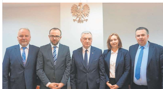
Wizyta u Konsula Generalnego RP w Winnicy Damiana Ciarcińskiego.