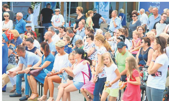
Piknik z okazji Dnia Samorządu Terytorialnego zgromadził na Placu Artystów w Kielcach tłumy kielczan. Bawili się i dorośli, i dzieci.