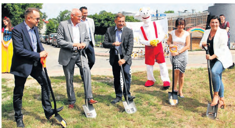
Podpisanie umowy dotyczącej rozbudowy Europejskiego Centrum Bajki o zewnętrzny park towarzyszyło uroczyste wbicie łopat na placu budowy.

Park edukacyjny złożony będzie z ogólnodostępnej części rekreacyjnej ze skateparkiem, przestrzenią do organizacji koncertów i spotkań oraz placu z fontannami – latem, a lodowiskiem – zimą. Pozostały obszar to prawdziwa gratka dla miłośników literatury. Park zostanie podzielony na 4 ogrody: komiksów, legend, bajek i baśni oraz powieści. Dla zwiedzających dostępne będą ścieżki tema-