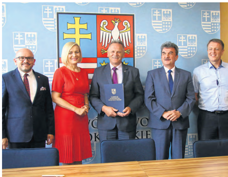
Podpisanie umowy na dofinansowanie rozbudowy szkoły w Broninie.