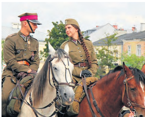
Uczestnicy przemarszu poznają „żywą historię”, uczą się odpowiedzialności, nawiązują przyjaźnie.