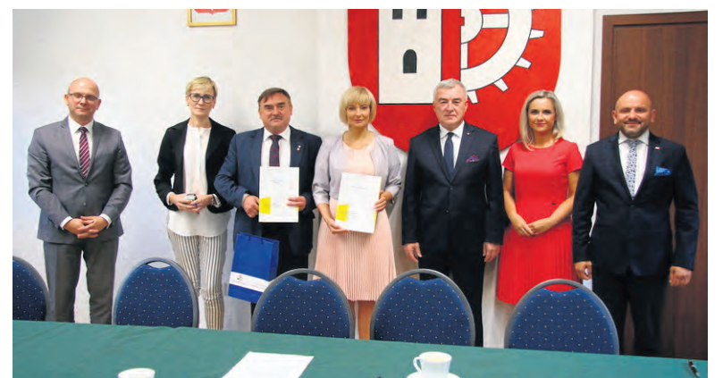
W imieniu Zarządu Województwa Świętokrzyskiego umowy podpisali marszałek Andrzej Bętkowski i członek Zarządu Województwa Mariusz Gosek.

- Kończymy podpisywanie z gminami umów na rozwój infrastruktury edukacyjnej i sportowej. W tej chwili wydatkowaliśmy już 161 mln zł, wspierając projekty w różnych gminach - podsumowuje marszałek województwa świętokrzyskiego Andrzej Bętkowski . JM