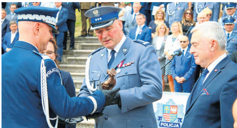
Nagroda Koziółka dla Komendanta Głównego Policji gen. insp. Jarosława Szymczyka od kapituły Nagrody Bezpieczne Świętokrzyskie.

Marszałek wraz z innymi członkami kapituły Nagrody Bezpieczne Świętokrzyskie uhonorował Komendanta Głównego Policji gen. insp. Jarosława Szymczyka statuetką Koziółka. JM