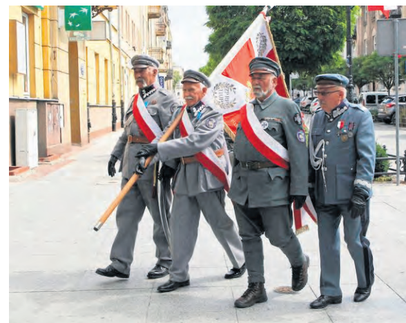
Co roku w marszu biorą udział członkowie stowarzyszeń kultywujących tradycje legionowe.