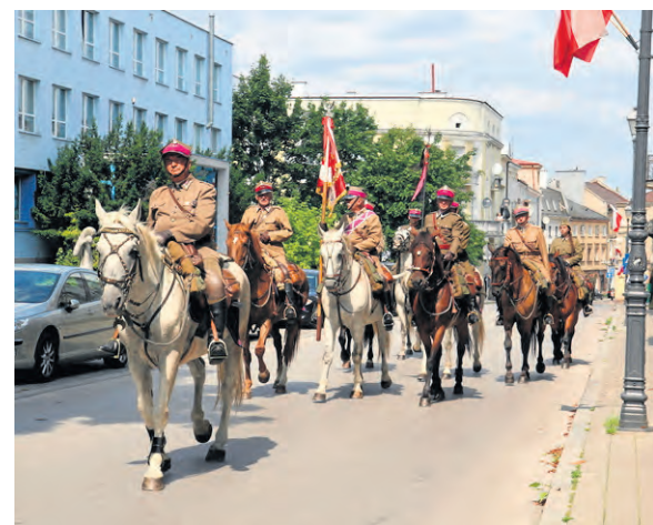
W LIV. Marszu Szlakiem I Kompanii Kadrowej wzięło udział ponad 350 uczestników.