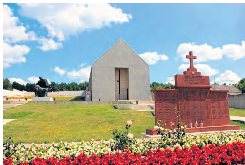
Marszałek województwa świętokrzyskiego czyni starania, by minister kultury i dziedzictwa narodowego wydłużył termin zakończenia projektu.