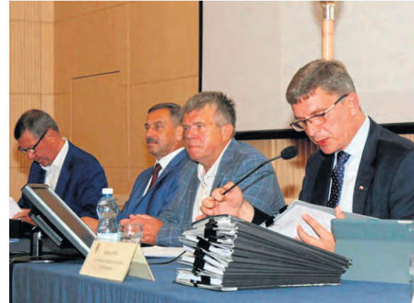
Prezydium Sejmiku Województwa Świętokrzyskiego podczas posiedzenia XI sesji.