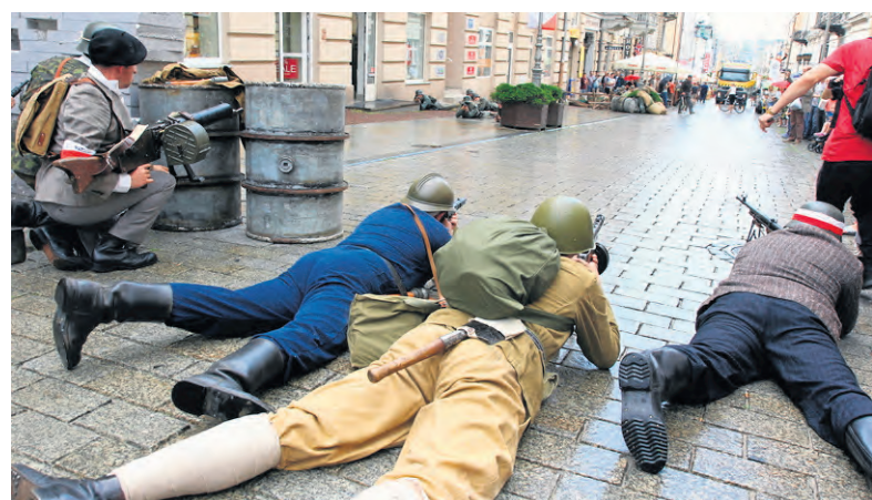
W centrum Kielc przedstawiono rekonstrukcję historyczną związaną z wybuchem powstania. Walkom na ul. Sienkiewicza przyglądali się mieszkańcy.