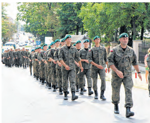
W marszu wzięli udział żołnierze i uczniowie szkół im. Józefa Piłsudskiego.