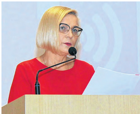
Wicemarszałek województwa Renata Janik przedstawiła regionalny program wspierania rodziny.