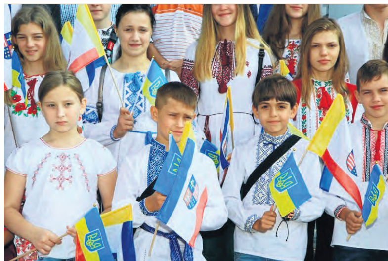
Pobyt ukraińskich dzieci był nie tylko okazją do poznania województwa świętokrzyskiego, ale też pozwolił im odpocząć od problemów dnia codziennego.