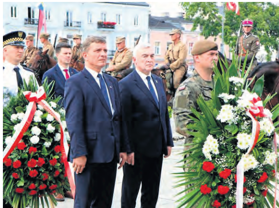
Uczestnicy marszu szlakiem legionistów i przedstawiciele władz złożyli kwiaty pod pomnikiem Józefa Piłsudskiego.