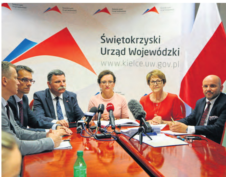
Od 1 września br. wiele długo oczekiwanych kursów zostanie przywróconych.

- Ta ustawa jest przykładem rządowego wsparcia zadań własnych spoczywających na samorządach. Mam nadzieję, że wiele z tych połączeń zostanie przywróconych. W wielu gminach spotykałam mieszkańców, którzy narzekali na ogromne kłopoty z przemieszczaniem się ze