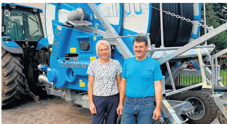
Starościna zajmuje się gospodarstwem - produkcją zbóż i hodowlą bydła.