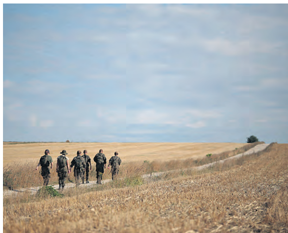
Uczestnicy marszu pokonują 120-kilometrową, historyczną trasę przemarszu I Kompanii Kadrowej.