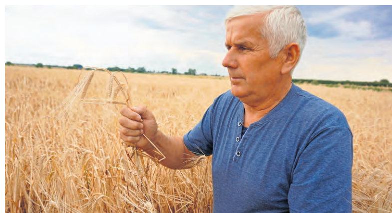
Starosta dożynek prowadzi gospodarstwo, zajmuje się produkcją zbóż.