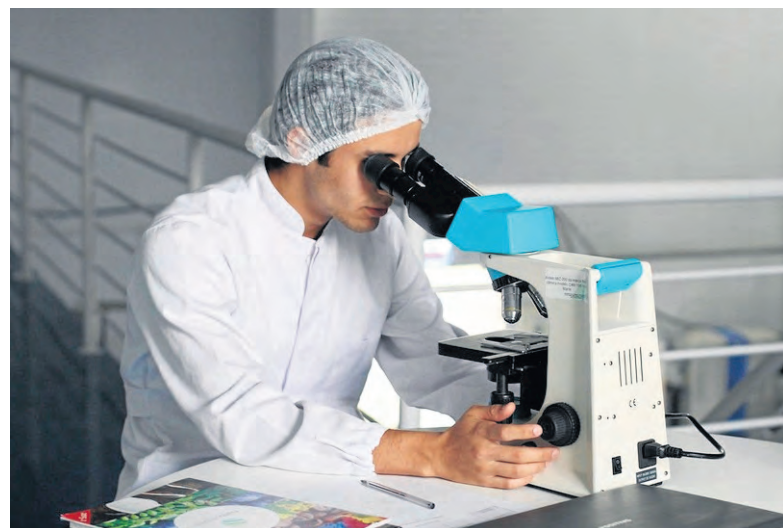
Zgłoszone do konkursu rozwiązania podlegają ocenie przez Komisję, która przyznaje nagrody pieniężne twórcom tych rozwiązań.

Formularz zgłoszeniowy oraz regulamin konkursu dostępne są w wersji elektronicznej na stronie internetowej www.swietokrzyskie.pro