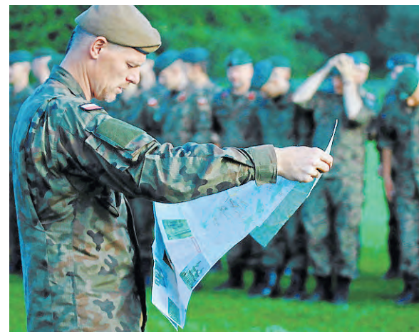
Pobudka o świcie, poranny apel i dalej w drogę szlakiem Kadrówki.