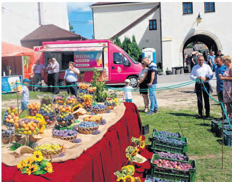
Wszyscy uczestnicy święta mogli skosztować szydłowskich śliwek.

Mimo zniszczeń postanowiono nie odwoływać uroczystości. Rozpoczęły się