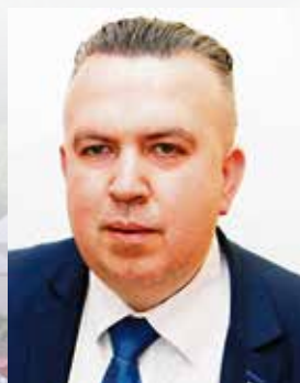
MARIUSZ BODO Sekretarz Województwa Świętokrzyskiego

Łatwiej dotrzeć ze swoim problemem do radnego, będącego jednocześnie sąsiadem lub osobą nam znaną. Sądzę, że dobry samorządowiec powinien mieć swój udział w budowaniu kapitału społecznego. Odpowiedzialność za dobro wspólne zaczyna się bowiem na najniższym szczeblu. W ten sposób samorządność okazuje się najlepszą formą realizowania oczekiwań lokalnej wspólnoty.