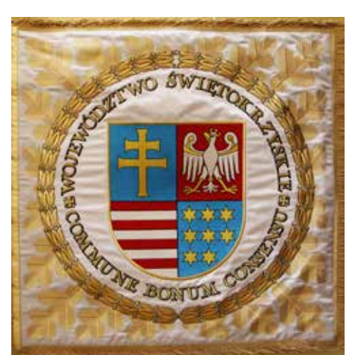
Sztandar Województwa Świętokrzyskiego

rozвивać swoje małe ojczyzny. Minione 30 lat udowodniło, że ludzie chcą coś zmienić w najbliższym otoczeniu i to się udaje. Tworzymy coraz więcej instrumentów, mamy coraz więcej doświadczenia w różnych sytuacjach, także tych kryzysowych. Na pewno czas może nas niejednokrotnie zaskakiwać różnymi wydarzeniami. Teraz mamy sytuację z pandemią i też okazuje się, że te elementy, które w samorządzie są istotne – solidarność i współdziałanie – pokazują, że samorządowcy potrafią wspierać się, potrafią zachowywać się bardzo prospołecznie. Mam nadzieję, że młode pokolenie, które przejmuje pałeczkę samorządności będzie próbowało sprostać tym nowym wyzwaniom, jakie będą stawać w kolejnych latach przed wspólnotami gminnymi, powiatowymi i wojewódzkimi.