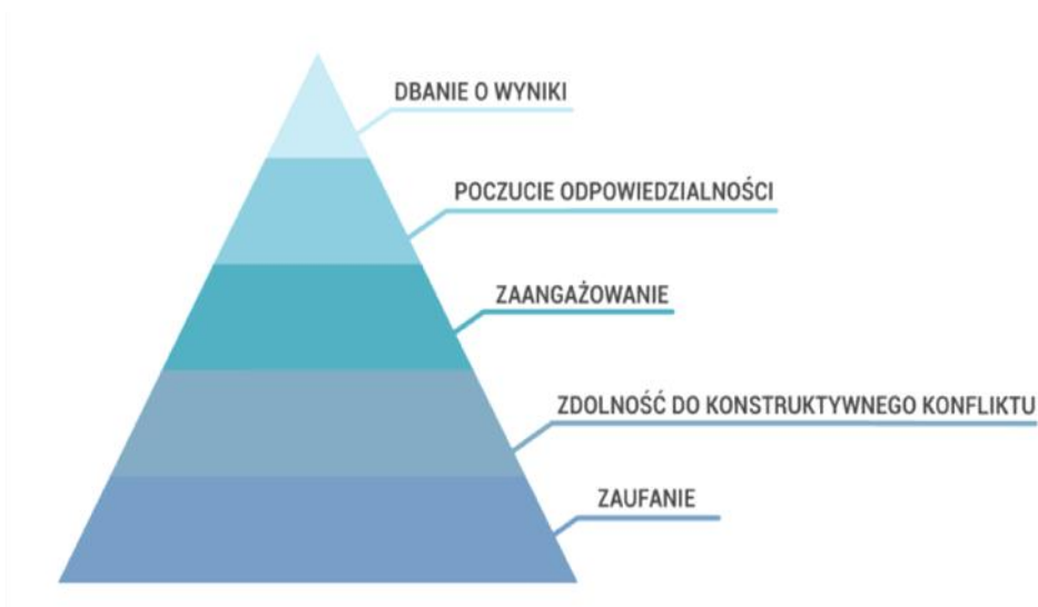
Schemat 2. Etapy budowania zespołów