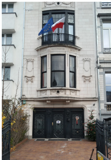
Dom Polski Wschodniej w Brukseli