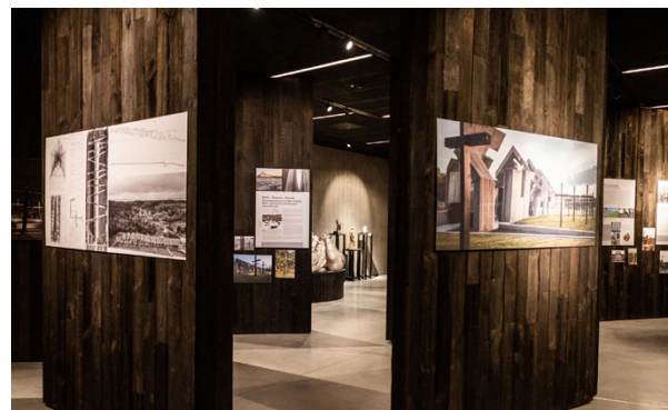
Wystawa Architektura Pamięci w Mauzoleum w Michniowie