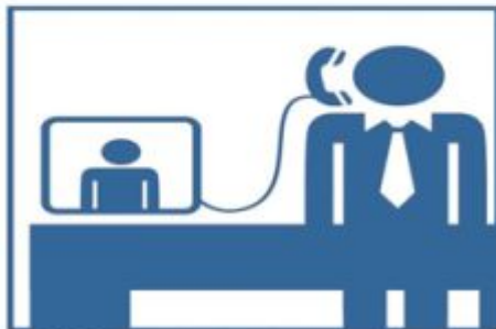
3. Zdefiniowanie tematu rozmowy.