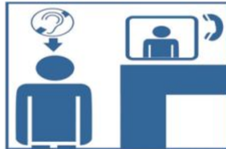
2. Nawiązanie komunikacji z interaktywnym tłumaczem języka migowego.