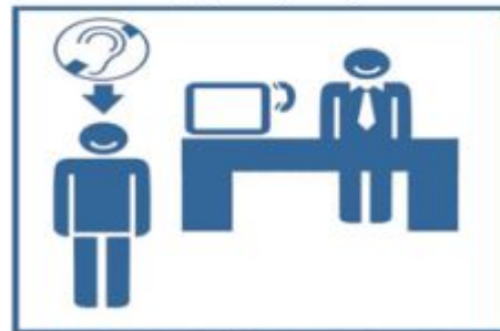
4. Rozwiązanie problemu.