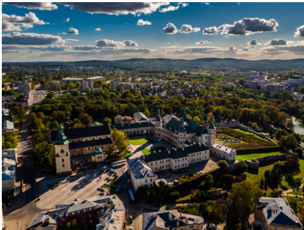
Muzeum Narodowe w Kielcach i panorama Gór Świętokrzyskich

Przedstawiamy cały sznur świętokrzyskich pereł. Niech przekonają tych niezdecydowanych do odwiedzenia naszego regionu.