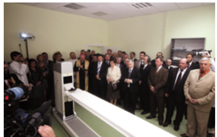
Uroczystość otwarcia ośrodka PET zgromadziła wielu znakomitych gości