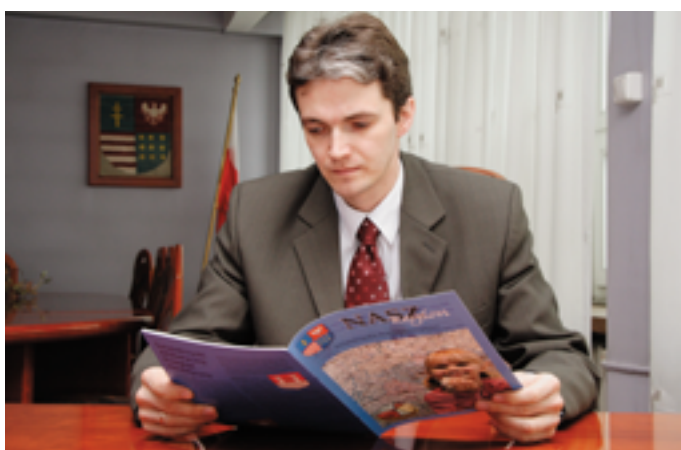
Najwierniejszy czytelnik „Naszego Regionu”