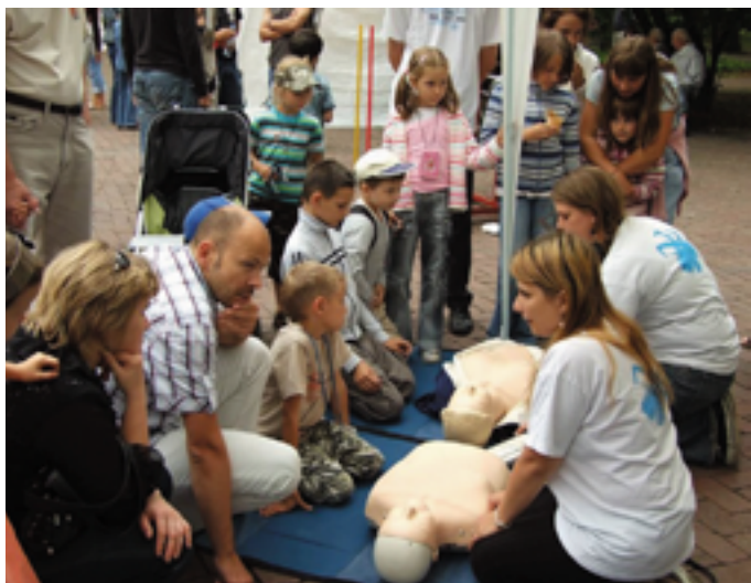
Pokazy w Parku Miejskim w Kielcach

W Kielcach, Stowarzyszenie FRAKTAL prowadzi sekcję w pięciu szkołach ponadpodstawowych: I LO im. S. Żeromskiego, II LO im. J. Śniadeckiego, IV LO im. H. Sawickiej, V LO im. Ściegiennego oraz Gimnazjum im. Św. Jadwigi.