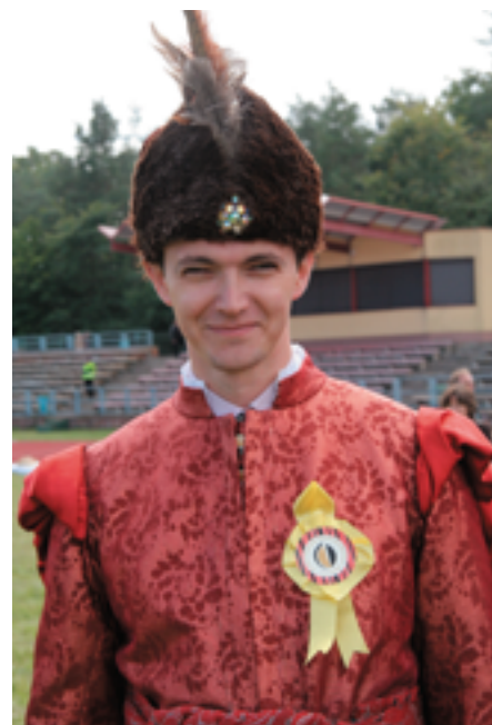
Panowie szlachta! Do buławy!