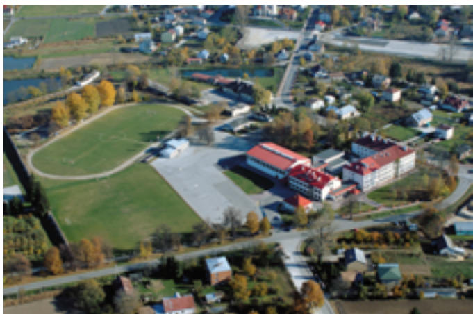
Stopnica z lotu ptaka

W Stopnicy inwestują w pamięć. Pamięć o dawnych czasach, dawnych twórcach, kulturze. Między innymi właśnie dlatego samorząd przeznaczają duże środki na ocalenie tego, co stanowi o ciągłości kulturowo - historycznej tej ziemi. W ostatnich latach zaadaptowano pomieszczenie