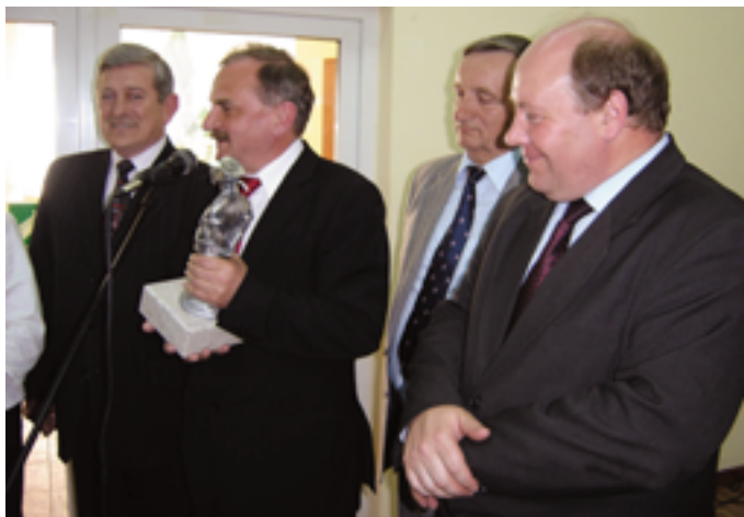
Przedstawiciele Samorządu Województwa oraz Związku Miast i Gmin Regionu Świętokrzyskiego