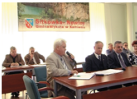
Podczas obrad Komisji w Sitkówce-Nowinach

rozdysponowania środków Funduszu Ochrony Gruntów Rolnych.