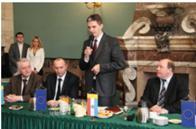
Zarząd Województwa Świętokrzyskiego

Wartość zawartych pre-umów opiewa na prawie 453 miliony złotych.