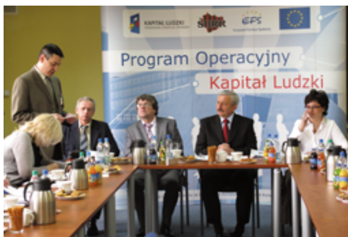
Podczas konferencji pracowej w ŚBRR