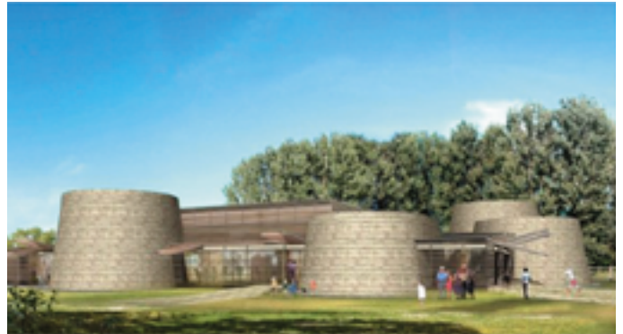
Wizualizacja Europejskiego Centrum Bajki

Inwestycja kosztować będzie 24 mln zł. Jest ona finansowana z Mechanizmu Finansowego Europejskiego Obszaru Gospodarczego i Norweskiego Mechanizmu Finansowego, środków Ministerstwa Kultury i Dziedzictwa Narodowego, gminy Pacanów, natomiast 5,4 mln zł. przekazał samorząd województwa świętokrzyskiego.